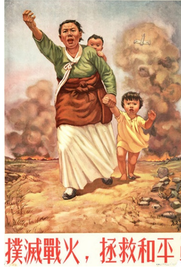
Resim 5. "Barış" Konulu Propaganda Posterleri

Propaganda posterleri Kore Savaşı'nın ikinci yılında hazırlanmıştır. Çin propagandası savaşın ikinci yılında da ABD ordusunun Koreli sivillere büyük ölçüde zarar verdiği algısını oluşturmaya çalışmaktadır. Bu aşamada posterde resmedilen Koreli kadın ve çocukları, ABD ordusu tarafından mağdur edilen Koreli sivillerin metonimi olarak yansıtılmaktadır. Kadının görsel kodlar içerisindeki jest ve mimikleri, ABD ordusuna karşı Koreli sivillerin öfkesinin bir temsili olarak sunulmaktadır. Posterde, savaşın başında kullanılan propaganda posterlerinde olduğu gibi "ABD ordusu Koreli sivillere zarar vermektedir" şeklinde propaganda miti inşa edilmeye çalışılmaktadır. Bu amaçla posterde ABD ordusu, zulüm ve saldırı; Koreli siviller esaret ve savunma soyut kavramları üzerinden somutlanmaktadır. Posterdeki yazılı kodlar üzerinden de savaşın sonlanmasına ve barışın korunmasına çağrı yapılmaktadır. Bu aşamada Çin propagandası ABD ordusunu barışı bozan, Çin ordusunu da barışı sağlayan taraf olarak yansıtmaya çalışmaktadır. Çin yönetimi bu süreçte Çin ordusunun savaşa müdahalesini hem Çin'de hem de uluslararası alanda meşru kabul ettirmeyi hedeflemektedir.