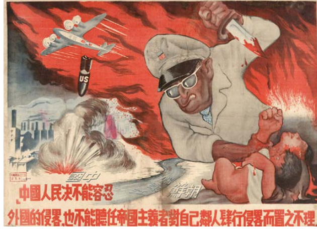
Resim 1. "Katliam" Konulu Propaganda Poster

Posterde yer alan Amerikan askeri tüm Amerikan ordusunun, Koreli siviller de tüm Kore halkının metonimi (temsili) olarak ön plana çıkmaktadır. Böylece Çin propagandası mesajın genele verilmesini amaçlamaktadır. Posterde doğrudan "Amerikan ordusu Kore'de sivil halka katliam yapmaktadır" şeklinde propaganda miti inşa edilmeye çalışılmaktadır. Bu amaçla posterdeki görsel kodlar üzerinden ABD askerleri, ölüm, suç, saldırı; Koreli siviller yaşam, masumiyet, savunma soyut kavramları üzerinden somutlanmaktadır. Çin propagandası, ABD'nin Koreli sivilleri kurtarmak vaadiyle müdahalede bulunduğu Kore savaşında, söylediklerinin tam tersini yaparak sözde sivilleri katlettiğini aktarmaktadır. Diğer yandan ABD Hava Kuvvetleri tarafından Kore üzerinde yapılan bombardımanlarda yalnızca sivil yerleşimlere zarar verildiği algısı oluşturulmaya çalışılmıştır. Yazılı kodlar üzerinden de Çin'in yaşanan sözde bu zulme kayıtsız kalamayacağı ve ABD'ye karşı müdahalede bulunacağı mesajı verilmektedir. Çin yönetimi, kendisini dünya kamuoyunda "kurtarıcı" olarak sunarken, ABD'yi de Koreli sivilleri ölüme sürükleyen "katiller" olarak yansıtmaktadır. Böylece Çin'in, Kore Savaşı'na yönelik müdahalesinde uluslararası alandan destek bulmaya çalıştığı ortaya çıkmaktadır.