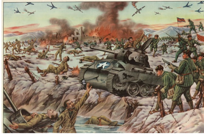
Resim 6. "Emperyalizm" Konulu Propaganda Poster

Propaganda posterleri savaşın son yılında hazırlanmıştır. Posterde Çin ve Kuzey Kore ordularının işbirliği içerisinde savaşarak ABD kuvvetlerini bozguna uğrattığı aktarılmaktadır. Bu aşamada ABD ordusu işgalci, Çin ve Kuzey Kore ordusu ise vatanlarını savunan kahramanlar olarak posterde sunulmaktadır. Görsel kodlar içerisinde Çin ve Kuzey Kore ordularının kararlı bir şekilde savaştığı, buna karşın ABD askerlerinin teslim olduğu veya savaştan kaçtığı yansıtılmaktadır. Bu aşamada posterlerde Çin ve Kuzey Kore ordusunun zafer ve saldırı; ABD ordusunun ise hezimet ve kaçış gibi soyut kavramlar üzerinden somutlandığı ortaya çıkarılmaktadır. Posterde bu şekilde "ABD, Kore Savaşı'nı kaybetti" şeklinde propaganda miti oluşturulmaya çalışılmaktadır. Böylece Çin ve Kuzey Kore ordularının daha kararlı ve daha inançlı savaşmalarının teşvik edilmesi hedeflenmiştir. Posterdeki yazılı kodlar üzerinden ABD'nin sözde emperyalist bir güç olduğuna vurgu yapılmakta, böylece Kore Savaşı'nın asıl nedeninin emperyalizm ile komünizm savaşı olduğu aktarılmaktadır. Çin propagandası bu nedenle ABD'ye karşı yalnızca Kuzey Kore'nin değil, komünizm ideolojisine inanan herkesin destek vermesini istemektedir.