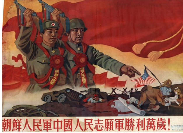
Resim 3. "Zafer" Konulu Propaganda Posterı

Posterdeki görsel kodlar üzerinden ABD'nin Kore'de büyük bir hezimete uğradığı aktarılmakta, ABD ordusunun geri çekilerek savaşı kaybettiği vurgusunun yapıldığı görülmektedir. Bu amaçla posterde kullanılan askerler sırasıyla Çin, Kuzey Kore ve ABD ordularının tümünün metonimi olarak kullanılmaktadır. Posterde Kore Savaşı'na yönelik Çin'in müdahalesi aktarılmaktadır. Çalışma kapsamında incelenen ilk iki posterde Çin propagandası, Çin ordusunun ABD'ye karşı Kore Savaşı'na müdahalesini meşrulaştırmak için çalıştığı görülmüştür. Bu posterde ise Çin'in doğrudan savaşa müdahil olduğu ve ABD ordusunu büyük bir hezimete uğrattığı mesajı verilmektedir. Posterde, "ABD, Kore Savaşı'nda komünist güçler tarafından yenilgiye uğratıldı" şeklinde propaganda miti inşa edilmeye çalışılmaktadır. Bu amaçla posterde ABD askerleri yenilgi ve saldırı; Çin ordusu ise zafer ve savunma soyut kavramları üzerinden somutlanmaktadır. Çin propagandası, ABD'nin yenildiği izlenimini oluşturarak Çinli ve Kuzey Koreli askerlerin daha istekli savaşmalarını hedeflenmektedir. Diğer yandan propaganda posterinde kırmızı bayraklar üzerinden komünizm ideolojisinin de propagandası yansıtılmakta, Çin ve Kore halkı arasındaki ortak bağın komünizm olduğu vurgusu yapılmaktadır.