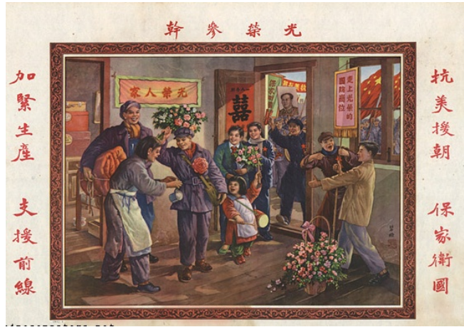
Resim 4. "Kutlama" Konulu Propaganda Poster

Posterde Çin ordusunun Kore Savaşı sırasında ABD ordusuna karşı harekete geçtiği aktarılmaktadır. Posterdeki görsel kodlarda kırmızı bayrakların taşınması komünizm ideolojisinin, Mao'nu resminin taşınması da Mao'nu kült liderliğinin Çin toplumu üzerindeki bir yansıması olarak sunulmaktadır. Halkın cepheye giden askerlere çiçekler vermesi ve kutlamalar yapması "Çin halkı Kore Savaşı'nda ABD'ye karşı müdahaleye destek vermektedir" propaganda mitinin inşa edilmesini sağlamaktadır. Posterdeki görsel kodlardan ABD'nin savaşı kaybedeceği, Çin ordusunun ise büyük bir zafer kazanacağı algısı oluşturulmaya çalışılmaktadır. Bu aşamada posterde Çin halkı sevinç ve zafer; ABD ordusu ise hüznü ve mağlubiyet soyut kavramları üzerinden somutlanmaktadır. Posterdeki yazılı kodlar da görsel kodları destekler mahiyette, Çin halkını ABD'ye karşı savaşa teşvik etmeye çalışılmaktadır. Bu şekilde Çin yönetimi, Çin halkının Kore Savaşı'nda zorla savaştırıldığı algısını yıkmayı amaçlamakta ve Çin toplumunun genelinde savaşa yönelik büyük bir destek olduğu algısını inşa etmeyi hedeflemektedir.