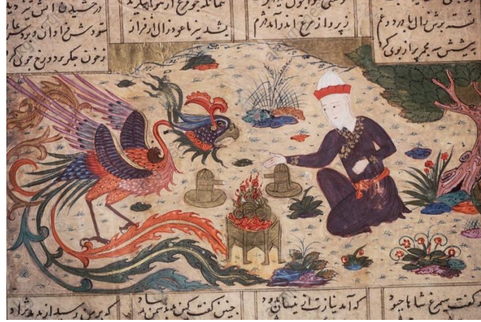
Görsel 12. Firdevsi, Şahname'den Elyazması, Prens Zal ve Simurg, Minyatürden Detay, Kağıt Üzerine Guaj, 1458, Hindistan Ulusal Müzesi, Yeni Delhi, Hindistan [6]

yaratım sürecini tetikleyen güçlü metaforlar mevcuttur. Bir kuş imgesi olan Simurg da bunlardan biridir.