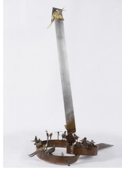
Görsel 14. Murat Morova, Kuşların Konferansı, 185x76x112, Demir, Pirinç, Gümüş kaplama ve Çinko, 2016 [23] (Image 14. Murat Morova, Conference of Birds, 185x76x112, Iron, Brass, Silver plated, and Zinc, 2016)

Venedik Bienal'inde de sergilenen The Phoenix (Görsel 15-16) adlı devasa yerleştirmesidir. 2008'de Xu Bing Pekin'deki Dünya Finans Merkezinin resmi atriyumu için bir heykel yapmakla görevlendirilir. Xu Bing şantiyeye gittiğinde karşılaştığı manzara karşısında dehşete düşer. İşçilerin yaşam standartları ve çalışma koşulları korkunçtur. Toplumun en alt tabakası toplumun en üst tabakası, en zenginleri için çok kötü şartlarda büyük ve gösterişli yapılar inşa etmek durumundadır. Emek ve sermaye arasındaki bu çelişki sanatçıya Çin felsefesindeki yin-yang öğretisini çağırıştırır. Yaşam zıtlıklar üzerine kuruludur. İyi-kötü, zengin-fakir, yaşam-ölüm gibi dualitelerden hareketle yine Çin mitolojisinin Simurg'u, Feng (erkek) - Huang (dişi) üzerinden bu çelişkiyi ele alır. İki devasa kuştan oluşan bu yerleştirmenin tamamı kentsel Çin'deki inşaat alanlarından bir zamanlar şantiyede çalışan göçmen işçiler tarafından toplanmış, yıkım enkazı, çelik kiriş, işçilere ait günlük kullanım araçları (koruma kaskı, kürek, hortum vs.) gibi atık malzemelerden oluşur. Feng-Huang'ın batıdaki karşılığı Phoenix'tir. Çalışma Phoenix adıyla ilk olarak 2010'da Sanghai'da daha sonra 2014'de New York'da Aziz John Katedralinde ve son olarak da 2015'de 56. Venedik Bienalin'de sergilenir [24].