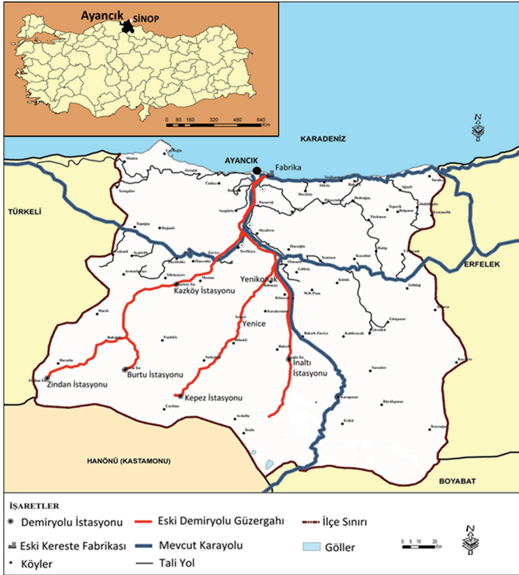
Şekil 1. Lokasyon haritası. Figure 1. Location map.

deki ticari hayatı canlandırmıştır. Fabrika kurulduğunda 300 haneden oluşan, 2.000 nüfuslu küçük bir kasaba olan Ayancık, şirketin yarattığı istihdam imkanları sayesinde hızla gelişmiştir. Orman köylüsü ve ilçe halkı ekonomik olarak kalkınmış, eğitim, spor, giyim, sosyal hayat, mimari gibi birçok alanda Türkiye’de eşine az rastlanır bir ilerleme yaşanmıştır (Kaya ve Yılmaz, 2018a; Kaya ve Yılmaz, 2018b).