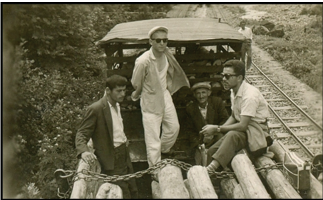
Fotoğraf 5. Tomruk üzerinde seyahat birçok açıdan tehlikeliydi. Düşme vb. durumlar köylüler için hayati tehlike arz ederken trenin bacasından çıkan kıvılcım, kül vb. malzemeler seyahat edenlerin kıyafetlerine zarar veriyordu.

Photo 4. The wagons added to the trains were one of the most important transportation vehicles of the villagers