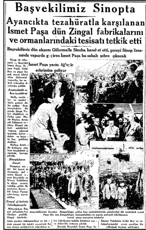
Fotoğraf 17. Başbakan İsmet İnönü'nün Ayancık ziyareti (Cumhuriyet Gazetesi, 1934).

Ülkenin ilk ve en önemli yabancı sermaye yatırımlarından olan ZİNGAL kereste fabrikası aynı zamanda Türk ormancılığının gelişimini sağlamak amacıyla kurulmuş bir okul görevi üstlenmiştir. Bunun için ülke genelinde tetkik için seyahate çıkan birçok devlet büyüğünün duraklarından biri her daim Ayancık olmuştur. Bu ziyaretlerde demiryolu ile orman içi üretim sahaları da gezi programına dahil edilmiştir (Fotoğraf 17).