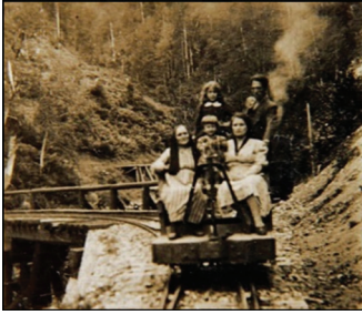
Fotoğraf 15. Aileleri ile birlikte, Karadere'den Duduncuk'a vagonetle yolculuk yapan öğrenciler.

Üretim yapılan orman sahasında orman işçileri, mühendis ve uzmanlarla beraber önemli miktarda nüfus bir araya gelmekteydi. Orman çalışanlarının çocukları için belirli merkezlerde (Duduncuk/Çangal gibi) okullar açılmıştı. Okul bulunmayan sahalardaki öğrenciler demiryolu vasıtasıyla okullarına ulaştırılıyordu. Vagonetlere binen çocuklar kimi zaman yakınlarındaki bir köy okuluna kimi zaman da ilçe merkezinde yer alan okullarda eğitim alabilişlerdir (Fotoğraf 15).