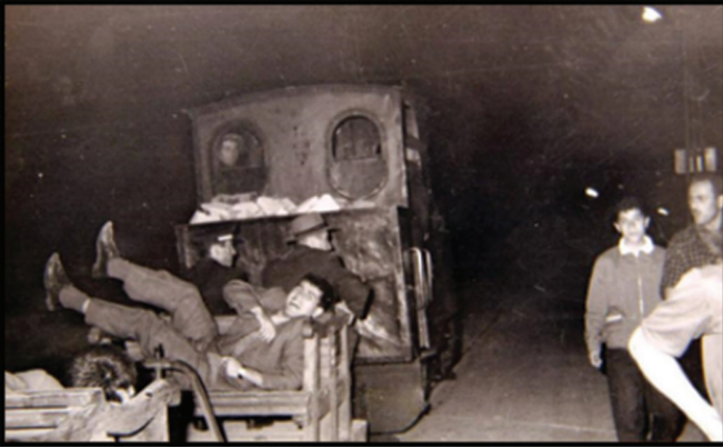
Fotoğraf 4. Trenlere eklenen vagonetler köylülerin en önemli ulaşım araçlarından biriydi.

Dekovil hattında tomruk taşıyan trenler yolculuk için çok elverişli değildi. Bazı durumlarda trenlere eklenen vagonlarda seyahat edilirken kimi durumlarda tehlikeli olmasına rağmen tomrukların üzerinde yolculuk yapılıyordu (Fotoğraf 4-5).