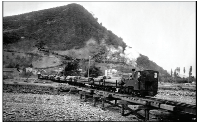
Fotoğraf 1. Dekovil hattı ile tomrukların fabrikaya taşınması (Yılmaz ve Kaya, 2018:157).

Dekovil hattı, havai hatta göre daha fazla yük taşıma kapasitesine sahip olması, uzun seneler arıza göstermeden çalışabilmesi ve arıza olsa bile malzemenin hemen temin edilebilmesi gibi nedenlerle uzun yıllar boyunca fabrikaya tomruk taşımada kullanılan en önemli ulaşım aracı olmuştur. (Fotoğraf 1).