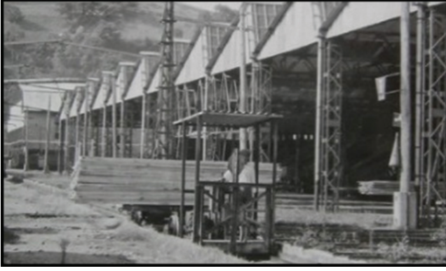
Fotoğraf 19. Aynı hatlar üzerinde yine kereste taşımak için kullanılan (elektrikli) tramvay sistemi.

Photo 19. (Electric) tramway system used to carry timber again on the same lines.