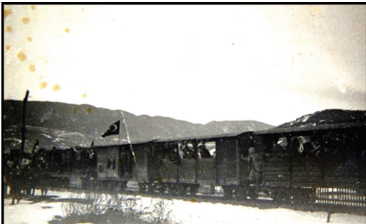
Fotoğraf 16. Dekovillerin arkasına bağlanan vagonlarla gelin alma konvoyu olarak kullanılması (Atike ÖZBİLEN Albümü).

Şirket yerel halkla ilişkilerini sıcak tutmak amacıyla zaman zaman tohum yardımı, battaniye yardımı gibi faaliyetlerde bulunduğu gibi halkın şirket imkânlarından azami derecede faydalanmalarına da imkân sağlamıştır. Köylülerin sadece ilçe merkezine ulaşmak ya da dönmek için değil, düğün veya cenaze gibi organizasyonlarında da demiryolundan faydalanmalarına imkân verilmiştir (Fotoğraf 16).