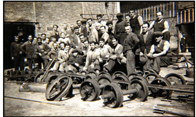
Fotoğraf 24. Zingal dekovil atölyesi çalışanları.

Şirket günün şartlarında arızalar karşısında daha hızlı çözüm üretebilmek için bir atölye kurmuş, burada tamirat ve yedek parça üretimi yapmıştır. Bu sebeple demiryolu için sadece makinist istihdam edilmemiş, raylar ve trenlerin bakım ve onarımını yapacak ustalar yetiştirmiş, bu alanda da birçok işçi istihdam etmiştir (Fotoğraf 24).