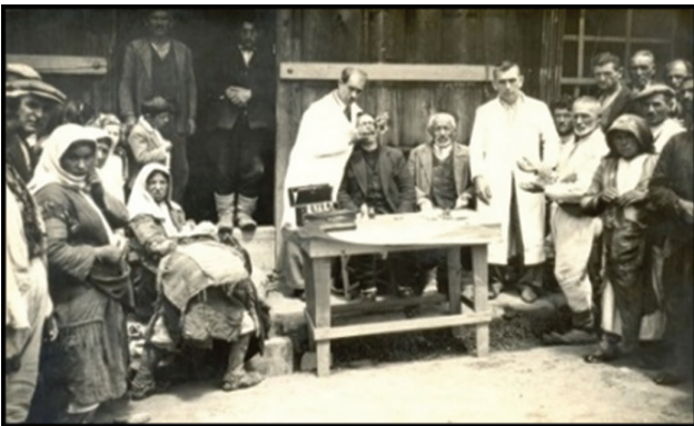
Fotoğraf 21. Şirket öncülüğünde köylerde yapılan sağlık taramaları.

Photo 20. A theater play in the village by the Community Center