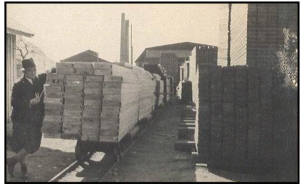
Fotoğraf 18. Kereste parkına ulaşım amacıyla kurulan fabrika içi demiryolu sistemi (Kent ve Demiryolu, 2019).

Fabrikaya tomruk taşınması için kullanılan demiryolu hattı aynı zamanda fabrikada üretilen ürünlerin fabrika içinde nakliyat alanlarına ya da kereste parklarına taşınması için de kullanılmıştır (Fotoğraf 18-19).