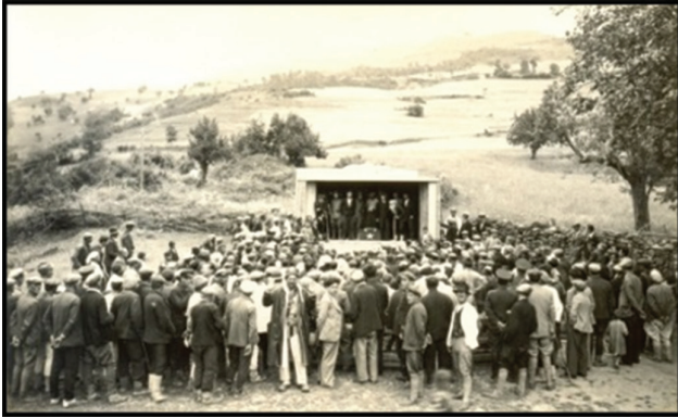
Fotoğraf 20. Halkevi tarafından köyde sergilenen bir tiyatro oyunu.

Demiryolu sistemi, kırsal alanlar ile kasaba/şehir merkezi arasında ekonomik bağ kurmasının yanında sosyal-kültürel faaliyetler için de ayrı bir görev yerine getirmiştir. Şehirlerde mevcut birçok sosyal imkân bu sayede kırsal alanlara ulaştırılabilmektedir (Fotoğraf 20-21).