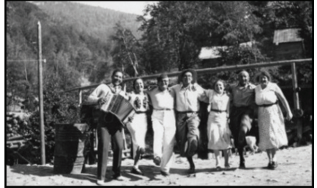
Photo 11. Foreign visitors visiting Ayancık forests and having fun here with the help of the railway line.

Fotoğraf 12. Demiryolu hattı yardımıyla Ayancık ormanlarını ziyaret eden ve burada eğlenen yabancı ziyaretçiler.