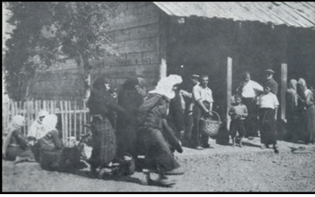
Fotoğraf 3. İlçe merkezinden köylerine dönmek için treni bekleyen köylüler.

Photo 3. Villagers waiting for the train to return to their village from the district center.