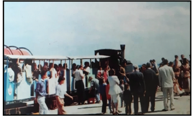
Fotoğraf 34. Günün belirli saatlerinde ilçe merkezinde belirlenen güzergâhta ilerleyen tren yerel halk tarafından hemen benimsenmiştir. İnsanlar evlerine giderken, pazara gidip-gelirken bu hattı kullanmıştır.

Photo 33. At certain times of the day, the train going on the route determined in the district center was immediately adopted by the local people. People used this line when going home, going to the market and coming from the market