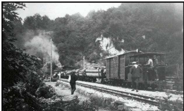
Fotoğraf 2. Sabah fabrikaya tomruk taşıyan trene binmek için bekleyen köylüler.

Ayancık Kereste Fabrikasında işlenen tomruklar, Çangal ve Zindan ormanlarından elde ediliyordu. Bu tomrukların elde edilmesinde kullanılan en önemli ulaşım aracı olan demiryolu sistemi Ayancık ilçe merkezinde yer alan fabrikadan başlıyor, Ayancık Çayı ve kollarına ait vadileri takip ederek orman içi sahaya ulaşıyordu. Dekovil hattı etrafındaki köylerde ikamet edenler fabrikada çalışmak veya ilçe merkezine ulaşmak için bu hattı kullanıyor, sabah treni ile ilçe merkezine inen köylüler akşam boş vagonlarla geri dönüyorlardı (Fotoğraf 2-3).