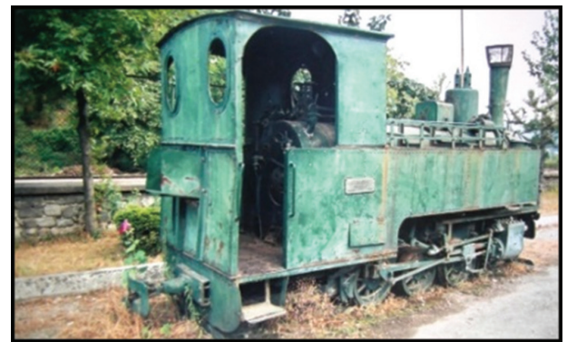
Fotoğraf 35-36. Ayancık ilçe merkezinin farklı kesimlerinde sergilenen (solda) ve fabrika yerleşkesi içinde bulunan (sağda) lokomotifler.

Photo 35-36. Locomotives exhibited in different parts of Ayancık district center (left) and located in the factory campus (right).