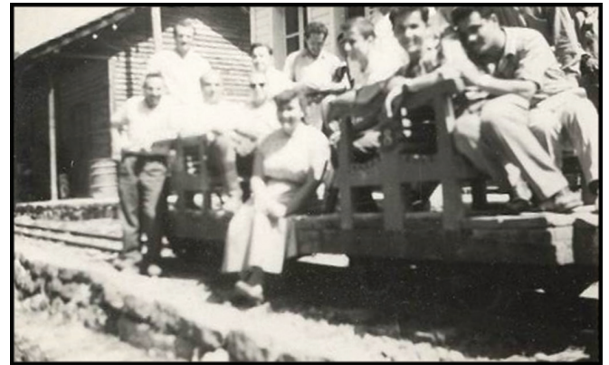
Fotoğraf 7-8. Demiryolu sistemi içinde görevlilerin (sağda itfaiyeciler) ve normal vatandaşların kullandığı vagonetler.

Photo 7-8. Wagons used by officers (firefighters on the right) and normal citizens in the railway system.