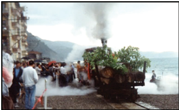
Fotoğraf 33. Günün belirli saatlerinde ilçe merkezinde belirlenen güzergâhta ilerleyen tren yerel halk tarafından hemen benimsenmiştir. İnsanlar evlerine giderken, pazara gidip-gelirken bu hattı kullanmıştır.

Demiryolu sistemi Ayancık ve yakın çevresi için bir ulaşım aracı olması yanında aynı zamanda önemli bir kültür öğesidir. Bu özlemi gidermek isteyen yerel yöneticiler 1990'lı yıllarda şehir içi ulaşımda kullanılmak üzere sahil boyunca ilerleyen 2,5 km uzunluğunda bir demiryolu inşa etmiş ve bu hat üzerinde yine aynı trenleri bir süreliğine de olsa kullanmıştır (Fotoğraf 33-34).