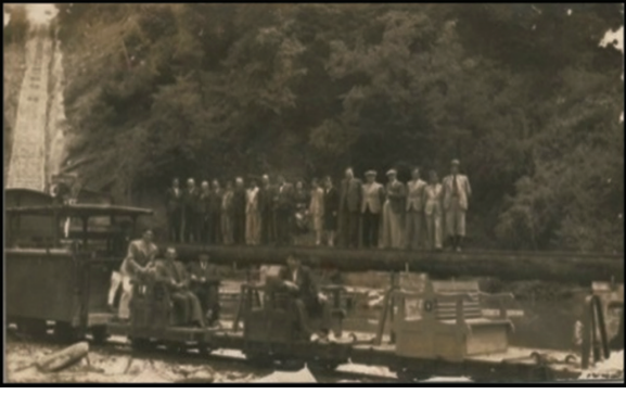
Fotoğraf 14. Ayancık ilçe merkezinde görevli kamu personelinin ormanı ziyaretleri ve ulaşım için kullandıkları vagonetler.

Photo 14. Wagons used for forest visits and transportation of public personnel in Ayancık district center