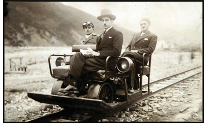
Fotoğraf 6. Yöneticilerin kullandığı drezin.

Şirketin demiryolu ulaşım sisteminde dekovillerin yanında daha çok çalışanların kullandığı drezin (Fotoğraf 6) ve vagonet (Fotoğraf 7-8) adı verilen küçük ulaşım araçları kullanılmıştır. Demir yollarında yol kontrol ve bakımı için kullanılan ve benzinle çalışan küçük araçlar olan (TDK, 2020) drezinler Ayancık'ta adeta bir taksi görevi üstlenmiştir. Gerek orman sahasının kontrolü gerek bakım ve onarım faaliyetleri için bu araçlar uzun yıllar kullanılmıştır. Bir diğer ulaşım aracı olan vagonetler ise açık ya da kapalı şekilde el freni yardımıyla bağımsız olarak hareket edebilen araçlardı. Bunlar eğimi takip ederek el freni kontrolünde ilçe merkezine kadar iniyor fakat geriye ormana dekovil vagonlarının akasına bağlanarak dönüyordu (Fotoğraf 9-10).