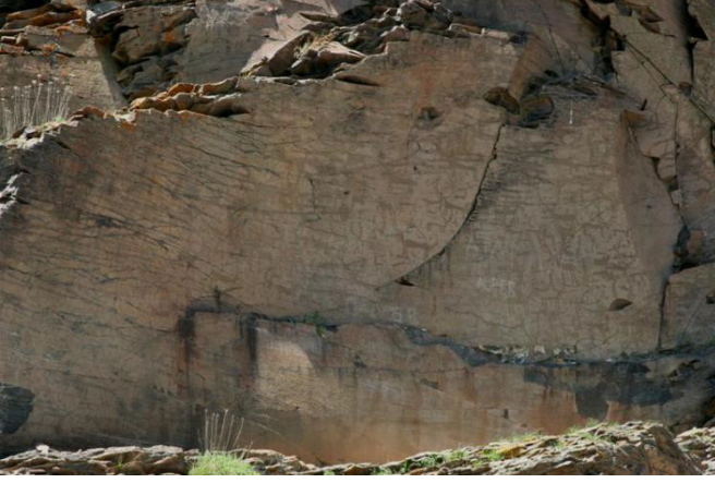
Camuřlu Köyü- Yazılıkaya Büyük Pano