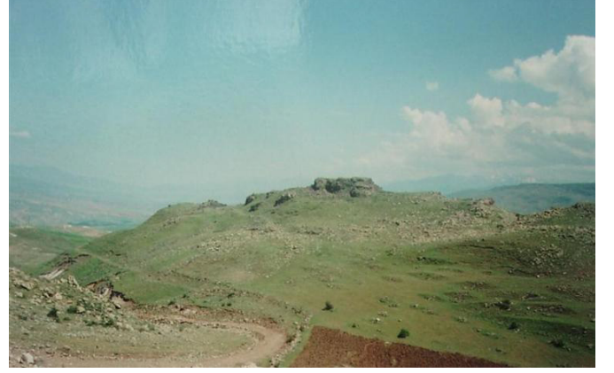
Camuřlu Köyü- Kurbaņa Mağarası