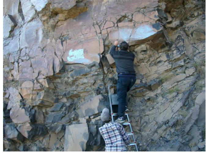
řaban Köyü- Geyikli Tepe