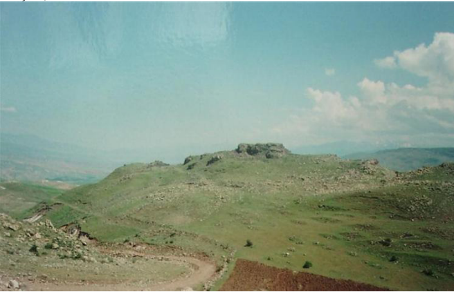
Camuřlu Köyü- Kurbaņa Mağarası