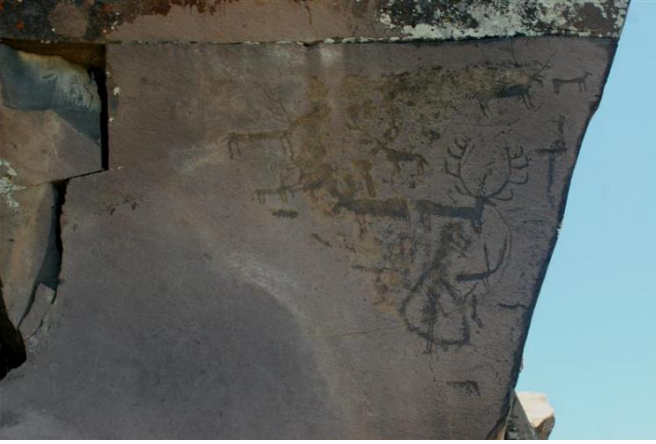
Camuřlu Köyü- Yazılıkaya Küçük Pano