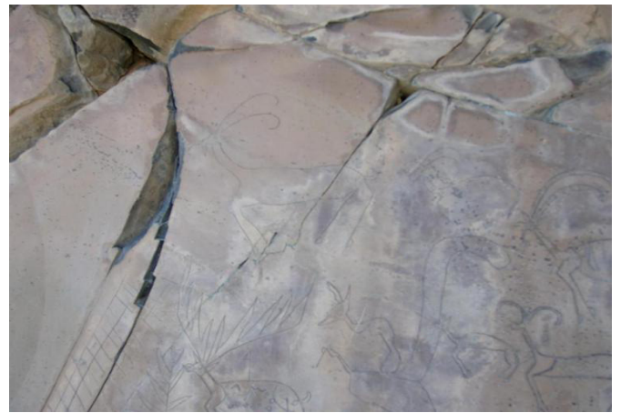
řaban Köyü- Geyikli Tepe