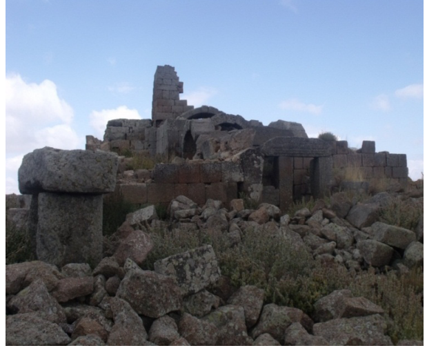
Resim 5: Mahalaç Kilisesi, genel görünüm.