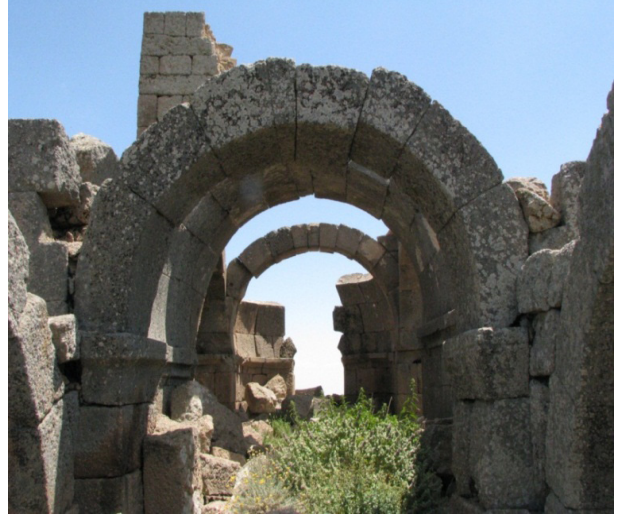
Resim 6: Mahalaç Kilisesi, içten görünüm.