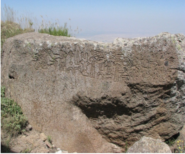
Resim 3a: Karadağ 1 yazıtı.