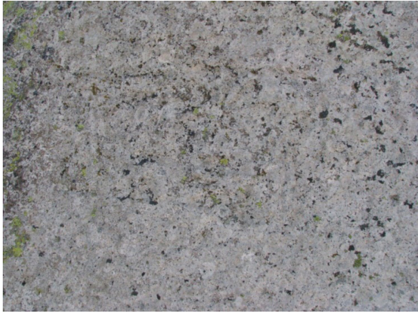
Resim 4a: Karadağ 2 yazıtı.