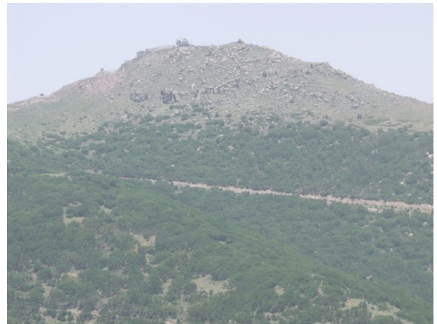
Resim 2: Mahalaç kalıntıları sahası.