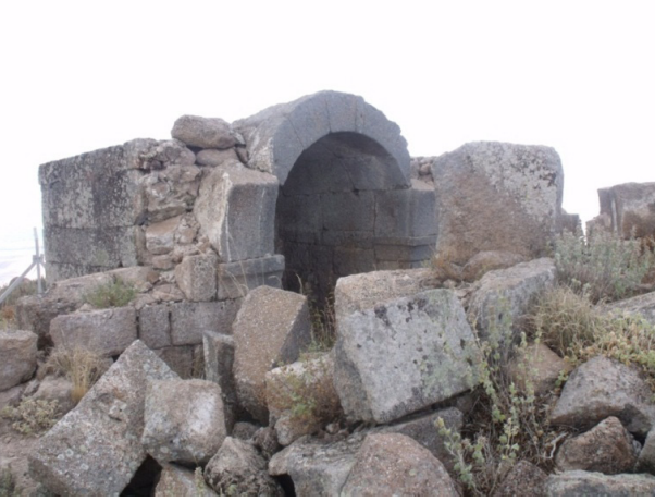
Resim 9: Mahalaç, mezar řapeli.