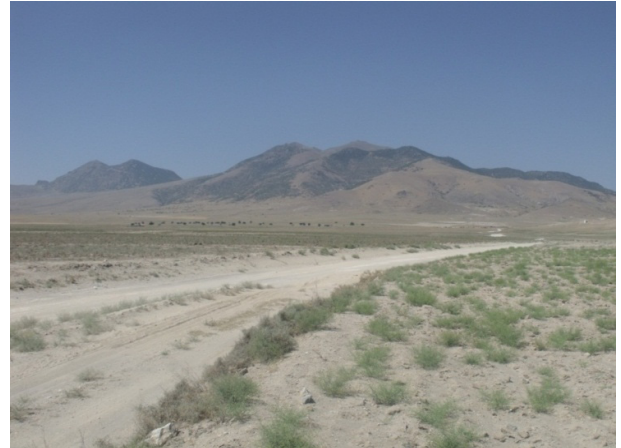
Resim 1: Karadağ ve Mahalaç Tepesi'nin genel görünümü.

Ünal, A. (2002), Hititler Devrinde Anadolu , İstanbul.