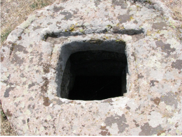
Resim 8: Mahalaç, sarnıç kapađı