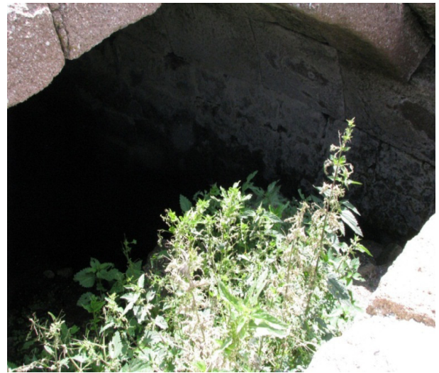
Resim 7: Mahalaç, sarnıç yapısı.