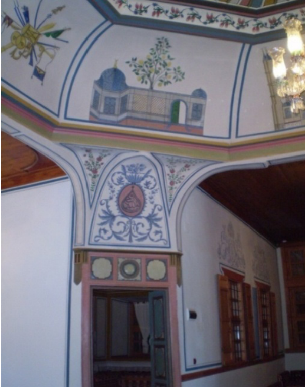
Şekil 12:Tartan Evi İç Mekan