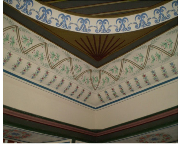
Şekil 5: Tartan Evi İç Mekan