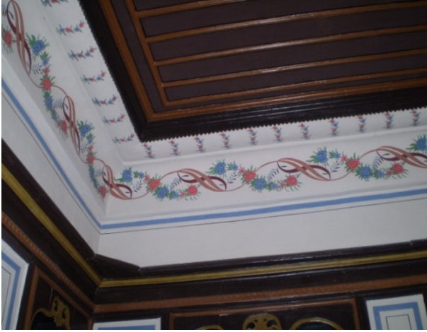
Şekil 8: Tartan Evi İç Mekan