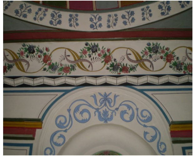
Şekil 6: Tartan Evi İç Mekan