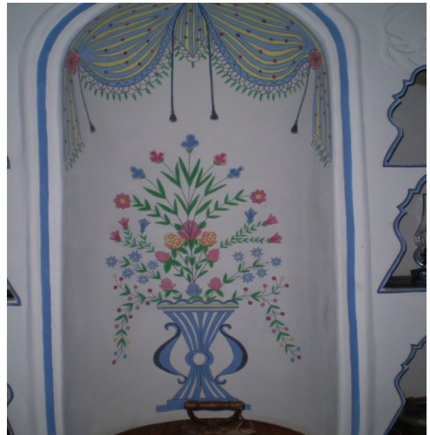
Şekil 7: Tartan Evi İç Mekan