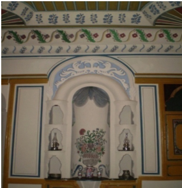
Şekil 4: Tartan Evi İç Mekan