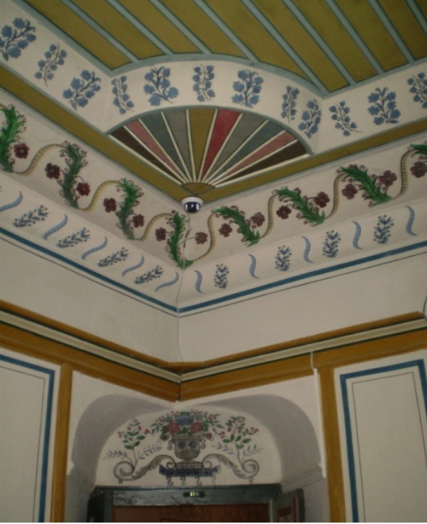
Şekil 9: Tartan Evi İç Mekan

(Şekil 6, 7, 8). Bazı çiçekliklerde perde (Şekil 8), bazısında ise saat tasvirleri vardır. Sofanın tavanları güneş ışıkları biçiminde düzenlenmiştir. Üst katta solda 1. ve 2. odalarda bir alçı aynalık yer alır. Bu aynalıkların üzeri bitkisel motiflerle işlenmiştir. Yapının tamamında boş kalan her yer mutlaka ahşap bir dekorasyonla ya da renkli boyalarla motiflendirilmiştir. Yapıdaki süslemeler, Karamanoğlu dönemine ait bir yapı olan Dikbasan (fasih) Camisi iç süslemeleriyle benzerlik gösterir.