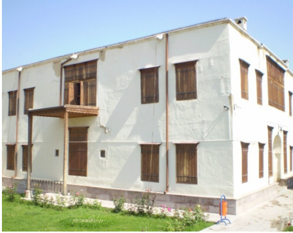
Şekil 3: Tartan Evi Cephe Görüntüsü

Yapı içindeki tüm kapı yüzleri kiriş ve tablalı denilen kare formulu ahşap malzeme ile yapılmıştır. Evde ahşap süslemeden daha ziyade kalemşi süslemeler (Şekil 4, 5, 6, 7, 8, 9) dikkati çekmektedir. Kapıların üzerindeki üçgen alanlarda bitkisel bezemeli kartuşlar, oda çiçekliklerinde, tavan eteklerinde zengin bitkisel süslemeler görülür