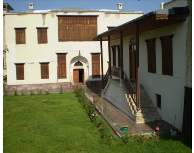
Şekil 2: Tartan Evi Ön Cephe Görüntüsü