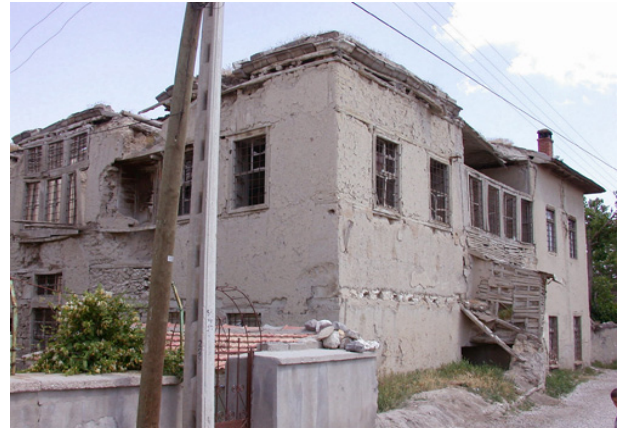
Şekil 1: Tartan Evi Restore Edilmemiş Hali

Tartan Konağı, Tartan Evi olarak ta bilinir. Topucak Mahallesi, Tartan sokakta yer alan ev iki katlı inşa edilmiştir. Yapı dar bir sokak içindedir. 19.yüzyıl ortalarında Sami Tartan'ın dedesi Hacı Ahmed Efendi tarafından yaptırılmıştır.