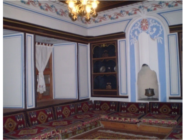
Şekil 11: Tartan Evi İç Mekan

Tartanzade Hacı Ahmet Efendi, Karaman'ın eşrafından ve tanınmış tüccarlarından. Mal almak ve satmak için gezer durur imparatorluk coğrafyasını.