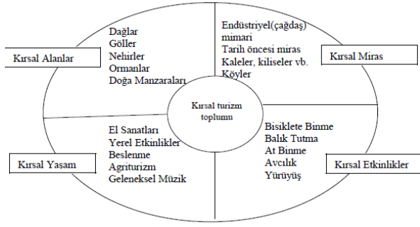
Şekil 2. Kırsal turizmin bileşenleri (Halloway and Taylor 2006)

agro-turizm ise çoğunlukla kırsal alanda ana faaliyet dalının tarım olması nedeni ile bir çeşit kırsal turizm faaliyeti olarak tanımlanmaktadır. Çiftlik turizmi ve agro-turizm genellikle kırsal turizmin küçük bir parçasını temsil etmektedir (Şekil 1)