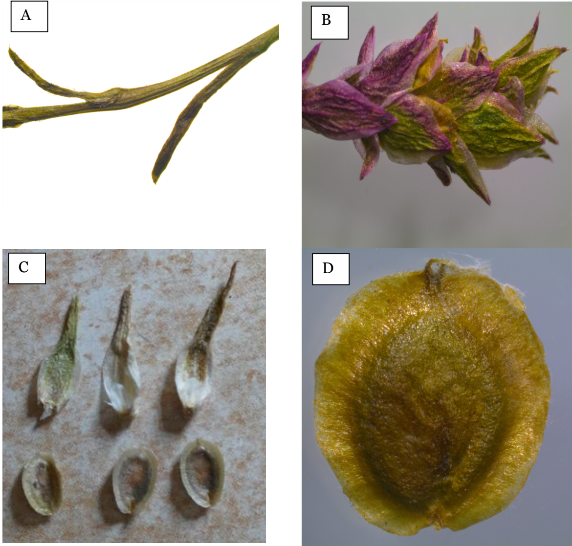
Şekil 2. Corispermum nitidum : A-yaprak; B-çiçek durumu; C-bırakte ve meyveler; D-tek meyve.

Corispermum anatolicum Sukhor., Wildenowia 40(2): 191 (2010). / pulotu , Tür. Bit. List. S. 25 (2012). (Şekil 3).