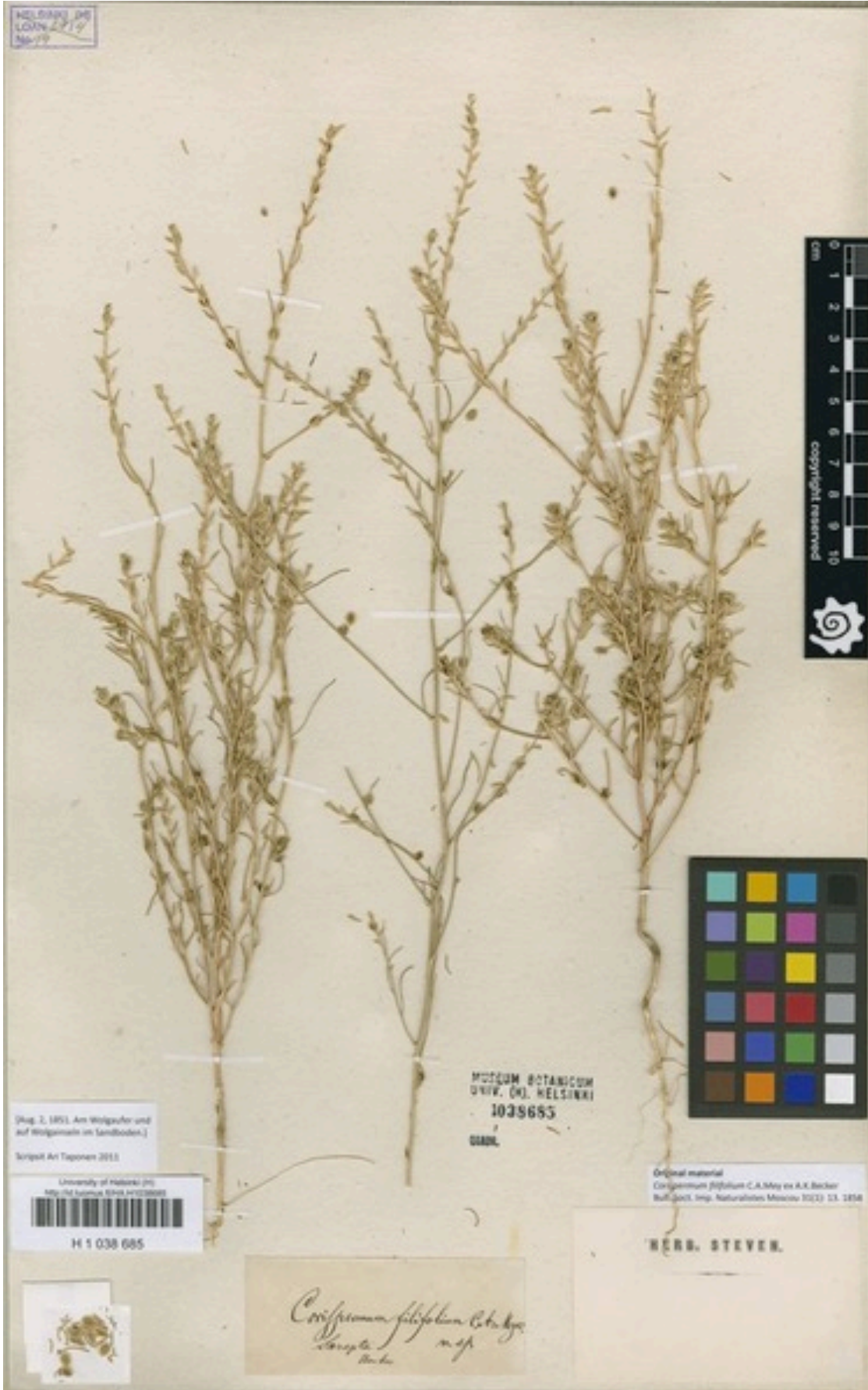
Şekil 3. Corispermum filifolium C.A. Mey. ex A.K. Becker türünün tip örneęi (MO, foto).