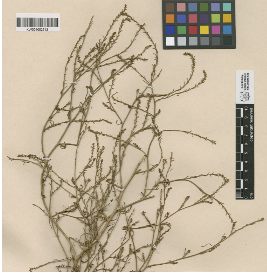
Şekil 1. Corispermum nitidum Kit. ex Schult. türünün tip örneği (W, foto).

Subsect. Aralocaspica Mosyakin in Thaiszia J. Bot. 7: 12 (1997).