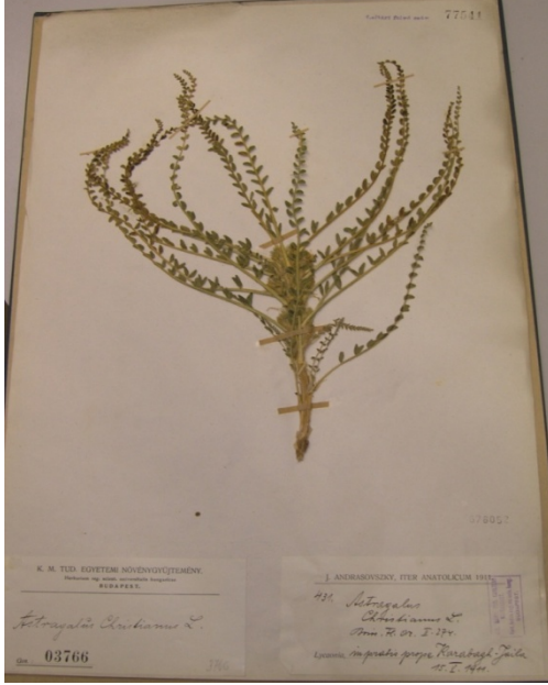
Astragalus christianus L. subsp. christianus . / dalh geven