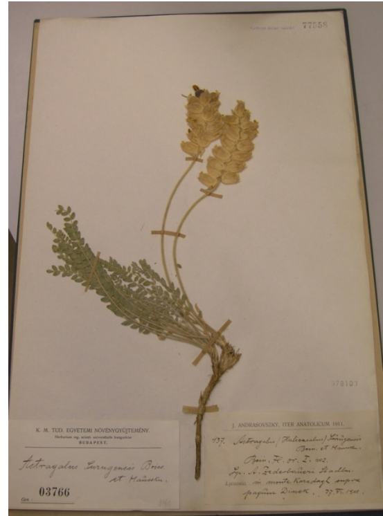
Astragalus zederbaueri Stadlmann / ermenek geveni