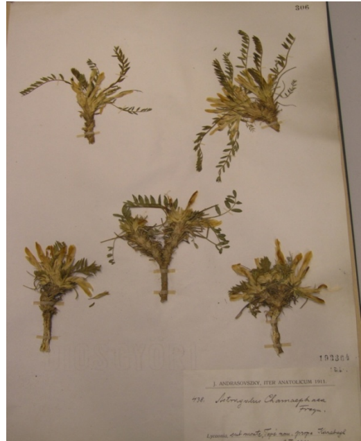
Astragalus chamaephaca Freyn. / özgeven