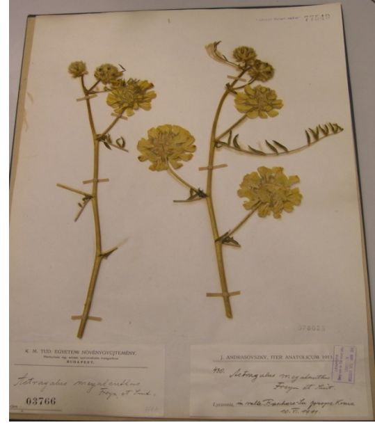
Astragalus macrocephalus Willd. subsp. finitimus (Bunge) D.F.Chamb. / topaç geveni