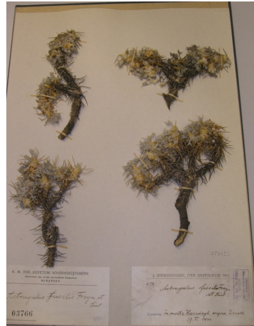
Astragalus microcephalus Willd. subsp. microcephalus / anadolu kitresi