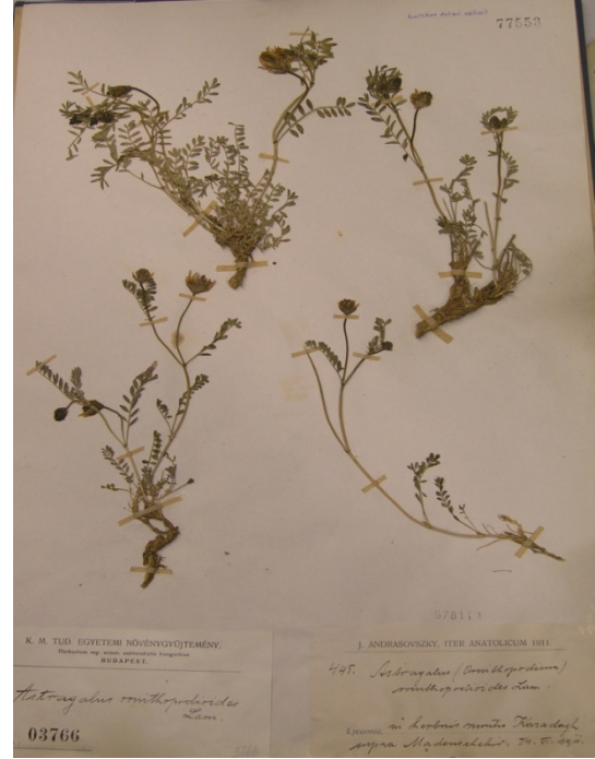
Astragalus ornithopodioides Lam. / pala geveni