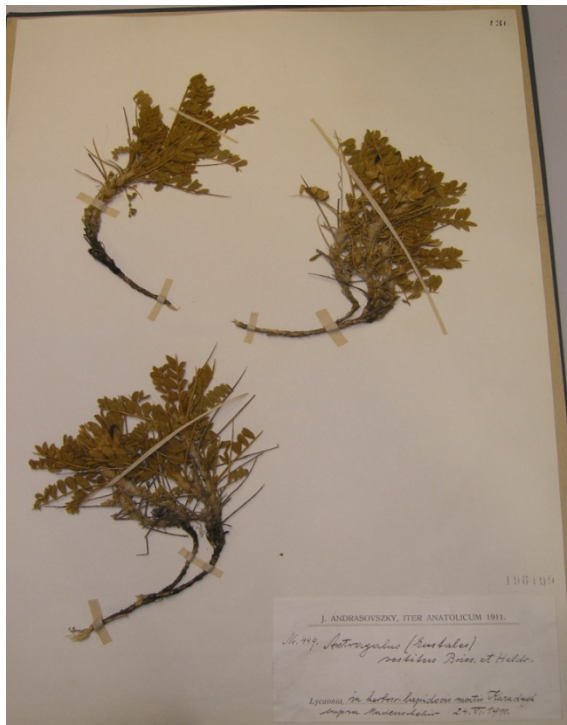
Astragalus vestitus Boiss. & Heldr./ kalbasan geveni