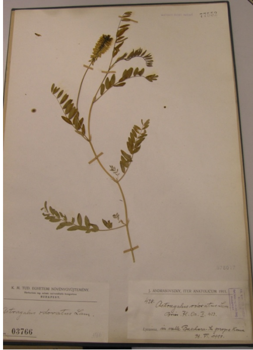
Astragalus odoratus Lam. / misk geveni