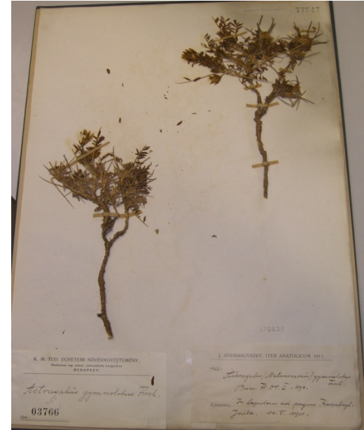
Astragalus gymnolobus Fisch./ cıblı giveni