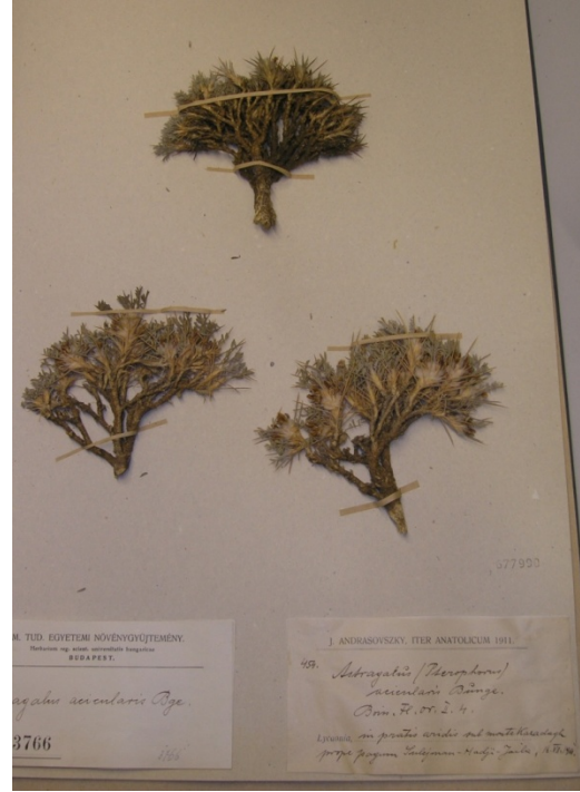
Astragalus acicularis Bunge / iğne geveni