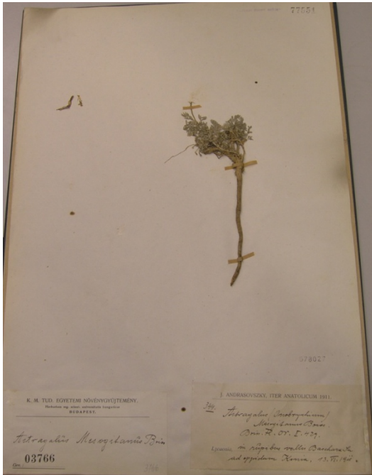
Astragalus mesoginatus Boiss. / aydın geveni