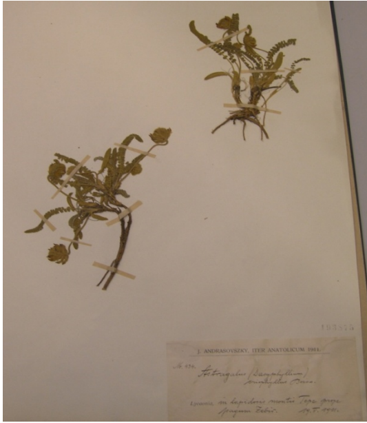
Astragalus densifolius Lam. subsp. densifolius . / gümüş geven