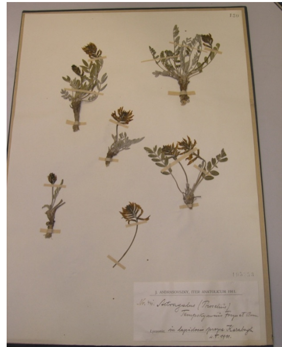
Astragalus spruneri Boiss. / pembe geveni