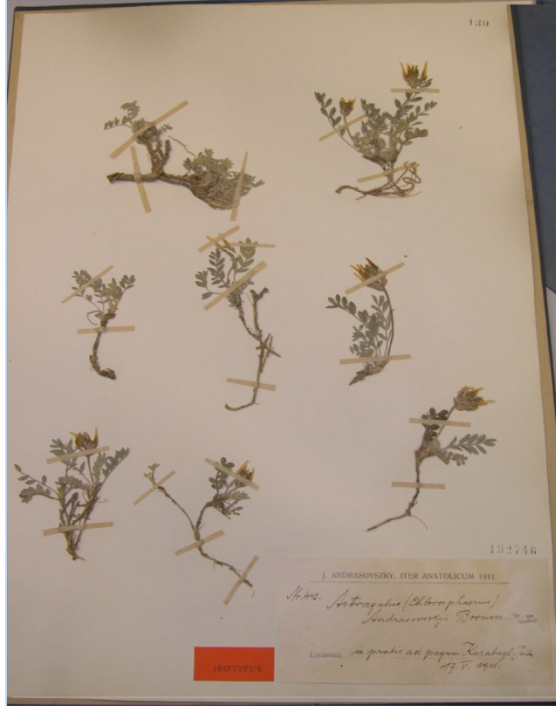
Astragalus andrasovszkyi Bornm. / vural geveni