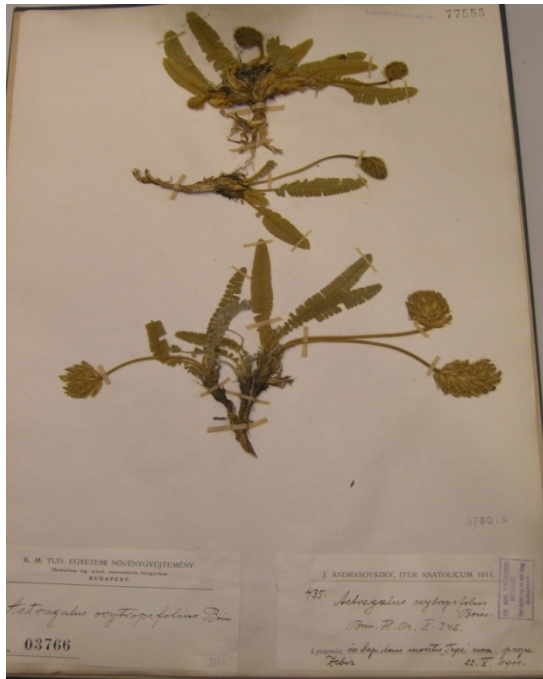
Astragalus oxytropifolius Boiss. / mart geveni