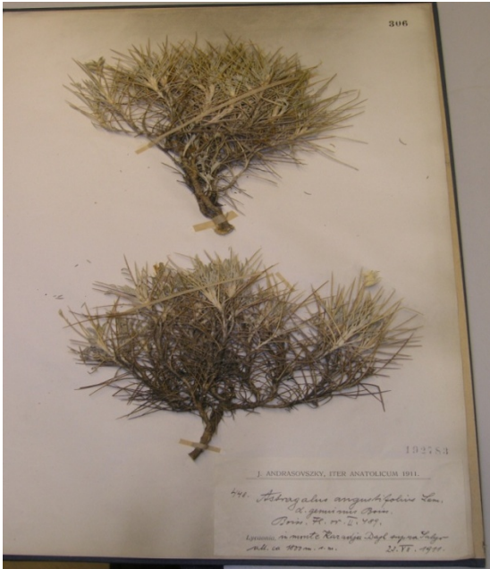
Astragalus angustifolius Lam. subsp. angustifolius / ince geven