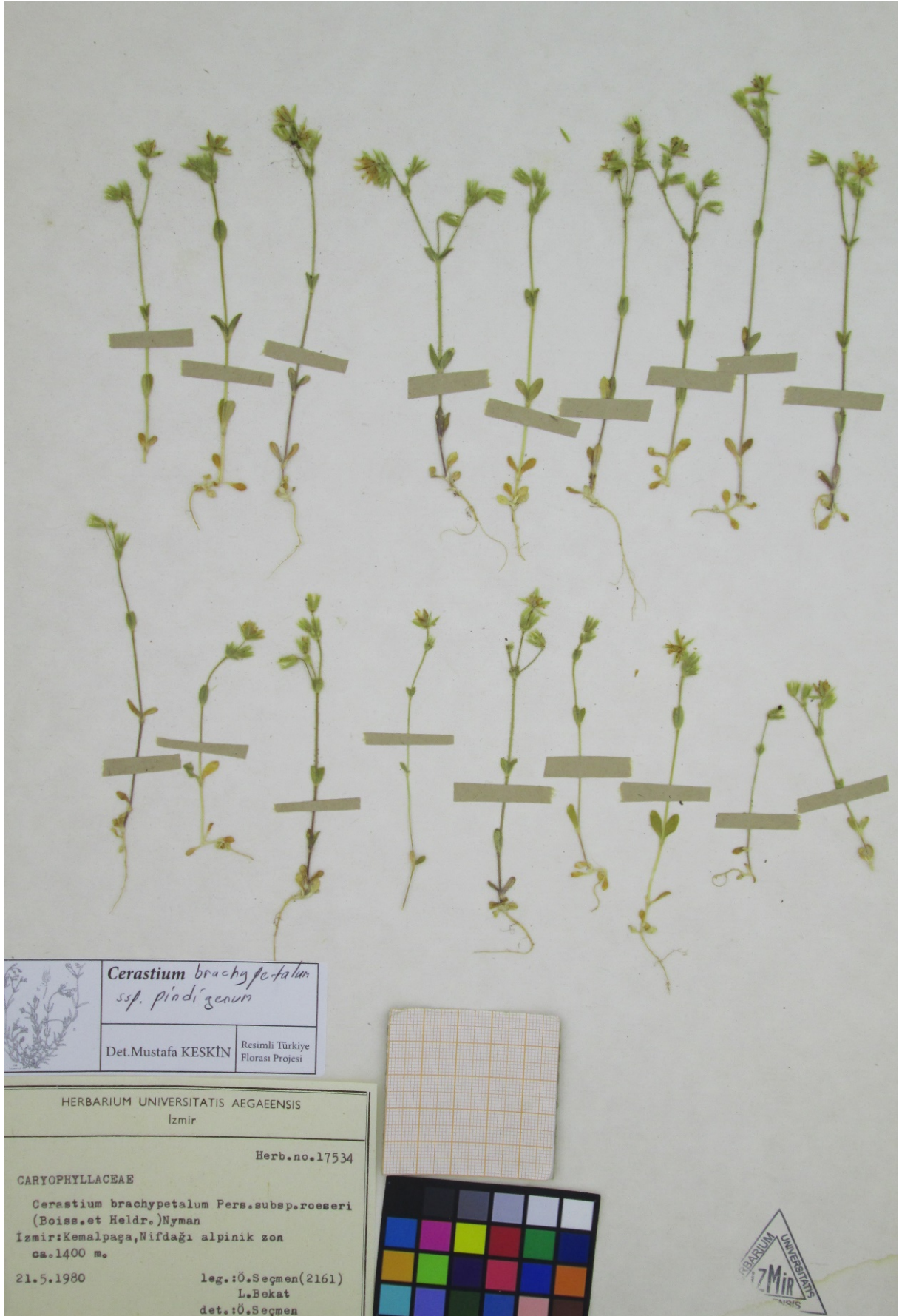
Şekil 3: Cerastium brachypetalum subsp. pindigenum (EGE 17534).