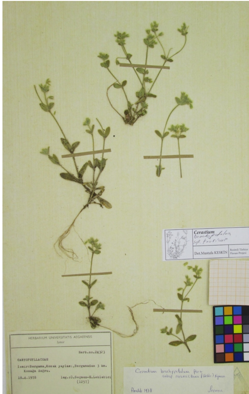
Şekil 2: Cerastium brachypetalum subsp. tauricum (EGE 24323).

Cerastium brachypetalum Pers. subsp. pindigenum (Lonsing) P.D.Sell & Whitehead, Feddes Repert. 69: 18 (1964). / yaban boynuzotu *, Türkiye için yeni kayıt , Şekil 3 ve 4.