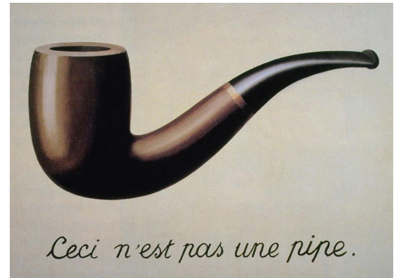
Resim 1: René Magritte, İmgelerin İhaneti, 1929 ( https://bit.ly/2U3mtks ).

Dada ve Gerçeküstücülük, sosyal ve politik köktenciliğin sanatsal yenilikle sınırlanması gerektiğini söyleyen avangart inancı paylaşıyordu. Sanatçının görevi estetik hazın ötesine geçmekti, insanların yaşamlarını etkilemek ve onların nesnelere farklı şekillerde görmelerini ve deneyimlemelerini sağlamaktı (Hopkins, 2004: 19). Sürrealizm aynı zamanda Sigmund Freud'un psikanaliz fikirlerinden de etkilenmiştir. Sigmund Freud'un bilim tarihine yaptığı büyük katkılar, Sürrealizm akımına da yol göstermiştir.