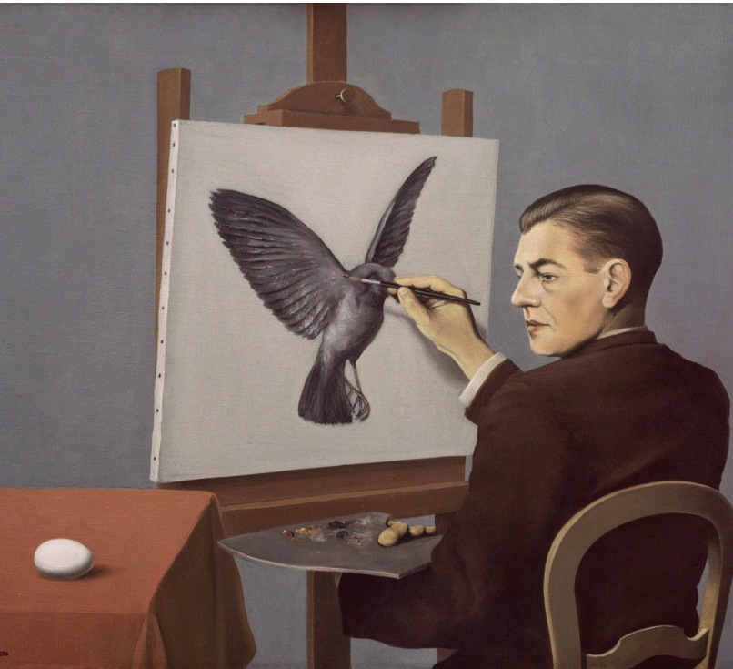
Resim 3: René Magritte, Kavrayış, 1936 ( https://bit.ly/2jStglo ).

Sanat eğitimine erken başlayan Magritte, 1910'da ders vermeye başladı. İlk resimlerini ergen olarak yaptı ve Brüksel'deki Académie Royale des Beaux-Arts'a 1916'da başladı. 1922'de Antwerp Modern Sanat Kongresi sergisinde altı resim sergiledi. Giorgio de Chirico'nun çalışmalarını inceledi ve ressamın ıssız, gölgeli, sembol yüklü sahneleri Magritte'i kendi psikolojik manzaralarını yaratmaya yönlendirdi (Cohen, 2018).