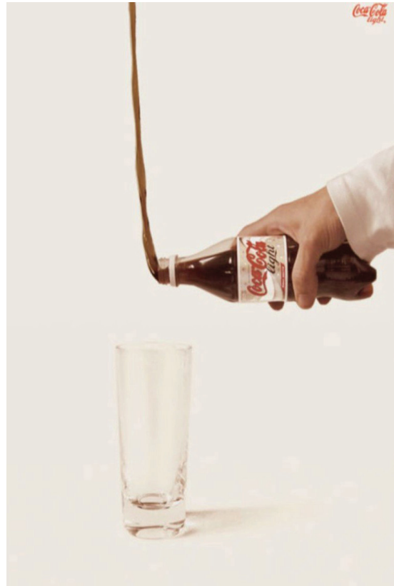
Resim 4: Journal Entry, Coca Cola Light, 2015 ( https://goe.gl/MVe1Z ).

Magritte'in 1933 yılında yapmış olduğu 'The Human Condition' (İnsanın Yazgısı-1) eserine bakıldığında ise eserde illüzyonist bir bakış açısı görülmektedir. Pencere önünde duran şövalenin üzerindeki tuvalde; manzara camdan görünen mi, yoksa camın önünde şövale üzerindeki resim mi, ya da her ikisi de aynı görüntü mü? diye düşündürmektedir. Magritte'in çalışmalarındaki önemli unsurlardan biri olan bu tavır, gerçeklik ve algı arasındaki ince çizgiyi göstermektedir. Pencere ile resme bakıldığında görülmesi gereken tuvalin, mekânın ya da manzaranın devamı olmasıdır. Sanatçı izleyicinin ne görmesini istiyorsa ona izin veriyor. İşte burada bakmak ve görmek ya da kişilerin birbirlerinden farklı görebilmesini ve farklı düşünebilmesini sağlayan algı devreye giriyor.