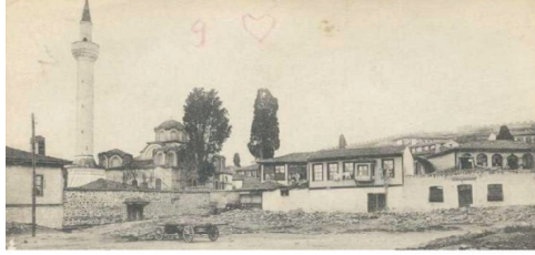
Selanik Yakup Paşa Camisi