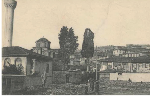
Selanik Yakup Paşa Camisi