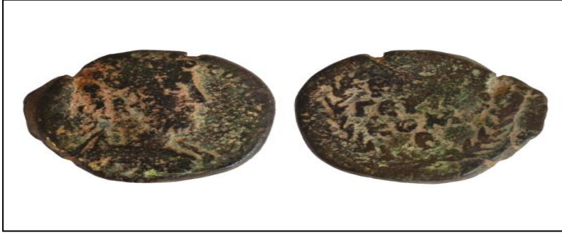
Fotoğraf 9. Roma İmparatoru Commodus Döneminde (MS 177-192) Germanikeia'da Basılmış Sikke

MÖ 334 yılında Çanakkale Boğazı'ndan Anadolu'ya giren İskender'in yaptığı Doğu seferi sırasında Külek Boğazı'nı aştıktan sonra, MÖ 333 yılında İssos savaşından önce Maraş'ı fethettiği düşünülmektedir. MÖ 323 yılında İskender'in ölümüyle birlikte Maraş şehri İskender'in komutanlarından Seleukos Nikator'a verilmiştir (Tekin, 2011: 158).