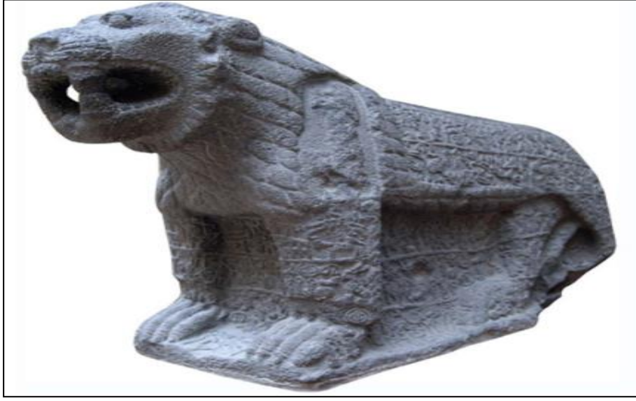
Resim 8. Üzerinde hiyeroglif yazı ile Maraş Krallarının soy ağacını gösteren Maraş Aslanı.

İçeriği bakımından önemli olan sınır taşı Asur Kralı III. Adad-nirari (MÖ 810-783) dönemine aittir ve Kahramanmaraş Müzesi'nde sergilenmektedir (Donbaz, 1990: 4-24; Konyar, 2010:125). Bölgenin Demir Çağı'nı aydınlatacak en güzel buluntular ise kaçak kazılar sonucunda ortaya çıkmış heykeller, kabartmalar ve mezar stelleridir. Bunlardan en önemlisi Gurgum krallarının soy ağacını veren, Maraş kalesinde bulunmuş, günümüzde İstanbul Arkeoloji Müzesi-Eski Şark Eserleri Müzesi'nde sergilenen ve MÖ 9.yüzyıla tarihlenen yazıtlı Maraş-Kapı Aslanı'dır (Hawkins, 2000:261).