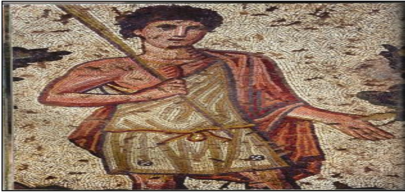
Fotoğraf 10. Germanikeia Antik Kenti Roma Villası Taban Mozağından Bir Parça