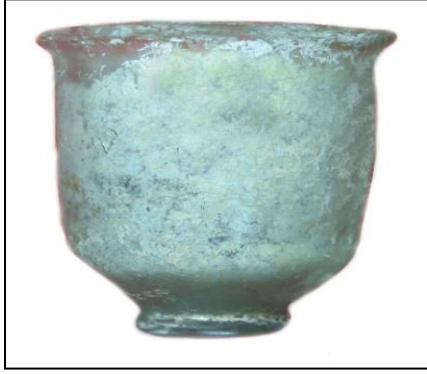
Fotoğraf 11. Roma İmparatorluk Dönemi, Cam Bardak (Kahramanmaraş Müzesi)

2007 yılında kaçak kazılarla bir parçası bulunan ve 2009 yılında Kahramanmaraş Müzesi'nin yaptığı Germanikeia Antik Kenti Yamaç Villaları kazısında ortaya çıkarılan ve MS 4-5. yüzyıllara tarihlenen mozaikler de dönemin sosyal ve ekolojik yapısı ile mimarisi hakkında bilgi vermektedir. Kahramanmaraş Müzesi'nde sergilenen birçok eser de Maraş'ın Roma Dönemi konusunda bilgi vermektedir.