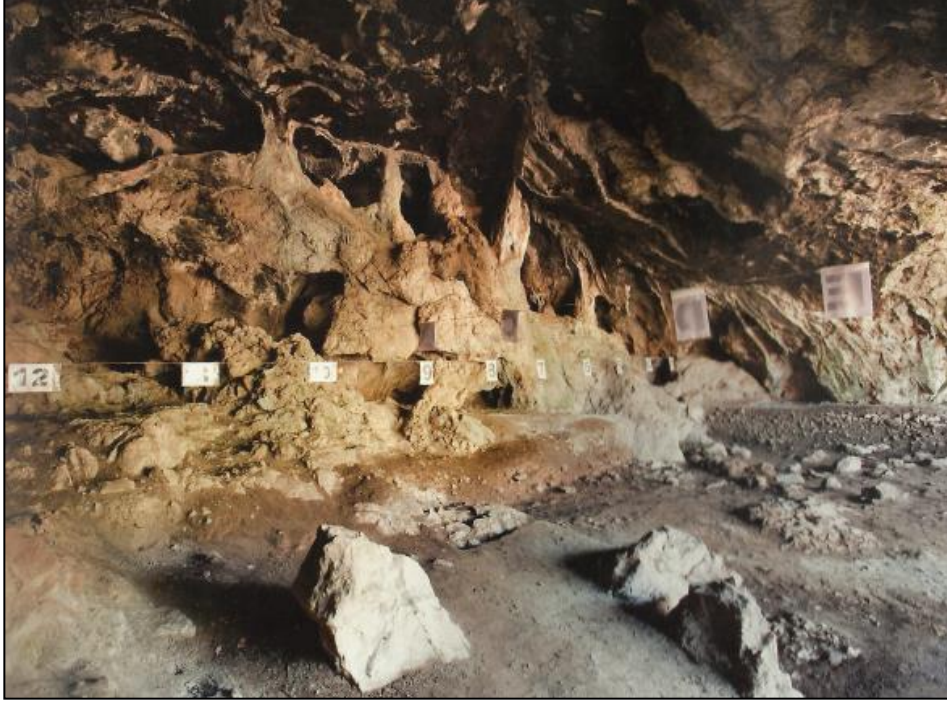
Fotoğraf 1. Maraş Göksun yolu üzerinde bulunan Döngel Köyü' ndeki Direkli Mağarası

Prehistorik dönemi yansıtan önemli buluntular Maraş-Göksun yolu üzerinde bulunan Döngel Köyü'ndeki mağaralardan Direkli Mağarası'nda ortaya çıkarılmıştır (Kılıç Kökten, 1960: 45).