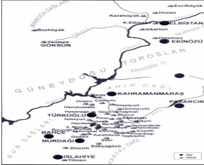
Şekil 2. Kahramanmaraş Höyükleri (Konyar, “Kahramanmaraş Yüzey Araştırması 2007” 26.Kazı Sonuçları 2.Cilt, Harita:1)

Binlerce yıllık tarihi geçmişi olan Maraş, prehistorya ve yakın tarih için önemli bölgelerimiz arasındadır. Tarih öncesi devirlere ait kültür izlerinin yer aldığı pek çok mağara ve höyüğe rastlanmıştır.