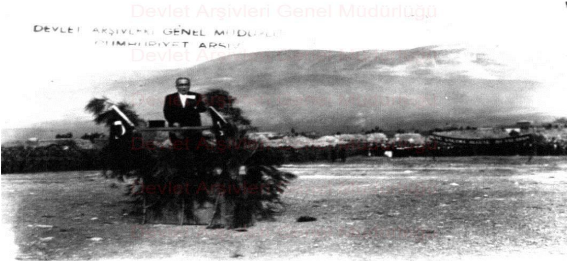
Fon No: 490 1 0 0 - Kutu No: 1146 - Dosya No: 23 - Sıra No: 1