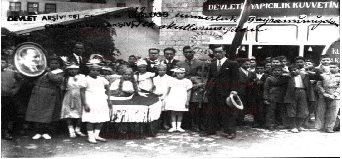
Fon No: 490 1 0 0 - Kutu No: 1146 - Dosya No: 23 - Sıra No: 1