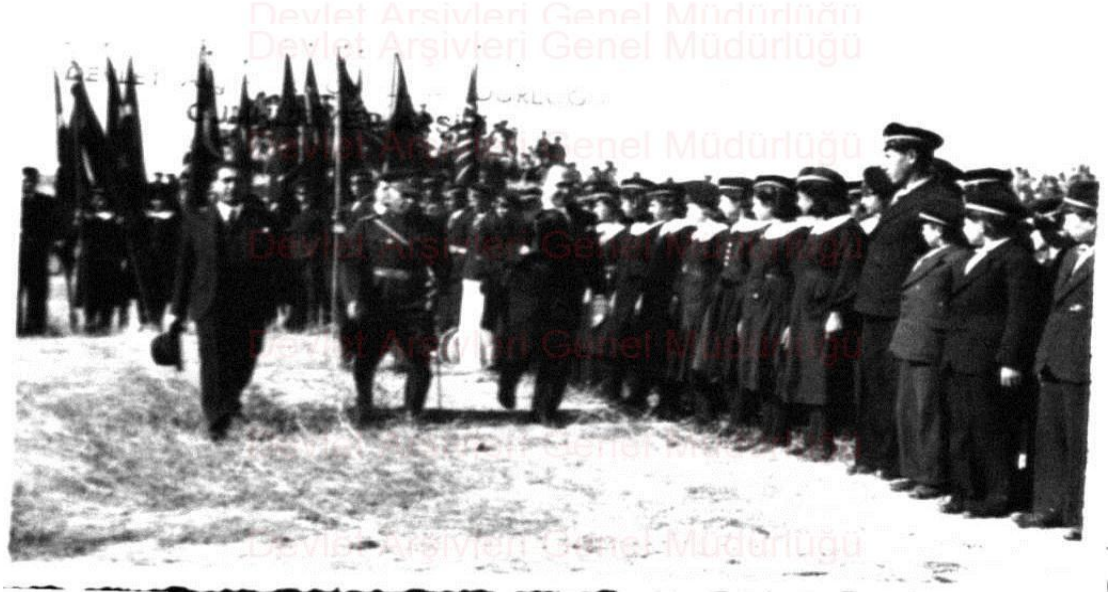
Fon No: 490 1 0 0 - Kutu No: 1146 - Dosya No: 23 - Sıra No: 1