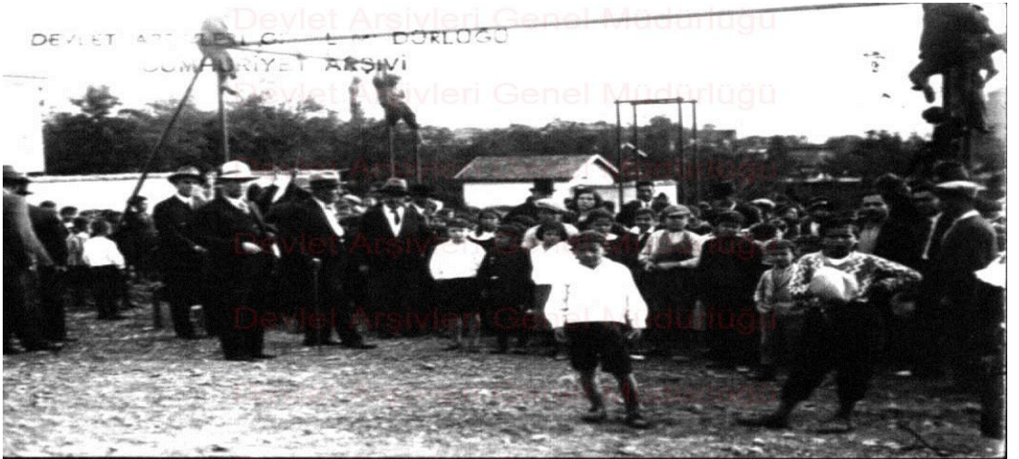
Fon No: 490 1 0 0 - Kutu No: 1146 - Dosya No: 23 - Sıra No: 1