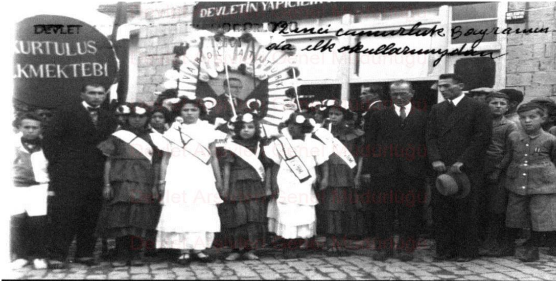
Fon No: 490 1 0 0 - Kutu No: 1146 - Dosya No: 23 - Sıra No: 1