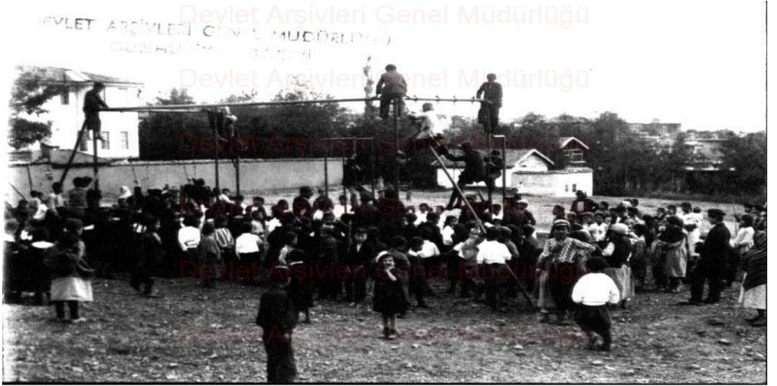
Fon No: 490 1 0 0 - Kutu No: 1146 - Dosya No: 23 - Sıra No: 1