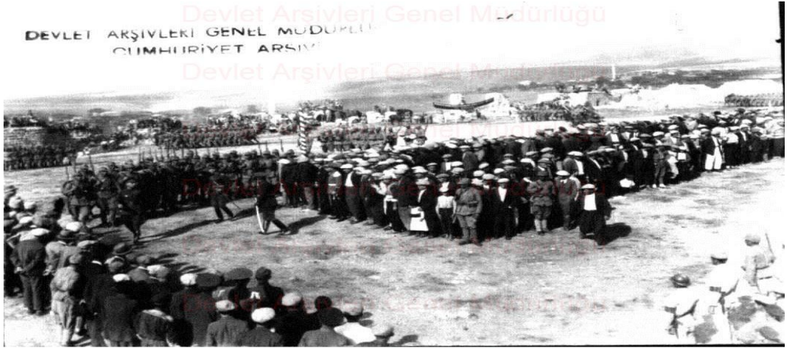
Fon No: 490 1 0 0 - Kutu No: 1146 - Dosya No: 23 - Sıra No: 1