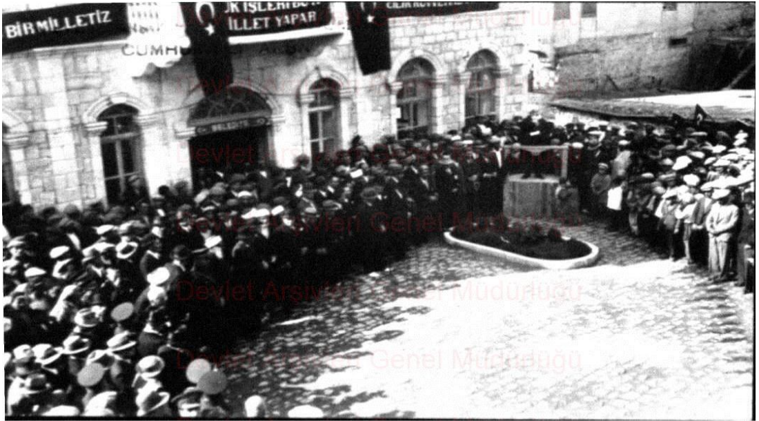
Fon No: 490 1 0 0 - Kutu No: 1146 - Dosya No: 23 - Sıra No: 1