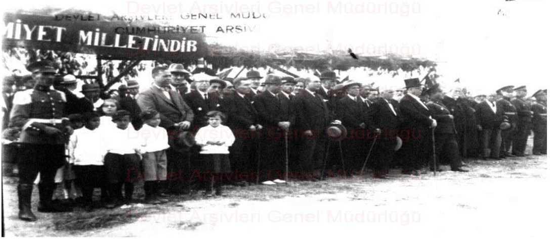
Fon No: 490 1 0 0 - Kutu No: 1146 - Dosya No: 23 - Sıra No: 1