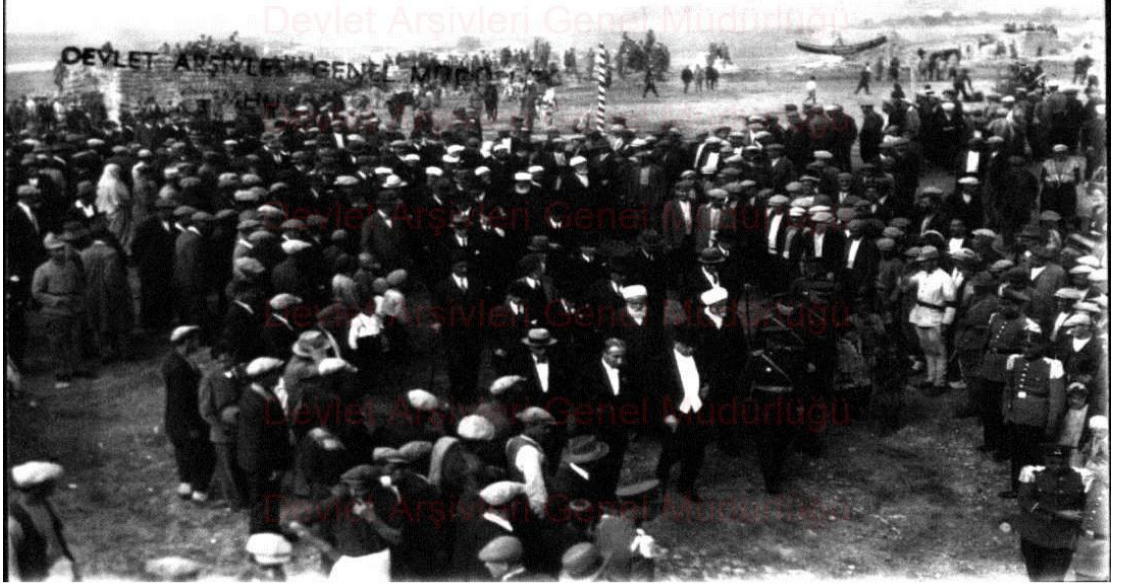
Fon No: 490 1 0 0 - Kutu No: 1146 - Dosya No: 23 - Sıra No: 1