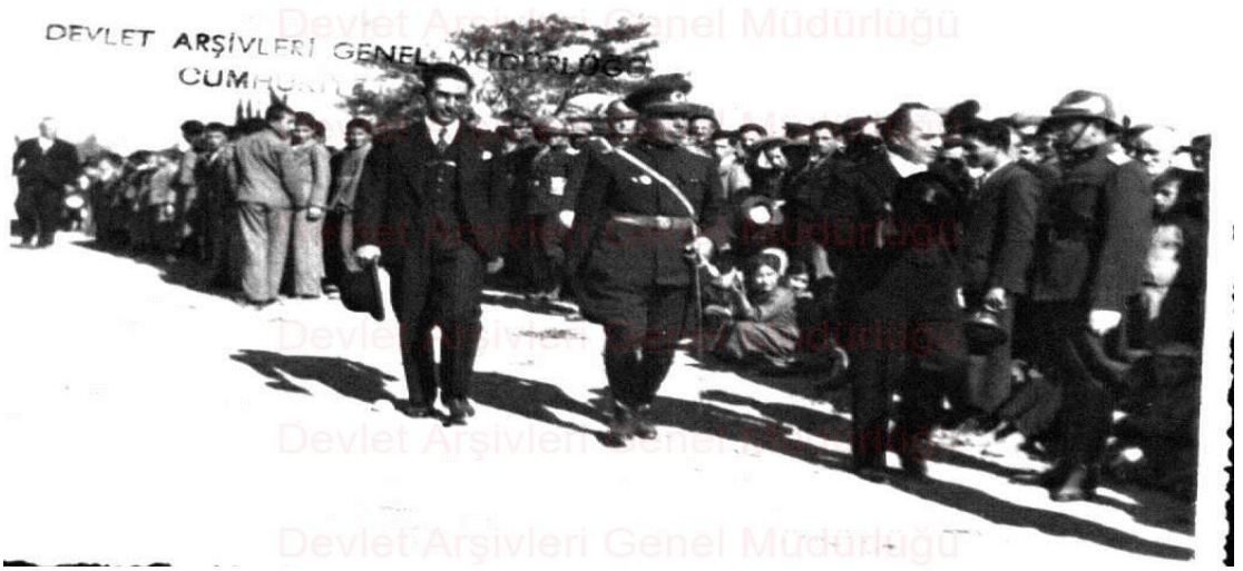
Fon No: 490 1 0 0 - Kutu No: 1146 - Dosya No: 23 - Sıra No: 1