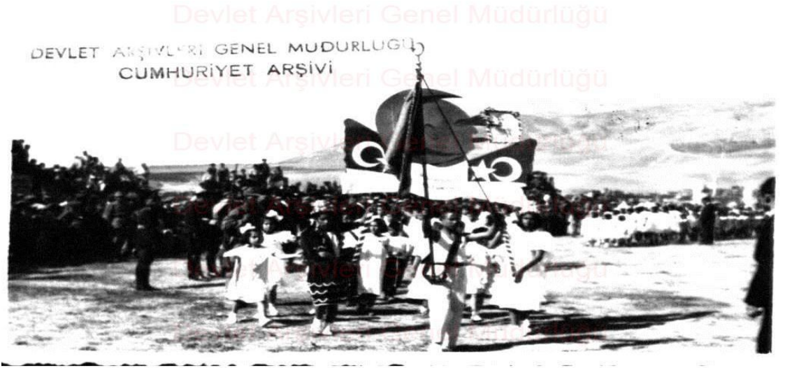
Fon No: 490 1 0 0 - Kutu No: 1146 - Dosya No: 23 - Sıra No: 1