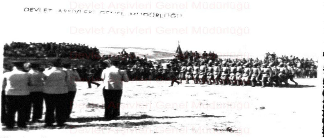
Fon No: 490 1 0 0 - Kutu No: 1146 - Dosya No: 23 - Sıra No: 1