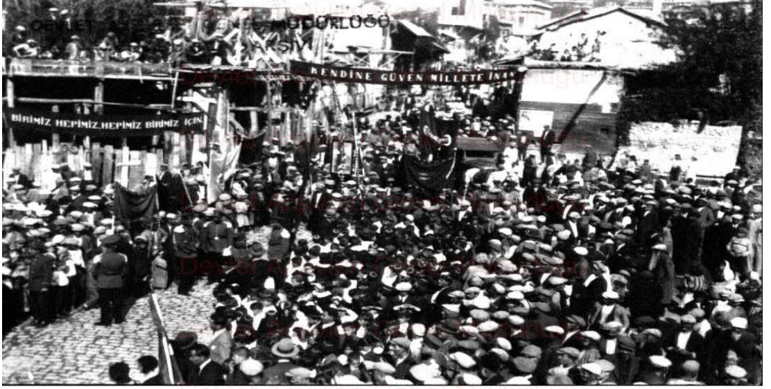
Fon No: 490 1 0 0 - Kutu No: 1146 - Dosya No: 23 - Sıra No: 1