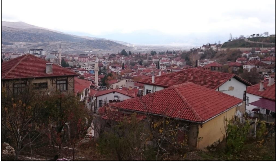
Fotoğraf-1: Elmalı İlçesinin genel görünümü

getirilen Teke Sancağı, Konya'dan ayrılarak Antalya merkez olmak üzere doğrudan İstanbul'a bağlanmıştır. Bu düzenleme ile Elmalı müstakil Teke Sancağının kazası olarak kalmıştır (Güçlü, 1998: 290; Koday-Aydın, 2019: 75). 1924 yılında yapılan düzenleme ile ise Elmalı, Antalya vilayetinin 8 kazasından birisidir (Koday-Aydın, 2019: 75). Elmalı 1940 yılında yaşadığı büyük bir yangından sonra tekrar imar edilmiştir (Köşklü, 2003: 92).