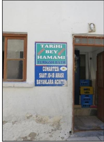
Fotoğraf-2/3: Bey Hamamı'nın dış görünüşü ve giriş kapısı