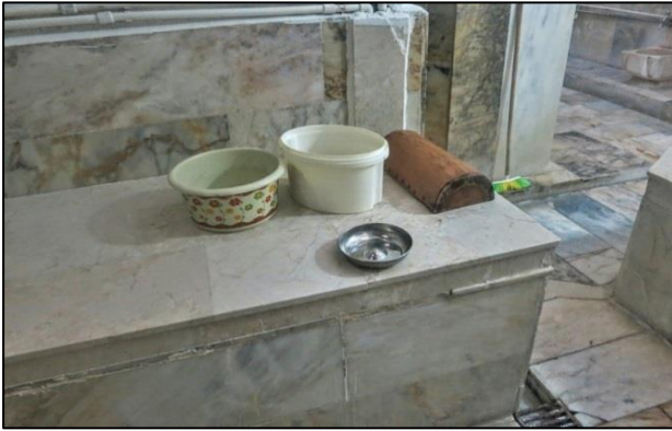
Fotođraf-10: Bey Hamamı-Hamamda kullanılan çeřitli gereler

“Zeytinyađlı sabun kullanıyoruz, kullanmış olduđumuz sabun zeytinyađı sabunu. Aydın’dan, Dalan fabrikasından gelir. Ya da Duru sabunu vardır, o güzeldir kepek yapmaz. Keseyi Tokat’tan getiririz, elde dokuma keselerle, hakiki Tokat kesesi. Havlu genel olarak Denizli’den, Buldan’dan. Peřtamal ve havlu. Peřtamal var, ıkma var, üst havlusu var, baş havlusu var. Hamama girişte kullanılan peřtamal derler, ıkış için kullanılan ıkma deriz, altta kullanılan. Üst havlu vardır, hamamın içinden ıkarken kullanılan bi havlu vardır. Dışarı ıkınca kullanılan bi havlu vardır. Baş havlusu kullanırız ayrıca.” (KK-1).