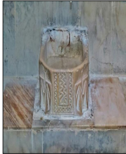
Fotoğraf-8/9: Bey Hamamı-Sıcaklık bölümünde mermer kurnalar