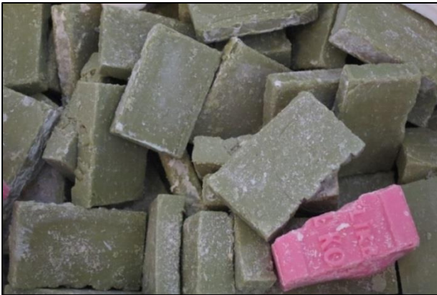
Fotođraf-11: Bey Hamamı-Hamamda kullanılan zeytinyađlı sabunlar