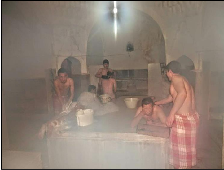
Fotoğraf-13: Bey Hamamı-Hamamda yıkananlar

“Güreşlerden sonra başpehlivanı getiriyolar güreş sahasından yürüyerek, kemeri takıyo boğazına, alkışlar eşliğinde güreş sahasından hamama kadar takip ediliyor, burada kesesini masajını güzel oluyor, dinleniyor, temizleniyor pehlivan.” (KK-1).