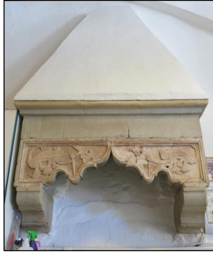
Fotoğraf-6/7: Bey Hamamı-Soğukluk bölümü