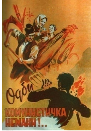
Görsel 5. "Canavar" konulu propaganda posterleri

"Canavar" konulu propaganda posterleri, görüntüsel gösterge açısından incelendiğinde posterde mısır tarlası içerisinde bulunan yetişkin bir adam, bir kadın ve bir çocuk görseline yer verildiği görülmektedir. Posterde yetişkin adamın, elinde meşale bulunan kişiye elindeki yaba ile saldırdığı aktarılmaktadır. Posterin altında "Geri çekilin, komünist canavar!" yazılı kodu bulunmaktadır.