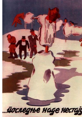
Görsel 8. "Umut" konulu propaganda posterleri

"Umut" konulu propaganda posterleri, görüntüsel gösterge açısından incelendiğinde posterde eriyen bir kardan adamın olduğu görülmektedir. Kardan adamın arkasında sırasıyla Sovyetler Birliği lideri Joseph Stalin, İngiltere başbakanı Winston Churchill ve ABD başkanı Franklin Delano Roosevelt yer almaktadır. Kardan adamın başında Kızıl Ordu'ya ait şapkanın olduğu görülmektedir. Posterde "Son umutlar eriyor" yazılı kodu bulunmaktadır.