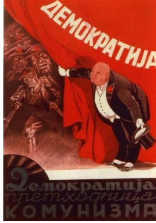
Görsel 6. "Demokrasi" konulu propaganda posterleri

"Demokrasi" konulu propaganda posterleri, görüntüsel gösterge açısından incelendiğinde posterde üzerinde demokrasi yazan kırmızı bir perdenin olduğu görülmektedir. Kırmızı perdenin önünde smokin içerisinde elinde silindir şapkası bulunan bir adamın perdeyi açtığı aktarılmaktadır. Perdenin arkasında ise elinde tüfek ve bıçak bulunan adamların olduğu görülmektedir. Adamların şapkalarında kırmızı yıldızların olduğu görülmektedir. Posterde " Demokrasi, Komünizm'in habercisidir " yazılı kodu bulunmaktadır.