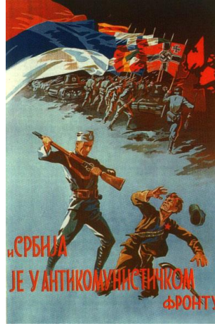
Görsel 3. "Cephe" konulu propaganda posterini

"Cephe" konulu propaganda posterini, görüntüsel gösterge açısından incelendiğinde posterde bir Mihver ordusuna ait askerinin tüfeğinin dipçığıyle bir adama saldırdığı görülmektedir. Adam askerin önünde diz çökmüş, kendisini korumaya çalışmaktadır. Adamın sol göğüs hizasında kırmızı bir yıldız bulunmaktadır. Diğer yandan üzerinde çeşitli ülkelere ait bayrakların yer aldığı askerler ve tankların bir yöne doğru ilerledikleri aktarılmaktadır. Sırbistan bayrağı diğer bayraklara göre daha büyük ve ön planda tutulmaktadır. Posterin altında " Sırbistan, anti-komünist cephenin bir üyesidir " yazılı kodu bulunmaktadır.