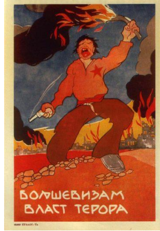
Görsel 1. "Terör" konulu propaganda posterleri

"Terör" konulu propaganda posterleri, görüntüsel gösterge açısından incelendiğinde posterde bir elinde meşale diğer elinde tabanca olan bir adam görseline yer verildiği görülmektedir. Adamın arkasında yanmakta olan ev görselleri bulunmaktadır. Adamın yüzü ise çirkin olarak aktarılmaktadır. Fonda ise yanan evlerden çıkan dumanlar görülmektedir. Adamın sol göğüs hizasında kırmızı bir yıldıza yer verilmektedir. Posterin altında " Bolşevizm, terör yönetimi " yazılı kodu bulunmaktadır.