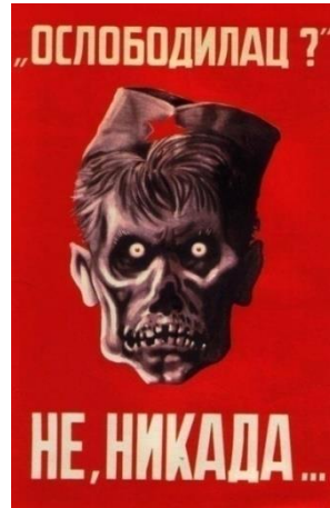
Görsel 4. "Kurtarıcı" konulu propaganda posterleri

"Kurtarıcı" konulu propaganda posterleri, görüntüsel gösterge açısından incelendiğinde posterde üzerinde kırmızı bir yıldız bulunan şapka giyen bir başa yer verilmektedir. Posterde yer alan baş, bir insan başı olarak sunulmakla birlikte aynı zamanda bir maymun başı ve bir kurukafaya da benzetilmeye çalışılmaktadır. Bu nedenle posterde yer alan baş korkutucu bir görünüm kazanmaktadır. Fonda kırmızı renge yer verilmiş ve posterde " Kurtarıcı? Hayır asla " yazılı kodu bulunmaktadır.