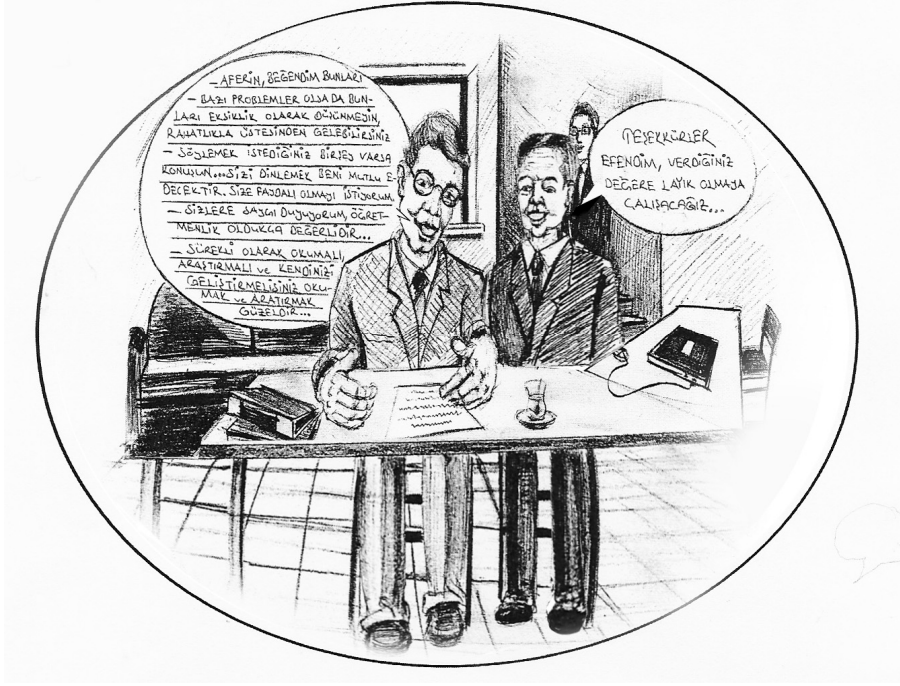
Karikatür 3. Öğretmen ve okul müdürlerinin ideal denetmen imajlarının karikatürize edilmiş hali

İlköğretim ve ortaöğretimde görev yapan öğretmene ve okul müdürlerine göre ideal denetmen imajı, “mesleki açıdan imajlar”, dış görünüş açısından imajlar”, “bireysel tutum ve davranış imajları” olmak üzere 3 tema altında toplandığı görülmektedir. Öğretmen ve müdüre göre ideal denetmenin 7 mesleki imajı bulunmaktadır. Bunlardan frekansı yüksek olanlar; “Rehber (Yol gösterici)” “Yapıcı eleştiri yapan”, “Alanına hakim”, “Teşvik edici, (motive edici)” ve “Problem çözen”. Öğretmen ve müdüre göre ideal denetmenin 18 bireysel tutum ve davranış imajı bulunmaktadır. Bunlardan frekansı en az olanlar; “Kültürlü (kendisini geliştiren)”, “Güler yüzlü”, “Yeniliklere açık”, “Kendini üstün görmeyen”, “Hoşgörülü” ve “Geleceğe yönelik vizyon sahibi”. Öğretmen ve müdürler ideal denetmeni dış görünüş açısından da fiziki “görünümü düzgün” ve “ciddi” bir imajda görmek istemektedirler.