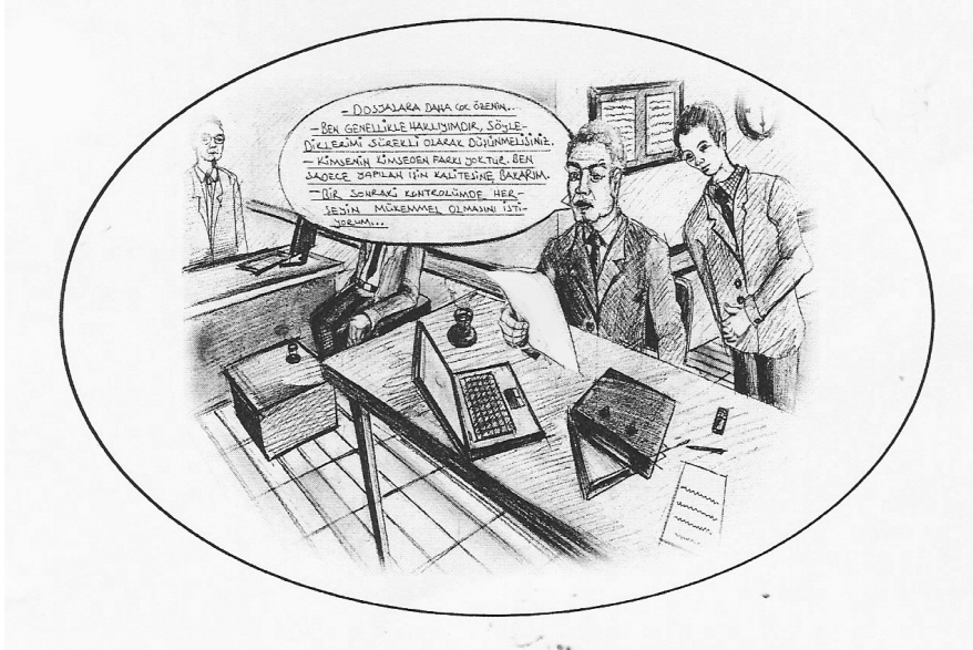
Karikatür 2. Öğretmen ve okul müdürlerinin bakanlık denetmenleri hakkındaki var olan imajlarının karikatürize edilmiş hali

Görüşler analiz edildiğinde ortaöğretimde görev yapan öğretmen ve müdürlerin bakanlık denetmenleri hakkında algılarındaki 38 kodlanmış imajın 20 tanesi olumlu, 18 tanesi olumsuz olduğu görülmektedir. Olumlu temadan frekansı en az 2 olan imajlar şunlardır: “Nazik”, “Yapıcı”, “Olumlu bakış açısına sahip”, “Paylaşımçı”. Olumsuz temadan frekansı en az 2 olan imajlar şunlardır: “Açık arayan”, “Eleştiren”, “Denetleyen”, “Özeleştiriye kaldırmayan”, “Sabit fikirli”, “Asık suratlı”, “Otoriter” ve “Şekilci”.