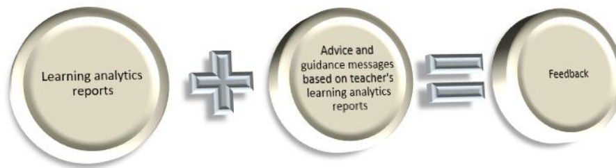
Figure 2. The structure of recommendation and guidance messages based on learning analytics