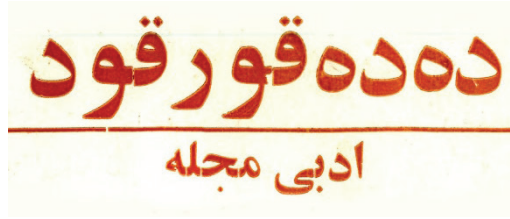
Şekil 1: Dede Korkut Edebi Mecelle

Dede Korkut Dergisi'nin kapak sayfaları Türk kültürü ve edebiyatı ile ilgili şahıslara ayrılmıştır. Kimi zaman tarihî şahsiyetler kimi zaman da çağdaş portrelere yer verilmiştir. Büyük yazıyla Dede Korkut adının önünde derginin sayısı yer almaktadır. Hemen altında "Edebi Mecelle" yazısı ve onun altında derginin yıl, sayı, ay ve fiyatı yazılmaktadır. Derginin genel çizgisi edebi konular içermektedir.