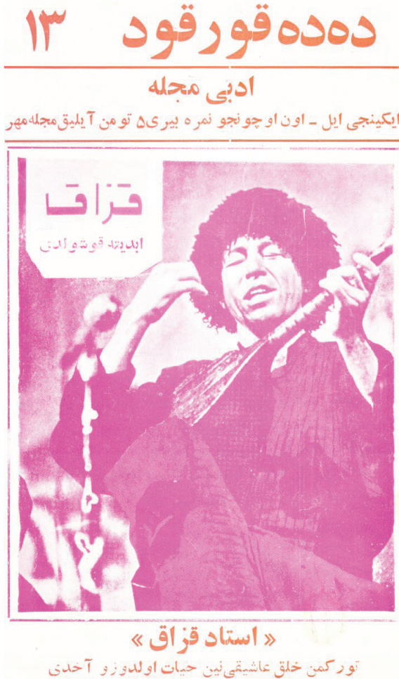
Resim 4: Dede Korkut Dergisi'nin on üçüncü sayısının kapağı

Dede Korkut Dergisi 'ndeki yazılarda genel olarak millî düşünce içerikli, millî duygulara hitap eden konular olduğunu görmekteyiz. Bu konular düz yazılar ve şiirlerde işlenmiştir. Bunların yanında millî edebiyatımızın yaratan âşıkların şiirlerine de yer verilmiştir. Bu dergi uzun süre yaşamına devam etmese de diğer dergilere yol göstericilik ve ışık tutmayı başarmıştır. Nitekim Varlık Dergisi'nin kadrolarında da bu derginin yazarlarını görmekteyiz.