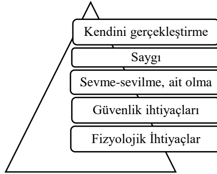
Şekil 1. Maslow'un ihtiyaçlar hiyerarşisi piramidi (Shunk, 1996).

iki yaşından, ergenlik çağına kadar gelişme gösteren insan olarak tanımlanmaktadır (Aytaş ve Yalçın: 2003:13; Sınar, 2007:16; Şirin, 2011:21). Çocukluk, insanoğlunun özel ve masum dönemlerine denk gelmektedir. Bundan dolayı çocuklar ilk dünyaya geldiklerinde masumiyet duygusuyla korunmaya, yardıma ve temel ihtiyaçlarının karşılanmasına ihtiyaç duymaktadır. Bu anlayış kuşak farkı olmaksızın her zaman savunulmaktadır. Yani çocuklar, dünyaya ilk gözlerini açtıkları aile ortamından başlayarak güven, sevgi, saygı, beslenme, korunma gibi yaşam koşullarını devam ettirmeyi sağlayan temel unsurlara gereksinim duymaktadır. Anne karnında başlayan bu duygu ve ihtiyaçlar yaşam boyu eğitimlerinde de devam etmektedir. Maslow'a göre anne ve babanın çocukların bu ihtiyaçlarını (Bakınız: Şekil 1) karşılamaları her zaman beklenmektedir. Çünkü ihtiyaçlar bireyin yaşamının devamlılığı için gerekli görülmektedir.