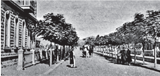
Şam Hamidiye Caddesi Servet-i Fünûn Dergisi, Sayı 186, Sayfa 49, 60.

Şehre yeni bir kimlik kazandıracak anıtsal mimarî eserlerin yaptırması, karşımıza çıkan sık bir olgudur. Örneğin “Şam’da yapılan yeni cadde” ile ilgili bilgiler verilirken “Şam Belediyesi şehre girer girmez yolcuların enzar-ı dikkatine hoş görünecek ve medhalin letafetiyle mütenasip düşecek surette bir daire inşa etmiş ve bu daireden Dilijans Kumpanyası Köprüsü’ne kadar yeni ve güzel cadde açtırmıştır.” Tasviri yapılan bu fotoğrafa baktığımızda oldukça geniş bir cadde, iki tarafında muntazam dikilmiş ağaçlar, solda bir binayla verilmek istenen mesaj örtüşür. Şüphesiz ki burada Avrupa şehirlerine bir öykünme söz konusudur. Bu öykünme şehirlerle ilgili bütün modernleşme çabalarında geçerlidir. Aynı durum Selanik’te açılan “Hamidiye Caddesi” için de söz konusudur. Burada şehircilikle ilgili bir diğer husus da II. Abdülhamit, yaptırdığı yeni caddelere, okullara, karakollara, hastanelere vs. kendi adını vermesidir. Belki de Osmanlı imparatorluğu’nda hükümdar ismi ile anılan en çok yapı ve mekân II. Abdülhamit’e ait olsa gerek.