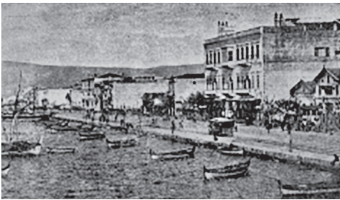
İzmir Kordonboyu (1891) Servet-i Fünûn Dergisi, Sayı 1, Sayfa 3.

Görsellerin, şehri yansıtırken pitoresk bir tarzda, romantik çağrışımlar yapacak biçimde olanları olduğu gibi şehrin o günkü vaziyetini, hâlini “belgeleme” özelliğine sahip olanları da vardır. Bu ikinci grup çok daha fazladır. Belgeleme amacı güdenlerde asıl maksat okuyucuya “görsel”den yola çıkarak şehir hakkında “bu şehrin genel görünüşü böyleymiş” diyebilecek bir intiba uyandırmaktır. Şehrin genel görüntüsü hakkında bilgi sahibi olmasını sağlamaktır. Günümüzden baktığımızda bizim için bu görsellerin büyük bir arşiv değeri taşıdığı su götürmez bir gerçektir. Şehrin – verildiği ölçüde – mimarî dokusu, topoğrafik özelliği hakkında bilgi sahibi olmamızı sağlar.