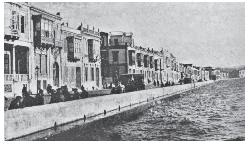
İzmir Kordonboyu (1928) Servet-i Fünûn Dergisi, Sayı 1671, Sayfa 229.