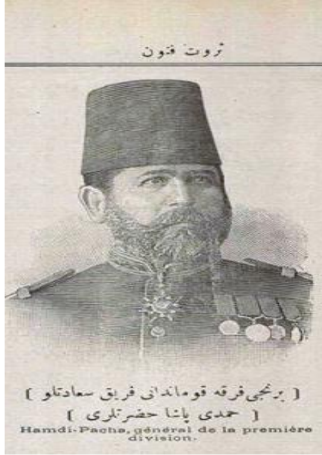
EK 6: Ferik Hamdi Paşa