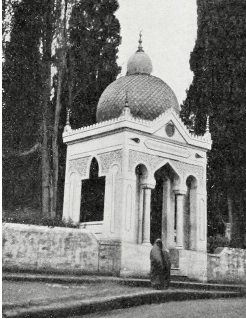
EK 5: Ferik Hamdi Paşa için Trabzon'da yapılan türbe 19