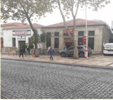
Şekil 1. Germiyanoğlu Vakıflar Hamamı günümüzde genel görünüm.

kubbeyle örtülmüş olmasına rağmen, bu mekânın yan bölümlerini ayıran kirişlerin içi geometrik şekillerle hareketlendirilip düz dam örtü ile örtülmüştür. Ilıklık bölümüne hem plan hem de süsleme açısından tam bir simetrik görünüm hâkimdir ( Şekil 4 ). 15 Hamamın son bölümü olan sıcaklık, kare şeklinde bir mekândan oluşmuş ve büyükçe bir kubbeyle örtülmüştür. Erkekler hamamında kubbenin içi sıvalı olmasına rağmen kadınlar hamamı kullanılmadığı için kubbe içi sıvanmamıştır ( Şekil 5 ). 15 Sıvanmadığı için tuğla işçiliğinin zenginliği kadınlar bölümünde daha detaylı bir şekilde görülmekte olup, kubbelerde açılan yuvarlak açıklıklarla mekânın havalandırılması ve aydınlatılması sağlanmıştır.