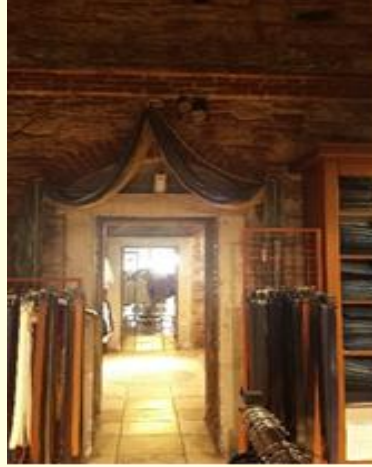
Şekil 8. Günümüzde tekstil satış mağazası olarak kullanılan kadınlar bölümünden bir görünüm.

Hamamın işleyiş durumuyla ilgili bilgi almak için 50 yıldır işletmecisi olan Çelik ailesinden bir kişi ile görüşülmüştür. 21 Hamamın soğukluk, ılıkılık ve sıcaklık bölümlerinin aktif olarak kullanıldığı, külhan bölümünün doğalgaza geçildiği için 2011 yılından beri kullanılmadığı anlaşılmıştır. Günümüzde hamamın tarihi yapısı korunarak, göbek taşı, buhar odası, havuz, masaj odası, sauna ve dinlenme salonu gibi bölümlerde eklenmiştir. Hamamda kullanılan su şehir şebekesinden sağlanmaktadır. Giriş ücretleri altı ayda bir enflasyon ve ekonomik göstergeler göz önünde bulundurularak, Denizli Kahveciler ve Gazinocular Odası tarafından belirlenmekte, Şubat 2020 tarihi itibarıyla 35 Türk Lirası hamama giriş ücreti alınmaktadır. 21 Hamam cumartesi ve pazar günleri de dâhil olmak üzere, her gün sabah 07:00 akşam 23:00 arasında faaliyet göstermektedir. İstisna olarak arife günleri bayram sabahına kadar açık olan hamam Ramazan ve Kurban Bayram'larının birinci günü öğlene kadar kapalı kalmaktadır. Hamam da görevli olarak meydancı (karşılama elemanı) iki kişi çalışmaktadır. Meydancılar, hamama gelen müşterileri karşılayan, yönlendiren, aynı zamanda müşterilere talep etmeleri halinde içecek sunan çalışanlardır. Hamamda müşteri yoğunluğuna göre iki ya da beş keseci çalışmaktadır. 21