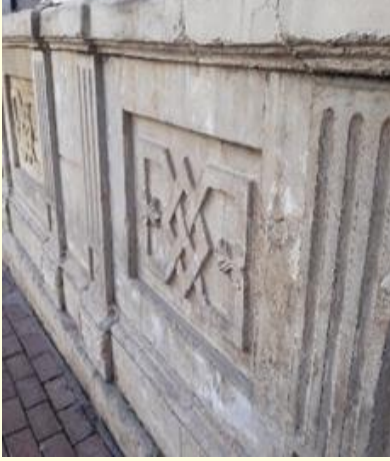
Şekil 7. Hamamın giriş cephesinde bulunan süslemeler.

Vakıflar Hamamı günümüzde Denizli Bayram Yeri Meydanı olarak adlandırılan bölgede, Saraylar Mahallesi, Kayalık Caddesi üzerinde, Atatürk Evi ve Etnoğrafya Müzesi'nin yanında yer almaktadır. 14 Hamam, Vakıflar Genel Müdürlüğü'nün mülküdür. Çeşitli dönemlerde restore edilen hamamın, dış cephelerinde sadelik hâkimdir, sadece giriş cephesinde Cumhuriyet Döneminde yapılan mermer ve taş süslemelerden oluşan panolar dikkat çekmektedir. 14 (Şekil 7). 13 Günümüzde hamamın erkekler bölümü hamam olarak işlevini sürdürürken, kadınlar bölümü bir tekstil firmasının satış mağazası olarak kullanılmaktadır. 25 (Şekil 8). 13