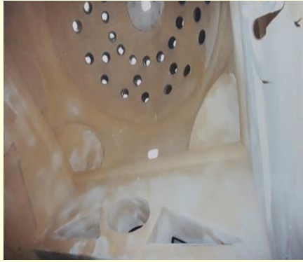
Şekil 4. Erkekler hamamının ilıklık bölümünü örten kubbe ve kirişler.