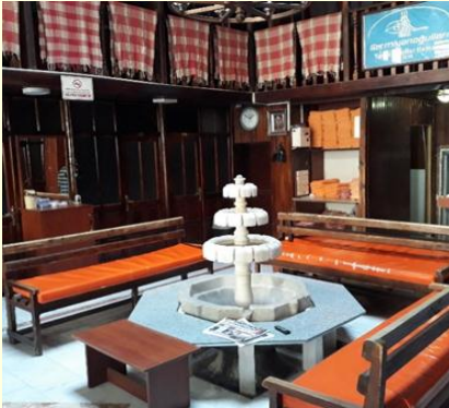
Şekil 3. Günümüzde hamamın soğukluk bölümü.