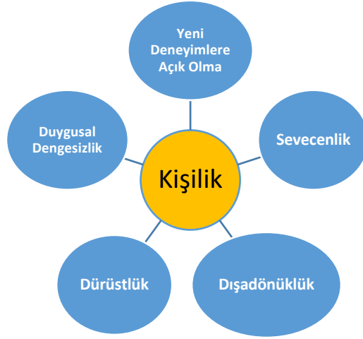
Şekil 1 "The Big Five" testiyle kişilik üzerinde etkisi olduğu ölçülen faktörler 14

Kogan ile bir kişilik testi (quiz) uygulaması geliştirmesi için anlaşmıştır. Kogan'ın kullandığı "The Big Five" kişilik ölçeği, CA'nın geliştirdiği testi dolduran kişilerin 5 farklı kişilik özelliğinden hangisinin güçlü olduğunu göstermektedir (Bkz. Şekil 1).