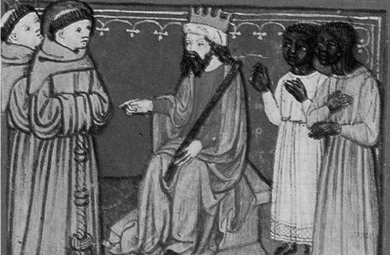
Resim 3. MS 1266