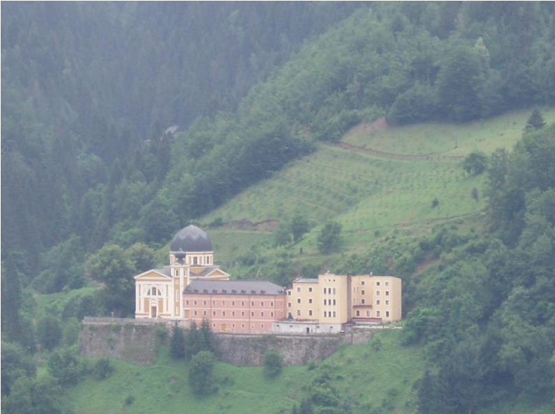
Resim 6. İsmail Paşa'nın orijinali, İstanbul'da