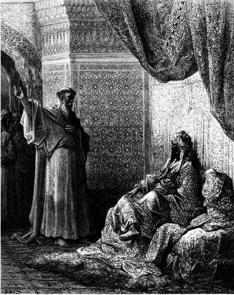
Resim 1. Gustave Doré'nin 1826'da çizdiği 'Saint Francis and the Sultan' adlı gravürü.

Joseph-İsmail, 'Saint Francis and the Sultan', in: Journal de la Société des Études Indiennes , Paris, 1826, gravure 50, i. 402. İsmail'in tablosu . İsmail'in tablosu .