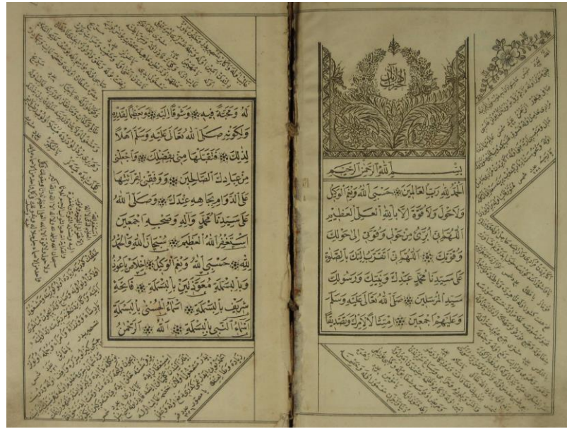
Yûsuf Şükrü Harpûtî, Hizmet-i Menba'î's-Se'âde 'alâ şerhi Delâil-i-Hayrât , Süleymaniye Kütüphanesi, numara 1937, (varak 1b, 2a).