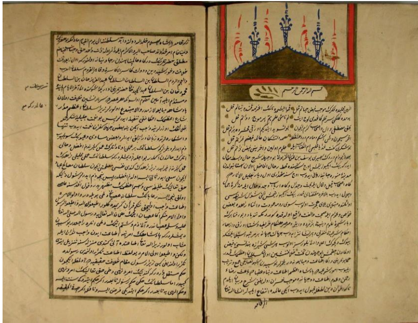
Yûsuf Şükri Harpûti, Nasihatnâme/Nesâyih Süleymaniye Kütüphanesi, numara 1846 (varak1b, 2a).