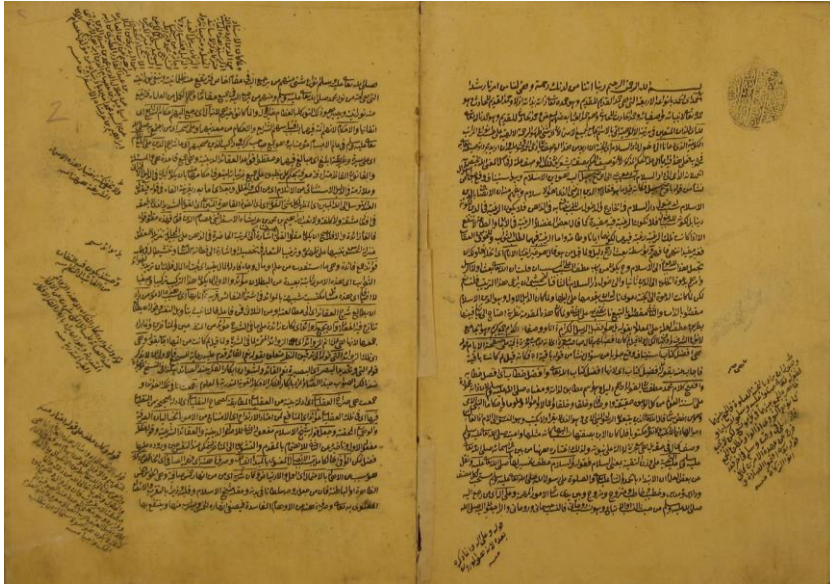
Yûsuf Şükri Harpûti, Hâşiye-i 'İsâm 'alâ Hâşiye , Süleymaniye Kütüphanesi, numara 1238, (varak1b, 2a).