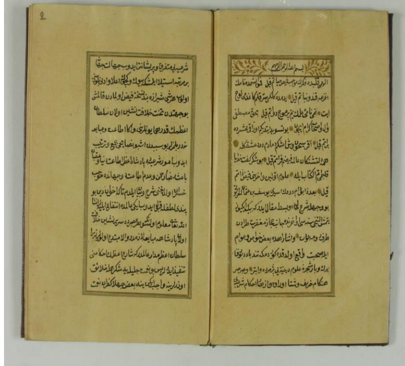
Yûsuf Şükrü Harpûtî, Nasîhatnâme/Nesâyih , Topkapı Müzesi, numara A35900, (varak 1b, 2a).