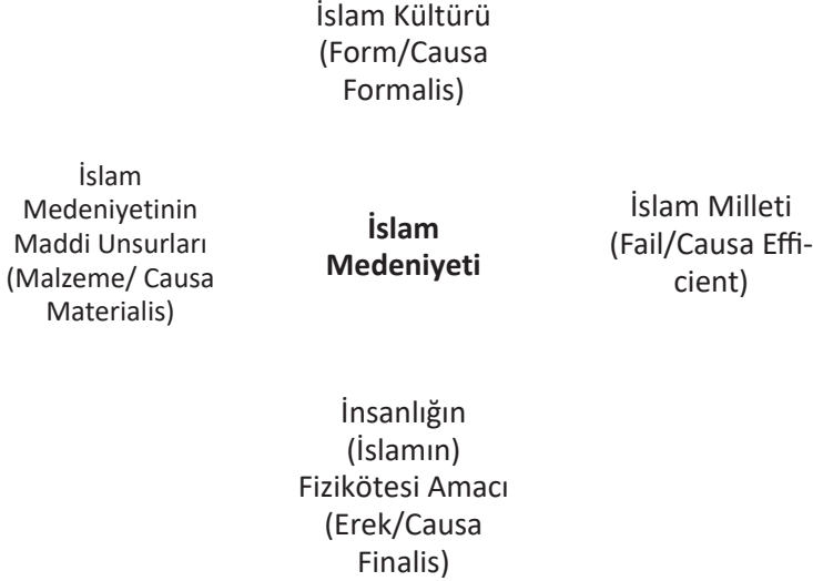
Şekil.4: İslam Medeniyetini Var Eden Dört neden

Süleymaniye Camii’nin projesi kültür ise, kendisi medeniyete tekabül eder. Süleymaniye Camii projesini içerir ancak projesi camii içermez. Süleymaniye’nin faili başta Mimar Sinan, Usta ve işçileri ile Osmanlıdır. Malzemesi de Süleymaniye’de kullanılan yapı taşlarıdır.