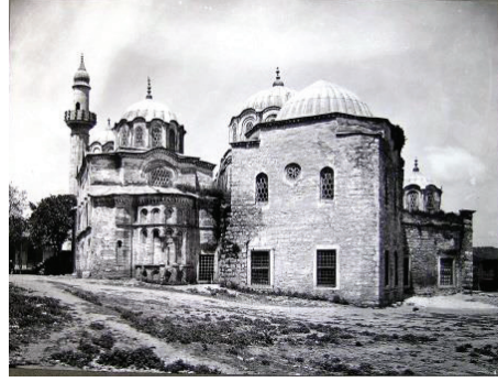
Şekil 5: a. Aldülhamit Arşivi'nde Fethiye Camii (1877 ?), b. Sebah Joallier Fotoğrafi'nda Fethiye Camii (1894 öncesi), c. 1910 sonrası Fethiye Camii (VGM Arşivi) (arkadaki Mimar Kemalettin'e ait mektep binasından yola çıkarak tarihlendirilmiştir.)