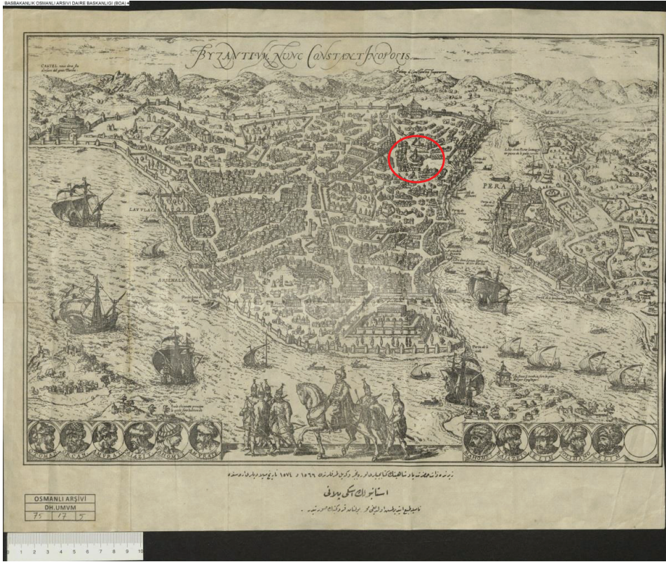
Şekil 2: 1566 - 1574 tarihleri arasında İstanbul'un eski planını gösteren DH_UMVM_75_17_5 numaralı haritada, yapının henüz patrikhane kullanımının devam ettiği dönemde olması nedeniyle Fethiye Camii yanında "Patriarchatu" yazdığı görülür.