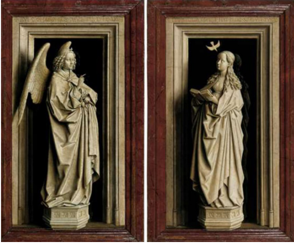
Şekil 2: Jan Van Eyck, The Annunciation Diptych

Yanılsamacı resimler İtalya'dan Hollanda'ya yayılıp en bilinen eserleri vermiştir. Ressam Jan van Eyck'in çalışmaları trompe l'oeil resminin en önemli örnekleri olarak bilinmektedir (Topal, 2014, s. 10). Jan Van Eyck'ın trompe l'oeil tekniği kullanılarak resmettiği "The Annunciation Diptych" adlı eseri, tuval üzerine yağlı boya resimde heykel yanılsaması yaratmaktadır (Şekil 2).