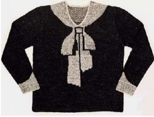
Şekil 10: Schiaparelli'nin trompe l'oeil kazağı,1927

senler bulunmaktadır (Şekil 10). 'Gibi durmak', temsil ettiği şey sanılmak trompe l'oeil'ün temel amacıdır. Söz konusu tasarımda, gerçekte olmayan öğelerin -yaka, fiyonk, manşet- desenlendirme ile var olduğu yanılsaması yaratılmış olup bu sayede trompe l'oeil giysi tasarımı olma özelliği taşımaktadır (Fogg, 2014, s. 264-265). Elsa Schiaparelli bu yaklaşımla, sanatın etkisinin moda ürünleri üzerinde de yorumlanabileceğini kanıtlamıştır.