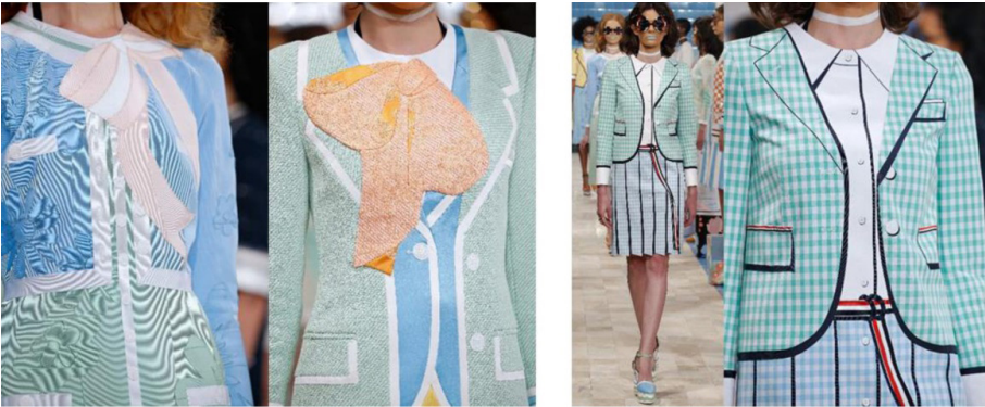
Şekil 21- Trompe L'oeil Giysi Tasarımı-Thom Browne, SS/2017

Trompe l'oeil tekniğini son yıllarda hemen her koleksiyonunda kullanan Amerikalı tasarımcı Thom Browne, cinsiyet normlarını yok edecek çalışmalara imza atmıştır. Tasarımcı 2017 yılı ilkbahar/yaz kadın koleksiyonuyla gerçek ve sahte arasındaki sınırı yıkarak, soft renklerle sıra dışı bir görünüm sunmuştur (Şekil 21).