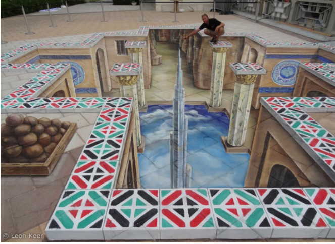
Şekil 6: Leon Keer, Dubai 3D Sokak Resmi, 2011