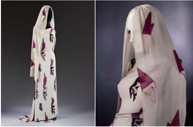
Şekil 11: Schiaparelli, 'Circus Collection', The Tears Dress

Schiaparelli'nin, 1938 yılına ait "Circus Collection" defilesinden "Tears Dress" isimli elbisesi Victoria & Albert Müze Koleksiyonunda yer almaktadır. Elbisede dekoratif bir unsur olarak yırtıklar ve gözyaşlarına benzeyen kumaş parçaları kullanılmıştır. Elbise üzerindeki baskı desenler sürrealist sanatçı Salvador Dali tarafından tasarlanmış trompe l'oeil uygulamalarıdır (Şekil 11).