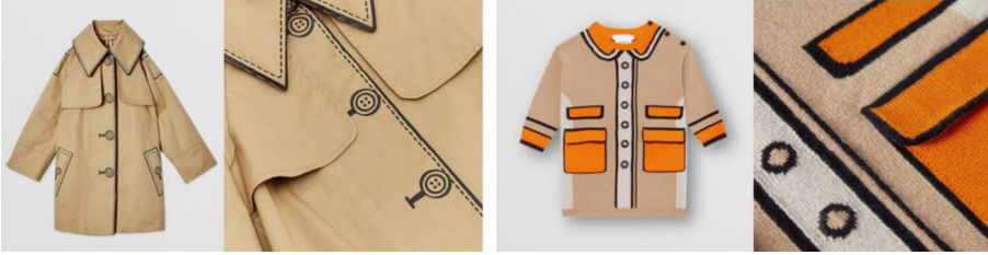
Şekil 20: Burberry Çocuk Koleksiyonu

Haute couture tasarımlarında görülen trompe l'oeil uygulamalar, günümüzde hazır giyim koleksiyonlarında da yer almaya başlamıştır. Burberry markasının 2019 yılında satışta olan çocuk hazır giyimi ürünlerinde, firmanın “trompe l'oeil giysiler” olarak satışa sunduğu koleksiyon çeşitli tekniklerle oluşturulmuş örneklerdir (Şekil 20). Burberry markasına ait çocuk yağmurluğunda dikiş, ilik, düğme deseni basılmışken çocuk kazağında ise bir başka trompe l'oeil uygulaması mevcuttur. Koleksiyonun önemli bir parçası olan kazakta hırka, bir örgü deseni olarak örülmüştür. Böylelikle yağmurluk örneğinde baskı, kazak örneğinde örme tekniği ile trompe l'oeil etkisi oluşturulmuş, desenler aracılığıyla temsili yanılısma yaratılmıştır.