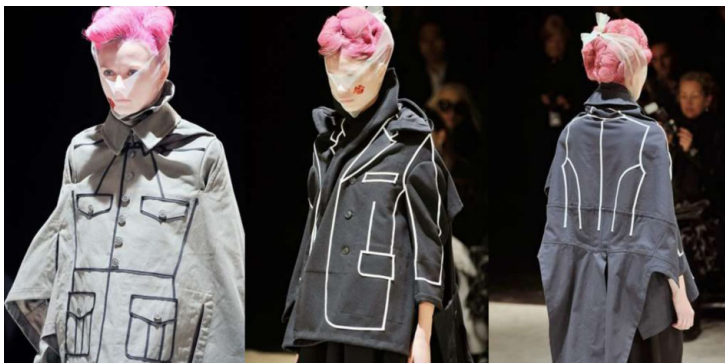
Şekil 16: Comme des Garçons'ta 2009 Sonbahar-Kış koleksiyonu

Tasarımcı Rei Kawakubo'nun, markası Comme des Garçons'da, 2009 yılı Sonbahar-Kış hazır giyim koleksiyonunda yanılsama kurgusu üzerine odaklanmış tasarımlar mevcuttur. Tasarımlarda Kawakubo'nun dekonstrüksiyonist tasarım stili üzerine trompe l'oeil resimlemeler yapılmıştır (Şekil 16). Konstrüksiyon anlamında ceket formunda olmayan giysiler üzerine, dikili şeritler ile yaka, klapa, ön kapama, arka orta çizgisi, pens, kup, cep, cep kapağı resimsel olarak yerleştirilmiştir. Söz konusu öğeler özgül varlıkları ile orada değildir; ancak resimsel düzeyde orada olduklarına dair iddia taşımakta, temsil edilmektedir. Temsil edilen şey ile ilgili yanılsamacı bir bakış fenomeni olan trompe l'oeil'e dair örnekteki giysi tasarımları temsil ve yanılsama açısından model alınabilir.