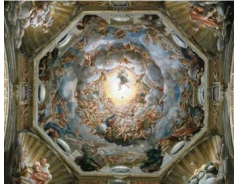
Şekil 1: Correggio, Meryem'in Göğe Yükselişi, Parma Katedrali Kubbesi

Trompe l'oeil Rönesans Sanatında çoğunlukla mimari mekânda yanılsama yaratma amacıyla yapılan duvar ve tavan resimlerinde yer almaktadır. Bu aşırı gerçekçi duvar ve tavan resimleri, içerisinde bulunduğu gerçek mekânın bir parçasıymış gibi durmakta ve izleyicide ileri düzey bir yanılsama yaratmaktadır (Sözen ve Tanyeli, 2017, s. 320). Bu gibi trompe l'oeil etkilerinin sağlanabilmesinin kaynağı ise kuşkusuz perspektiftir. Perspektif üç boyutu iki boyutlu düzleme taşıyarak, iki boyutta üç boyut algısı yaratmaya dair bir çizim tekniği olarak Rönesans öncesinde var olsa da günümüz anlamındaki perspektif 15. Yüzyılda Rönesans ile başlamıştır (Sözen ve Tanyeli, 2017, s. 243). Parma Katedrali'nin kubbesinde yer alan ve Correggio tarafından uygulanan "Meryem'in Göğe Yükselişi" adlı tavan resminde, kilisenin tavanında bulutlar ve aşağıya sallanırken havada asılı kalmış gibi duran figürler kubbede bir yanılsama etkisi göstermektedir (Şekil 1) (Gombrich, 2013, s. 338-339). Mimari iç alanlarda perspektifi başarıyla kullanan sanatçılar ustaca işledikleri ışık ve gölgeyle yapının tavanında sonsuz bir yanılsama yaratarak kubbeleri gökyüzüne, hayali pencereleri olmayan manzaralara açmışlar ve daha büyük ölçekli mekânlar elde etmişlerdir.