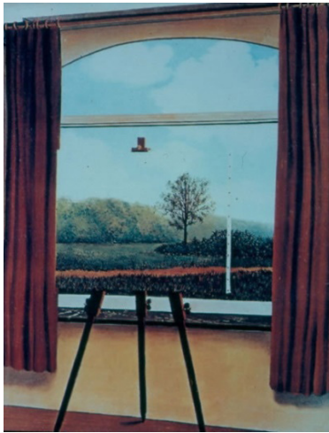
Şekil 3: Rene Magritte, La Condition Humaine

Trompe l'oeil resminin asıl ile temsil arasında yarattığı kuşkuyla dair bilinen örneklerden biri de Sürrealizm akımının önemli temsilcilerinden birisi olarak tanınan Belçikalı ressam Rene Magritte'in "La Condition Humaine" adlı eseridir (Şekil 3). Ressam, izleyicinin "pencere mi, tuval mi" arasında kesin karara varamadığı, yanıltıcı, ironik bir imge yaratmıştır. (Leppert, 2017, s. 42).