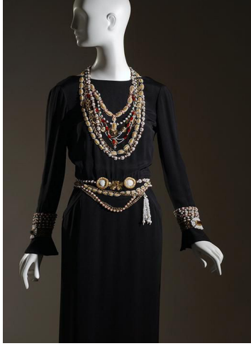
Şekil 15: Karl Lagerfeld'in Chanel için tasarladığı elbise

Triko ve baskı deseni olarak kurgulanmış moda tasarımında trompe l'oeil kullanımına dair farklı bir teknik 1983 yılında tasarımcı Karl Lagerfeld tarafından düşünülmüştür. Lagerfeld'in Chanel markası için tasarladığı gece elbisesinde, boncuk işleme tekniği trompe l'oeil yanılsamasıyla oluşturulmuştur (Şekil 15). Siyah elbisenin üzerine kolye, kemer ve bilezik takılmış gibi durmaktadır. Aslında mücevherler birer takı değil işleme ile elbisenin üzerine işlenmiş boncuklardır. Temsil ettiği şeyin neredeyse kendisi olma iddiası taşıyan trompe l'oeil tekniğine uygun boncuk işlemler, aksesuar gibi durmakta, izleyicide ileri düzey bir yanılsama oluşturulmaktadır.