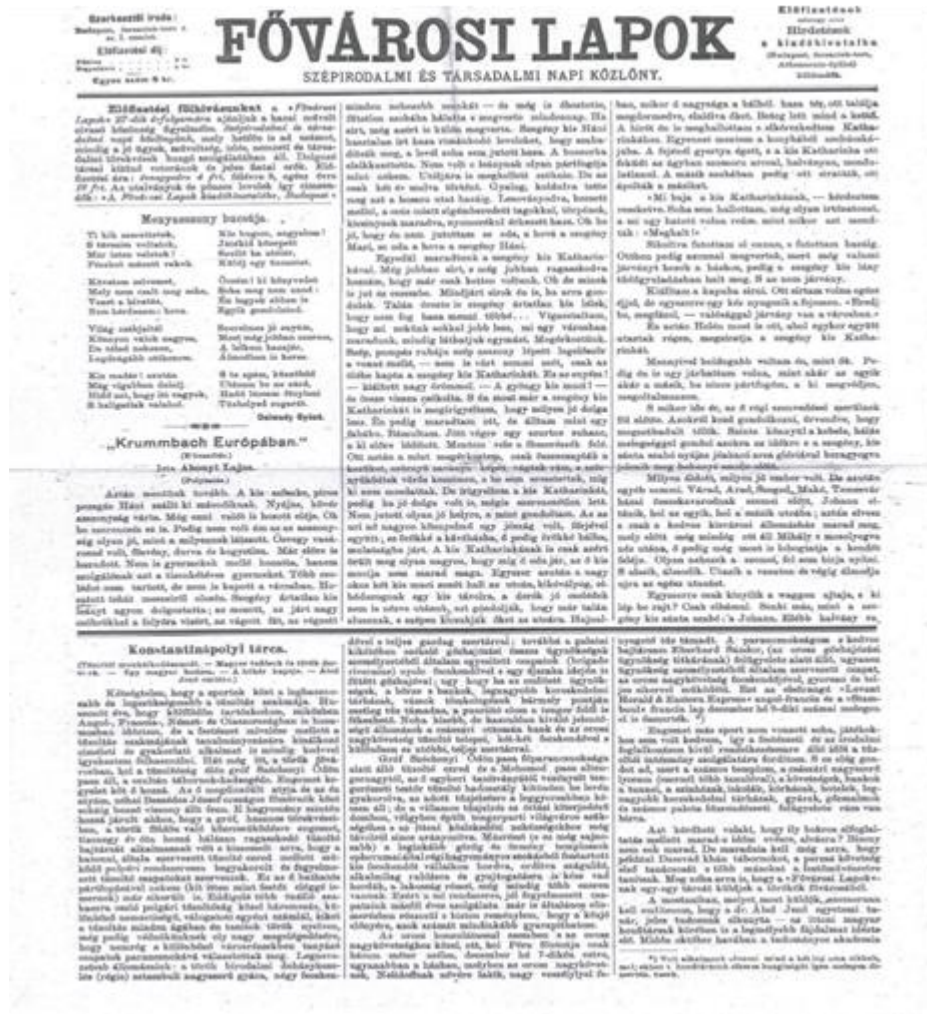
Ek-3: Kálmán Beszédés'in Fővárosi Lapok'ta yer alan bir köşe yazısı: "Konstantinápolyi tarca" (İstanbul'dan Çizgiler) Fővárosi Lapok'1890, január 5., 5.szám, Huszon hetedik évfolyam, s.29. ELTE Könyvtára, Kézirattar, G691