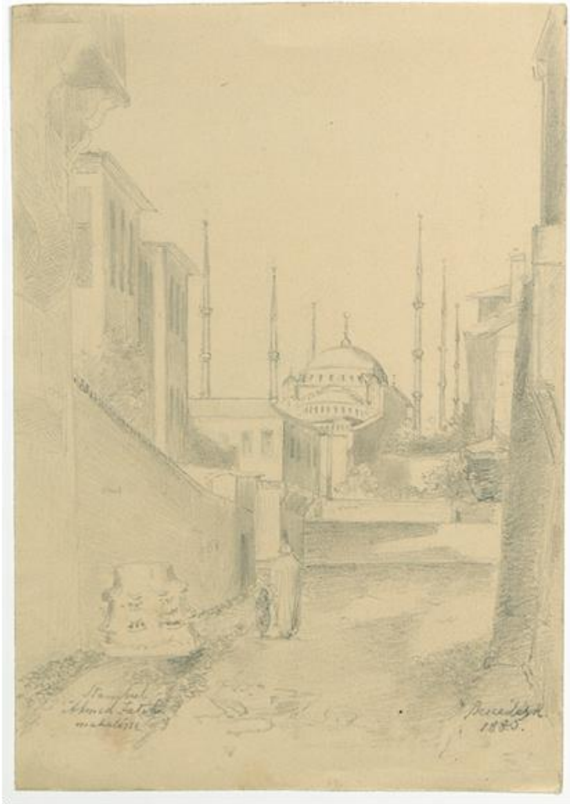
Ek-4: Ressay Kálmán Beszedes'in kaleminden İstanbul. (1880) ELTE Könyvtára, Kézirattar, G691