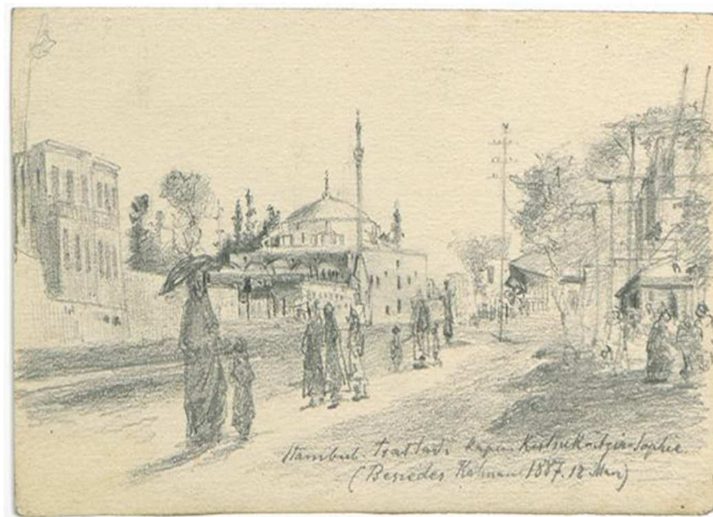
Ek-5: Ressay Kálmán Beszédes'in kaleminden İstanbul. (1887) ELTE Könyvtára, Kézirattár, G691