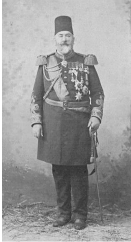
Ek-1: Kont Ödön Széchenyi

Türk- Macar Tarihi İlişkilerinden Kesitler , Milli Saraylar Daire Başkanlığı Yayınları, s.225.