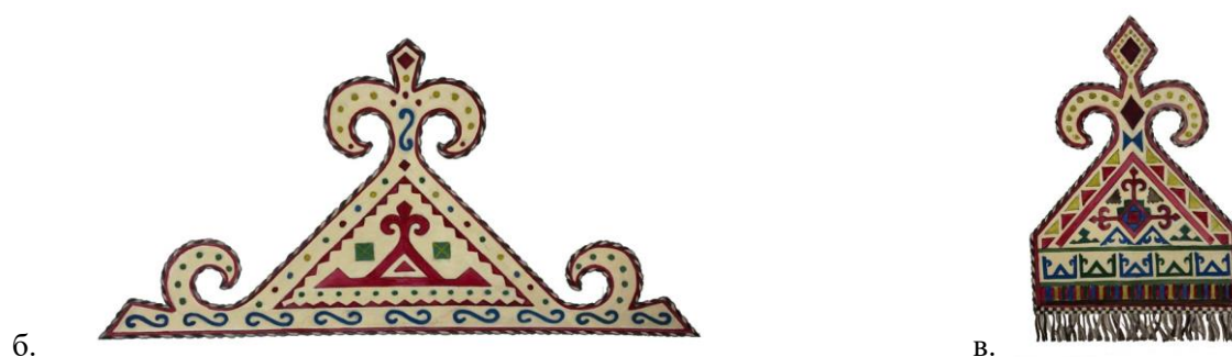
Рисунок 3. Изделия из войлока, используемые в декоративном оформлении свадебной юрты «ак отав». Ногайцы. Конец XIX – начало XX вв. Орнаментальный мотив – треугольник, нанесен методом аппликации на войлочный пояс «обзоьк басар» (а) и войлочные детали «манглашай», которые располагали над входом в юрту (б, в).