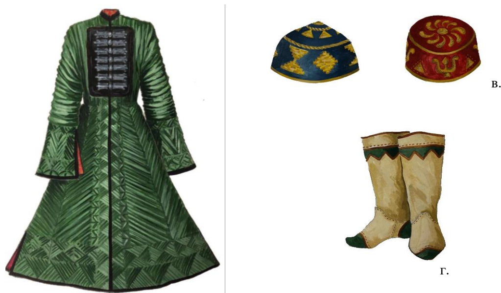
Рисунок 2. Предметы одежды, используемые в свадебной обрядности. Ногайцы. Конец XIX – начало XX вв. Орнаментальный мотив – треугольник, нанесен методом узорного простегивания (а), золотой вышивки в технике «вприкреп по настилу» (б, в) и аппликации из кожи (г).

применялись не для конкретного обозначения чрева, а для обобщения образа женщины-матери, прародительницы коллектива» (Асланова-Ханфенова 2013: 102). Эта интерпретация символа, делает понятным его присутствие на предметах одежды, связанных со свадебной обрядностью. Так, элементом «тымар», «дува» простегивали все открытые срезы свадебного бешмета «каптал» (Рис. 2, а), его вышивали на тюбетейках жениха и невесты «ыракшын» (Рис. 2, б, в), выкладывали на обуви (Рис. 2, г).