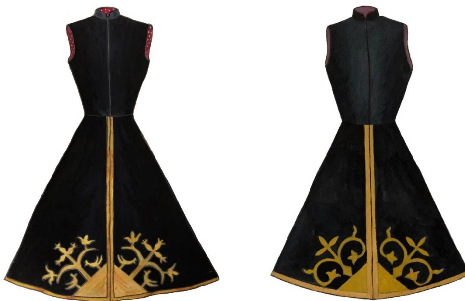
Рисунок 1. Женские кафтанчики. Ногайцы. Конец XIX – начало XX вв. Нижние углы полочек кафтанчиков декорированы золотой вышивкой – треугольником, «усиленным» отходящими от него орнитоморфными (а) и растительными (б) мотивами.

Самым древним и, пожалуй, самым загадочным элементом в ногайском орнаментальном искусстве является изображение треугольника, его называли «тымар» (позднее «дува», «дуважык»). Исследователи ногайского орнамента считают, что он защищал своей силой людей и их имущество от злонамеренных сил, неприятностей, сглаза и капризов природы (Казакбиева 2006: 129.; Мусукаев 2019: 69-70). В одежде мотив треугольника наносили на все открытые срезы, словно, «закрывая» все «входы» в тело человека. В женских нарядах обязательным элементом являлся вышитый золотыми нитями треугольник, расположенный в углах полочек кафтанчика, порой он «усиливался» отходящими от него орнитоморфными (Рис.1, а) и растительными мотивами (Рис.1, б).