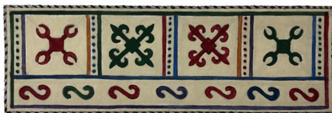
Рисунок 5. Войлочная деталь «иныг», используемая в декоративном оформлении свадебной юрты «ак отав». Ногайцы. Конец XIX – начало XX вв. Орнаментальные мотивы – учетверенные рога барана и быка, змея, след мышки нанесены методом аппликации, окантовочный орнамент – змеиное брюшко, выполнен в технике скручивания шнура.

Культ животного был отражен в зооморфном орнаменте – его первоэлементом являлся рог – «муьйиз». Такие мотивы как бараньи рога – «кошкар муьйиз», учетверенные бараньи рога – «доьрт кошкар муьйиз», восемь рогов – «сегиз муьйиз», сорок рогов – «кырк муьйиз», соединенные рога – «кос муьйиз», сломанные рога – «кыныр муьйиз», козьи рога – «теке муьйиз», оленьи рога – «марал муьйиз», рога быка – «буга муьйиз» – создавались на его основе. Изображение барана и бараньих рогов имело магическое значение, оно являлось символом плодородия, материального благополучия. Помимо различных модификаций мотива «муьйиз», присутствуют изображения животных, насекомых и частей их тела, например: «ат туяк» – копыто лошади, «табан» – ступня, «туье мойын» – верблюжья шея, «туье оьркеш» – верблюжий горб, «туье коьз» – верблюжий глаз, «кулын кулак» – ухо жеребенка, «бузав тис» – зуб теленка, «мысык ыз» – след кошки, «шышкан ыз» – след мышки, «коян кулак» – заячьи ушки, «бака коьз» – глаза лягушки, «ийт куйрык» – собачий хвост, «боьри коьз» – волчий глаз, «кумырска оюв» – муравьиный орнамент, «оьрмекши» – паук, «шыбын канат» – крылья мухи, «куьпелек» – бабочка, «йылан» – змея, «йылан бавур» – змеиное брюшко, «йылан бас» – змеиная голова и др. (Рис. 5).