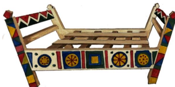
Рисунок 4. Деревянная кровать. Ногайцы. Начало XX в. На боковых стенках нанесены солярные знаки.

Культ животного был отражен в зооморфном орнаменте – его первоэлементом являлся рог – «муьйиз». Такие мотивы как бараньи рога – «кошкар муьйиз», учетверенные бараньи рога – «доьрт кошкар муьйиз», восемь рогов – «сегиз муьйиз», сорок рогов – «кырк муьйиз», соединенные рога – «кос муьйиз», сломанные рога – «кыныр муьйиз», козьи рога – «теке муьйиз», оленьи рога – «марал муьйиз», рога быка – «буга муьйиз» – создавались на его основе. Изображение барана и бараньих рогов имело магическое значение, оно являлось символом плодородия, материального благополучия. Помимо различных модификаций мотива «муьйиз», присутствуют изображения животных, насекомых и частей их тела, например: «ат туяк» – копыто лошади, «табан» – ступня, «туье мойын» – верблюжья шея, «туье оьркеш» – верблюжий горб, «туье коьз» – верблюжий глаз, «кулын кулак» – ухо жеребенка, «бузав тис» – зуб теленка, «мысык ыз» – след кошки, «шышкан ыз» – след мышки, «коян кулак» – заячьи ушки, «бака коьз» – глаза лягушки, «ийт куйрык» – собачий хвост, «боьри коьз» – волчий глаз, «кумырска оюв» – муравьиный орнамент, «оьрмекши» – паук, «шыбын канат» – крылья мухи, «куьпелек» – бабочка, «йылан» – змея, «йылан бавур» – змеиное брюшко, «йылан бас» – змеиная голова и др. (Рис. 5).