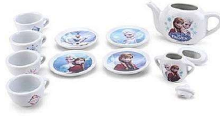
Görsel 17: Frozen Çizgi film Karakterli Çay Seti.

Kitle iletişim araçlarında gösterilen çizgi film kahramanları çocukların ilgisini çekecek şekilde biblolarla dönüşerek mağazaların satış reyonlarında yer almaktadır ( Görsel 18 ).