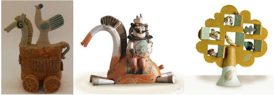
Görsel 21-22-23: “Little Horse”, “ A horse and his warrior”, “The enchanted tree- clay whistle, Seramik.