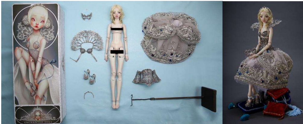
Görsel: 19-20: Marina Bychkova Porselen Bebekler.

Erken Dönemlerden beri çocukların özellikle de kız çocuklarının ilgi odağı olan bebeklerin, günümüzdeki etkisi artarak devam etmektedir. Bebek olarak üretilen oyuncakların günümüzdeki izdüşümü değiştiği anı, hatıra ya da dekoratif obje niteliği kazandığı söylenebilir. Dönemin modasından etkilenerek üretilen porselen bebekler etkileyici görünümleri ile yetişkinlerin koleksiyonlarında yerini almaktadır.