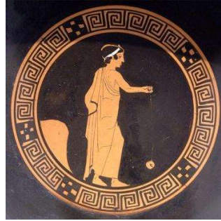
Görsel 3: Yoyo Oynayan Bir Erkek Çocuk, M.Ö.440, Antik Yunan Klasik Dönem Berlin Antik Koleksiyonu, Almanya.

Yoyo, eşit büyüklükte iki adet diskin ortalarından tutturulan çubuk ile bu çubuğa ip sarılarak disklerin bulunduğu kısmın yere doğru atılması ve ipin geri sarılarak ele yaklaşması ile oynanan bir oyuncaktır (Görsel 3). Pişmiş toprak, ahşap, bronz örnekleri bulunmaktadır (Selvi-Bener, 2016: 156-157).