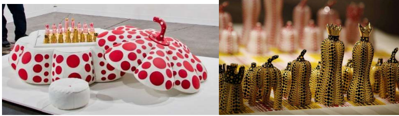
Görsel 27-28 : “Pumpkin” Adlı satranç takımı, 2003.

Japon sanatçının sürekli kullandığı form olan balkabağına ilgisi çocukluğuna dayanmaktadır. Sanatçı, yetmiş yılı aşan uygulamalarını önemli ölçüde etkileyen balkabağını ustalıkla, kendine özgün motifleri ve organik biçimlerle içindeki çocuk çöşküsü ile ürettiğini belirtmektedir. (URL-3). Çocukluk dönemindeki mental bozukluk yüzünden gördüğü halüsinasyonlar ile her yerde çiçek ve noktalı şekiller görmesi sanat yaşamını şekillendirmiştir. Klasik Japon resmin etkisi ve takıntılı tekrarlardan oluşan çalışmaları, Japon asobi (oyun) kavramı ile ilişkilendirilip eğlenceli, yaratıcı sanat biçimlerine dönüşmektedir (Bell, 2010: 91). “Pumpkin” adlı porselen satranç takımı ile içindeki çocuğu oyuna davet ediyor hissini yaşatmaktadır ( Görsel 27-28 ) .