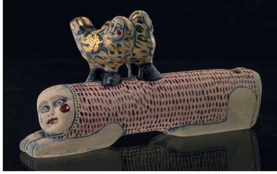
Görsel: 31: Düdük, Seramik, 1990, Macaristan.