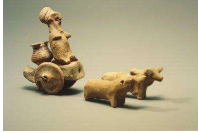
Görsel 8: At Arabası, Pişmiş Toprak, M.Ö. 3000-2500, Pakistan Indus.

Oyuncak arabalar özellikle erkek çocuklar için ilgi çekici oyuncaklar arasında yer alırken hareket ettirilebilmesi, taşıma özelliğinin olması bu arabaların en sevilen oyuncaklar arasında yer almasını sağlamıştır ( Görsel 8).