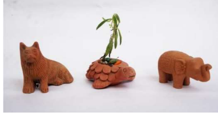
Görsel 12: Hayvan Figürlü Oyuncaklar, Dharavi, Mumbai, Hindistan.

Dünyanın birçok ülkesinde üretilen düdükler, günümüzde de primatif özellikleri yansıtan yönleriyle üretilmeye devam etmektedir (Görsel 13-14-15). Çeşitli formlarda üretilen seramik düdükler sadece çocukların değil yetişkinlerin de ilgisini çekerek hediyelik eşya olarak satın alınmaktadır.