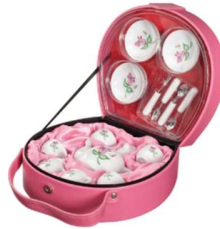
Görsel 16: Toymith markalı Seramik Çay Seti, Amerika.

Oyuncak seramik ve porselen çay takımları, üretildiği ya da pazarı olduğu ülkenin geleneksel motiflerini ve kitle iletişim araçlarının popüler çizgi film kahraman karakterleri ile dekorlanarak üretilmektedir. Genellikle üretimin az maliyetli olduğu Çin’de bugün hala çocuklar için seramik mutfak eşya oyuncakları üretilip dünya pazarına sunulmaktadır (Görsel16- 17).