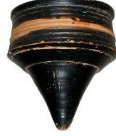
Görsel 2: Kilden yapılmış topaç, MÖ 5. yy, Antik Yunan Dönemine ait, Atina Milli Arkeoloji Müzesi.

oyanan oyuncaklardır. Ahşap, pişmiş toprak, cam, bronz ve kurşun gibi çeşitli malzemelerden yapılan topaçlar, kız ve erkek çocukların hatta yetişkinlerin oyuncakları arasında yer almaktadır (Selvi-Bener, 2016: 147-148).