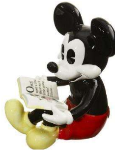
Görsel 18: Mickey Mouse Seramik Figürü.

Kitle iletişim araçlarında gösterilen çizgi film kahramanları çocukların ilgisini çekecek şekilde biblolarla dönüşerek mağazaların satış reyonlarında yer almaktadır ( Görsel 18 ).