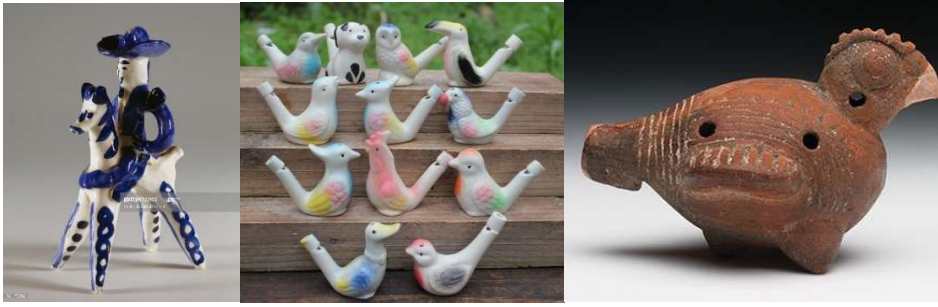
Görsel 13-14-15: Hayvan formunda düdükler, İspanya, Çin ve Meksika.

Dünyanın birçok ülkesinde üretilen düdükler, günümüzde de primatif özellikleri yansıtan yönleriyle üretilmeye devam etmektedir (Görsel 13-14-15). Çeşitli formlarda üretilen seramik düdükler sadece çocukların değil yetişkinlerin de ilgisini çekerek hediyelik eşya olarak satın alınmaktadır.