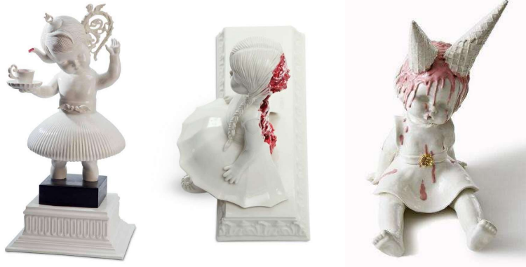
Görsel 24-25: ” Till the last drop” ,“ Back off” Porselen, 2012.

verdiği sınırlılık ve sınırsızlıklarla ile çalışmalarını şekillendirir. Yüksek derecede pişen porselen çamuru, pişme sırasında deforme olmaya yatkın olduğundan bebeklerin boyutları gerçek bebek boyutundadır. Bebeklerin büyük bir kısmı beyaz kalırken vurgulamak istediği kısımları altın ya da kırmızı renkler ile ön plana çıkarmaktadır (Görsel 24-25-26).