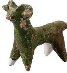
Görsel 4: Koç Biçimli Düdük, Sadberk Hanım Müzesi.

şeklinde biçimlendirildikleri görülmektedir (Görsel 4). Ses çıkardıkları için çocukların ilgisini cezbetmiş olabileceği düşünülmektedir (Hakan, 2012:76-77).