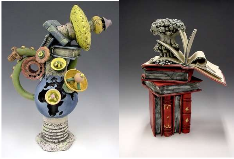
Görsel: 29-30 : “Solar”, “History of war”, Porselen, 2008.

Steven Allen seramik ile tanışmadan önce makine uzmanı olarak çalışmaktaydı. Fakat 1985'te tanıştığı seramik ile bağıni hiç koparmadan üretimlerini halen devam ettirmektedir. Sanatçının genelde seramik tornasında şekillendirdiği büyük boyutlu çalışmaları bulunmaktadır (Görsel 29). Fakat yıllar içinde geliştirdiği tekniklerle de yaşadığı toplumdaki etkilenecek kendi kişisel tarihini oyun oynarmışçasına seramik formlarla dışarı aktarmaktadır (Görsel 30).