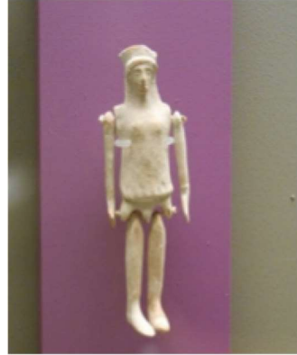
Görsel 5: Bebek, Louvre Müzesi MÖ 700, Louvre Müzesi, Fransa.

Görsel 6: Hareketli Bebek, Pişmiş Toprak, MÖ 500, Atina Ulusal Arkeoloji Müzesi, Yunanistan.