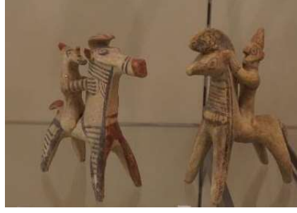
Görsel 7: Süvari figürleri, Louvre Müzesi, MÖ 7.yy, Fransa.

Oyuncak arabalar özellikle erkek çocuklar için ilgi çekici oyuncaklar arasında yer alırken hareket ettirilebilmesi, taşıma özelliğinin olması bu arabaların en sevilen oyuncaklar arasında yer almasını sağlamıştır ( Görsel 8).