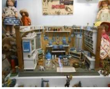
Görsel 10: Bebek Evi, Prag Oyuncak Müzesi, Çek Cumhuriyeti.

öğrenmenin de mümkün olabileceği bilinci benimsenmiştir. Çocukluk anlayışının değişmesi, oyuncak ticaretinin de gelişmesine ve büyümesine yol açmıştır. Bu dönemde üretilen bebek evleri, çocuk oyuncuğu olarak doruk noktasına ulaşmış, ayrıca eğitsel oyuncak olarak da yerini almıştır. Kız çocuklarına mutfak takımlarını düzenlemeyi, ev işi yapmayı öğreten bebek evleri, aynı aile içinde nesilden nesile geçerek toplumsal hafızayı da aktarmayı sağlamıştır (Onur, 2010: 64-65) (Görsel 10).