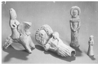
Görsel 9: Tüp şeklinde bebekler, Pişmiş Toprak, 14.yy Nürnberg Müzesi, Almanya.

Antik dönemden sonra yaşam daha çok çalışma ve savaşa üzerine kurulu olmuştur. Bu yüzden Orta Çağ'da çocuklar ya babalarının mesleğini devam ettirme ya da ev ekonomisine katkıda bulunacak şekilde bir işte çalışmak durumunda kalmışlardır. Çalışmaktan arta kalan zamanlarında da eski oyuncakları ile ya da kendi ürettikleri oyuncaklarla oynamışlardır (Görsel 9).