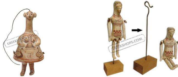
Görsel 11: Nevrospasta Bebek ve Boeotia Bebek, Pişmiş toprak, MÖ 3. yy, Helenistik Dönem, Atina Ulusal Arkeoloji Müzesi, Yunanistan.

Seramik oyuncak reproduksiyonlarının en güzel örneklerine Atina Ulusal Arkeoloji Müzesi'nin hediyelik eşya mağazasında görülmektedir. M.Ö. 3. yüzyıla uzanan eklemli el ve bacaklara sahip insan figürü şeklinde "Nevrospasta" ile M.Ö. 8 yüzyıl Boeotia adlı seramik bebekler bulunmaktadır (Görsel 11).