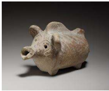
Görsel 1: Domuz Şeklinde Çingirak.

Çocuğu oyalamanın yanı sıra kötülükleri uzaklaştırdığı düşüncesiyle sallandığında ses çıkaran çingiraklar, kemik, pişmiş toprak, deri, ahşap gibi malzemelerden yapılmaktaydı. Çingiraklar domuz, horoz, köpek, ayı kaplumbağa şeklinde çocukların ilgisini çekecek biçimlerde şekillendirildiği görülmektedir (Selvi-Bener, 2016: 143), (Görsel 1). Bunlar arasında en ilginç olanı iki işlevli olan MÖ 375-325 yılları arasında Eski Yunan'da kullanılan pişmiş topraktan yapılmış çingirak biberonlardır. Süt ile dolu olduğunda ses çıkarmayan, süt bitince annesinin boş biberonu sallamasını bekleyen bebeğin, boş biberonun içindeki topçuklardan gelen eğlenceli seslere koşullanması ile biberon çingırağa dönüşmektedir. Bu durum Antik dönemde çocuk psikolojisine önem verildiğini göstermektedir (Selvi-Bener, 2016: 146).