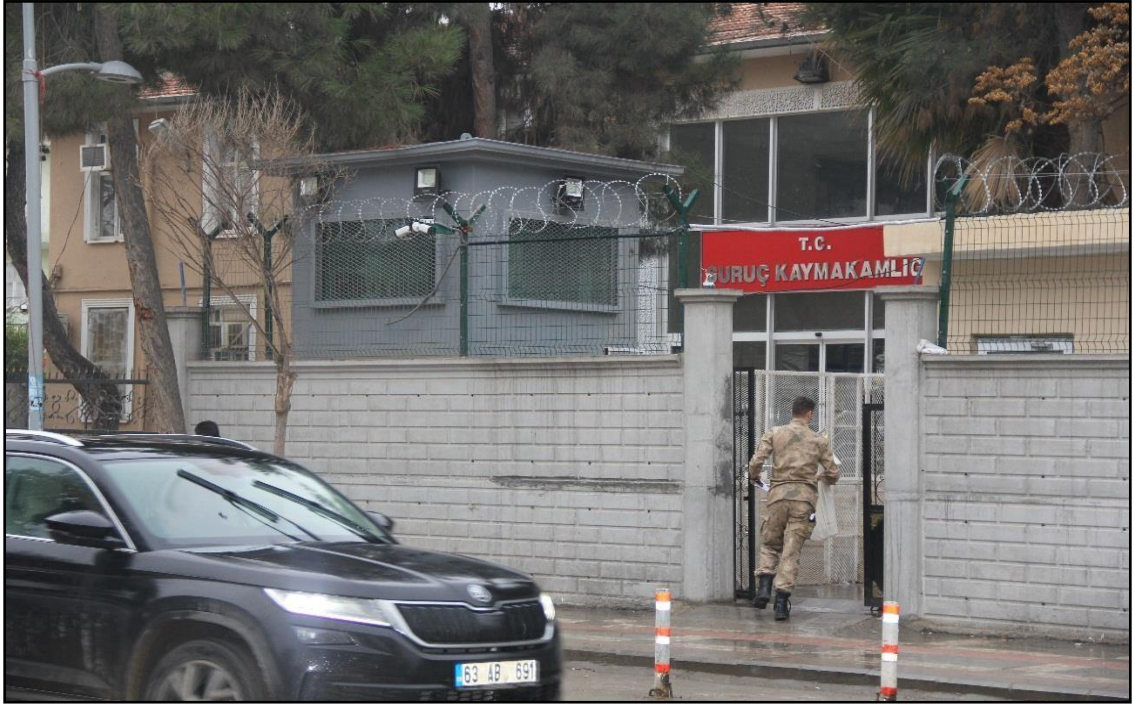
Fotoğraf 2. Cumhuriyet Mahallesi 'ndeki Suruç Kaymakamlığı 'ndan Bir Görünüm.

Yerleşmelerin en önemli fonksiyonlarından biri olan idari fonksiyon, o yerleşmenin gelişmesi ve merkezi yer olarak kabul edilip değer görmesinde rol oynayan önemli bir faktördür. Çünkü yönetim ile ilgili bütün kadrolar merkezde bir araya gelmiş olup ülke yönetiminin en üst düzeydeki temsilcileri, bu merkezden topluma hizmet etmektedir. Bu yüzden şehirlerin merkezi yer olarak bünyelerinde barındırdıkları kamu kurum ve kuruluşları, yönetim fonksiyonunun uygulayıcısı olarak ilçe merkezi genel görünümünün değişmesinde önemli bir yere sahip olduğu söylenebilir (Karaboran, 1989: 89). İdari açıdan Şanlıurfa'ya bağlı olan ilçe 1923 yılından sonra zorunlu olarak birçok kamu kurum ve kuruluşları içinde teşkilatlandırmıştır. Suruç 788 km2 alanıyla, 10 merkez mahalle, 85 köy ve 126'sı ise mezra olmak üzere bütün bu yerleşmelerin resmi ve idari işlerinin yapıldığı yönetim merkezi durumundadır.