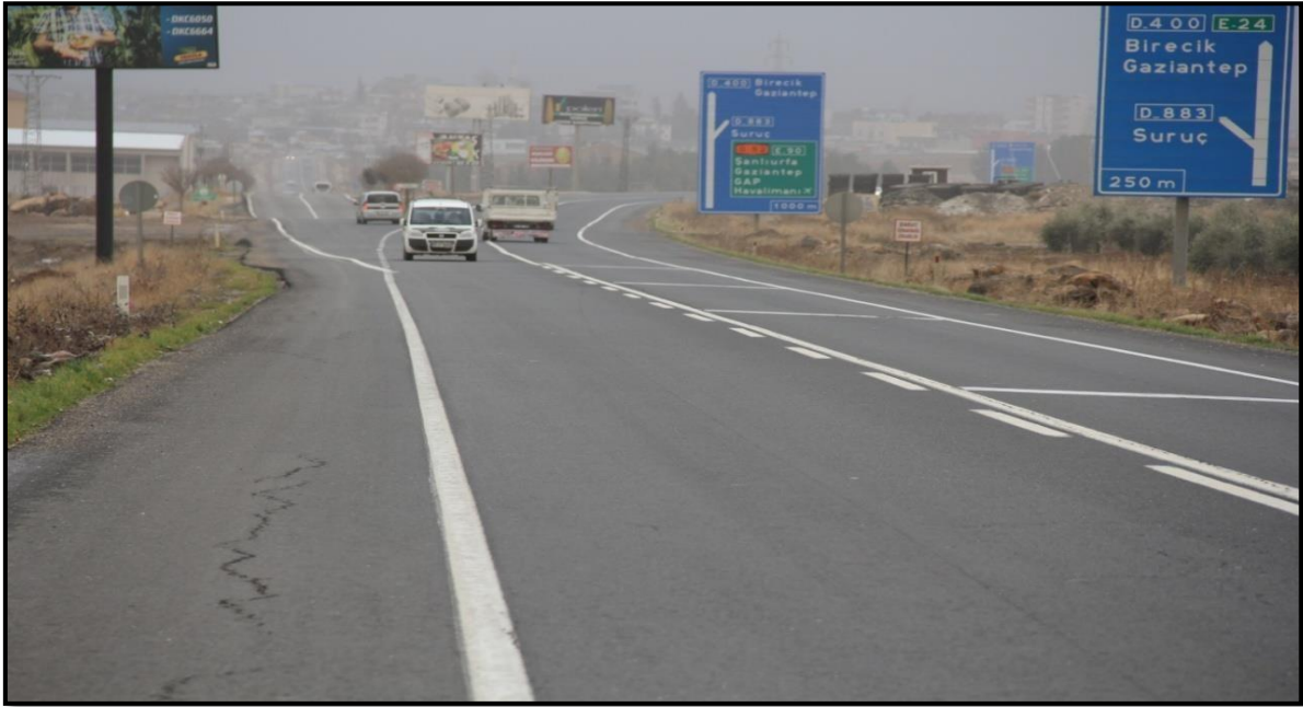
Fotoğraf 5. D-400 Karayolunun, E-24 Karayoluna Bağlayan Kavşaktan Görünüm.

Kente Mürşitpınar Gümrük Kapısı yer almaktadır. Bu gümrük kapısı Şanlıurfa'nın Akçakale ve Ceylanpınar'dan sonra Suriye topraklarına açılan bir diğer gümrük kapısıdır. Ankara Anlaşması'yla demiryolu hattı sınır olarak kabul edildiğinden ikiye bölünmüştür. Bu demiryolunda önceden Mürşitpınar istasyonu ile Mardin- Gaziantep hattında seyahat eden vatandaşlara hizmet verilmekteydi fakat Suriye sınırında yaşanan son olaylardan dolayı gümrük kapısının bulunduğu alana ve Mürşitpınar istasyonuna geçiş izni verilmemektedir.