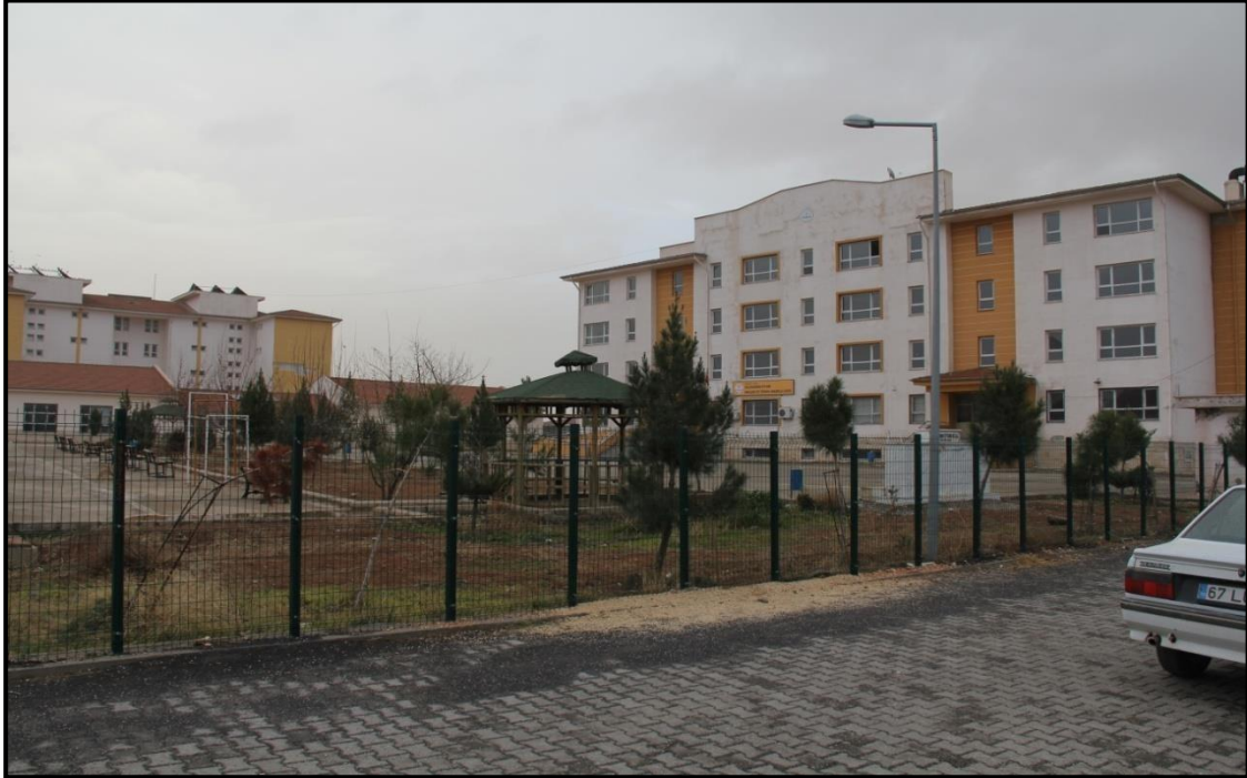
Fotoğraf 3. Onbircan Mahallesi'ndeki Selahaddin Eyyubi Meslek ve Teknik Anadolu Lisesinden Bir Görünüm.