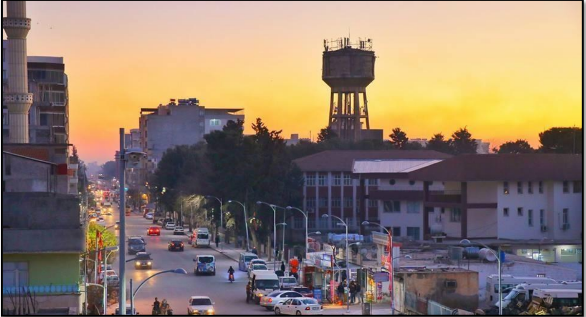
Fotoğraf 1. Sarayaltı Mahallesi'nin Onbirnisan Caddesinden Görünüm.

Yerleşmelerin temel öğelerinden biri olan, barınmaya yönelik en basit bir kulübeden kentlerin en çağdaş apartmanlarına kadar bütün evler, sanata, eğitime, dini amaçlara, ticarete, savunma ve değerlerine yönelik olarak yapılmış binaları ifade eder (Denker, 1977: 60). Araştırma sahasında tarım alanından sonra %25,5 (450 ha) ile en fazla alanı oturma alanı oluşturur. Oturma alanlarının büyük çoğunluğu bir ve iki katlı iş yerlerinden oluşurken bu iş yerlerinin üst katları aile konutu olarak kullanılmaktadır. Kentin konut özelliğine bakıldığı zaman ikamet konutlarının %90'nı, iki ve daha fazla katlıyken bahçeli ev tipi oldukça düşüktür. Kentin hemen hemen her mahallesinde az veya çok iş ve ticaret alanı bulunmaktadır. Demokrasi, Barış, Yenişehir mahallerinin büyük çoğunluğu ikamet olarak kullanılan mahalleler iken; Aydın, Dikili ve Sarayaltı mahallelerinde ise iş yeri oranı yüksektir. Kentte 2017 verilerine göre 8400 daire yer almaktadır. Bu durumda kent içerisinde hektara düşen daire sayısı 18,6'dır. İlçe merkezinde yapılar arasında mesafe oldukça azdır ayrıca binaların kendisine ait bahçe ve yeşil alanlarının da yok denecek kadar az olduğu söylenebilir. Kentte nüfusun artmasıyla birlikte site tarzı konutlar her geçen gün artmakta ve bazı mahallelerde planlı yapılaşma için belediye tarafından çalışmalar devam etmektedir.