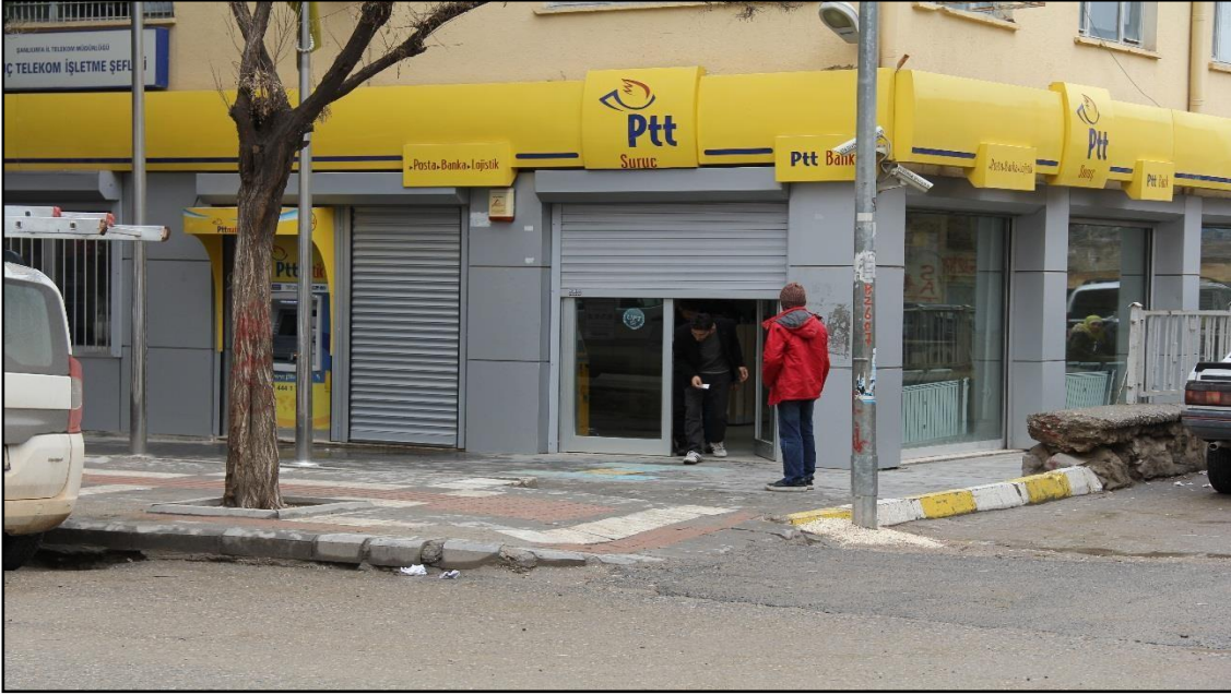
Fotoğraf 6. Sarayaltı Mahallesi'ndeki PTT Binasından Bir Görünüm.