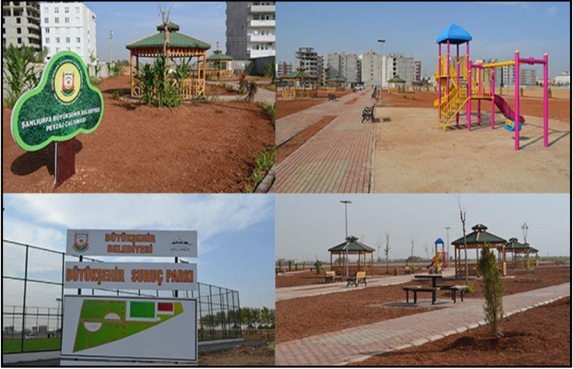
Fotoğraf 7. Demokrasi Mahallesi'nde Yapımı Devam Eden Suruç Parkından Görünüm.

yakında hizmete açılacak olan bu parkların içerisinde kamelya, çocuk oyun grubu, spor aletleri, semt sahası, yürüme yolları ve oturma grupları yer almaktadır.