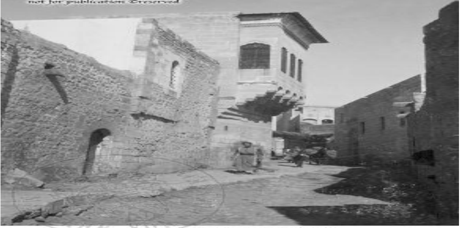
Oppenheim gündelik hayatın akışı içinde bir Urfa Sokağı 5

Gerek iklimsel koşulları minimize etmek amacıyla gerekse mahremiyeti gözetmek amacıyla Urfa evlerinin duvarları yükseltilmiştir (Ekinci, 2018: 14). Yerasimos'a göre "İslâm kenti, bir uçtan öbürüne, bir mahalleden diğerine kişilerin diledikleri gibi geçebilecekleri bir alan değildir; kapı, çarşı, ulu camii gibi kamusal niteliği en belirgin yerlerin en özel mekân olan eve büyük sokak, küçük sokak ve çıkmaz sokak aracılığıyla, yani gittikçe kamudan özele geçmeyi sağlayan bir ilerlemeyle varılabilir. Çıkmaz sokak mahremiyetin ve korunmanın bütün avantajlarına sahiptir" (Üner, 2015: 24). Osmanlı İmparatorluğu'nda neredeyse tüm kadınlar sokakta edebe aykırı hareket etmemişler ve sokaklarda benzer giysilerle görünmüşlerdir (Ekinci, 2018: 17). Toplumsal talep ve anlayış doğrultusunda oluşturulan yapılarda ona göre de davranılması beklenmektedir. Aslında bu da mahremiyetin bir tür yansımaları olarak karşımıza çıkmaktadır. Urfa evlerinde dam geleneği örneğini veren Aynur Can bunun hem talep meselesi hem de mahremiyet ile olan geleneksel bağını örnek vermektedir. İnsanlar mekânı inşa ederken talepleri doğrultusunda mekân inşasına katılımları söz konusudur. Bu bakımdan adalet ve mahremiyet kavramları da mekân ölçeğinde yerine oturmaktadır. 6