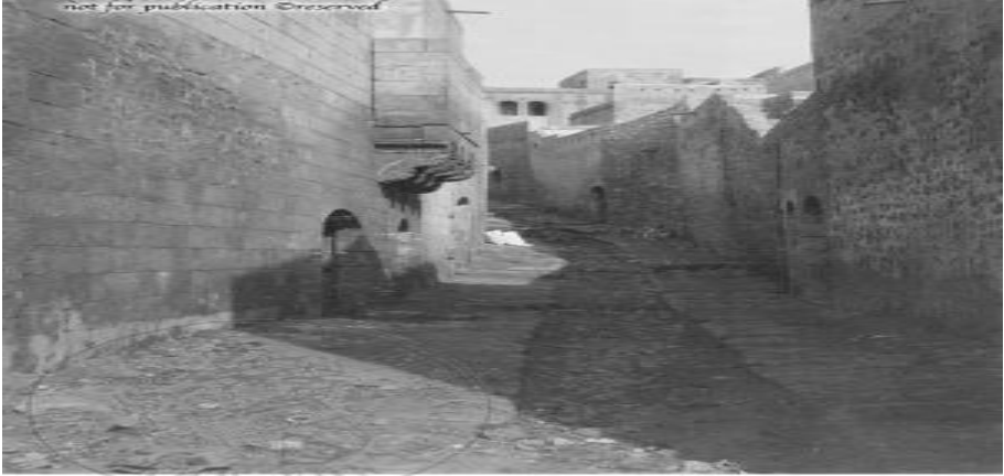
Oppenheim'in perspektifinden Urfa Sokağı'na dair bir görüntü 4

Geleneksel Urfa mahallelerine baktığımızda da mahremiyetin yansımaları hem sokak yapılarında hem de evlerde görebilmek mümkündür. Urfa şer'iyye sicillerinde geçen ve çıkmaz sokak anlamına gelen tetimme kavramı halk ağzında tetirbe olarak söylenmektedir. Tetirbeler olarak ifade edilen sokağa bağlanan evler “tarîk-i hass ile mahdud” olarak kamuya açık değil özeldi (Ekinci, 2018: 12). Bu sokaklar genellikle kavisli, dolambaçlı ya da ivivaçlı (Bayartan, 2005: 89) idi. Tetirbelerde çocukların oyun oynadığını kadınların sohbetler ettiğini öğrenmekteyiz. M. Fuat Kürkçüoğlu anılarını anlattığı romanında bu çıkmaz sokaklarda gülle peste, koza kırık ve çelik çibih oyunlarını oynadıklarını anlatmaktadır (Kürkçüoğlu, 2018: 147). Dolayısıyla bu sokakların bir yönü de Urfa'nın sözlü tarihine ışık tutmaktadır.