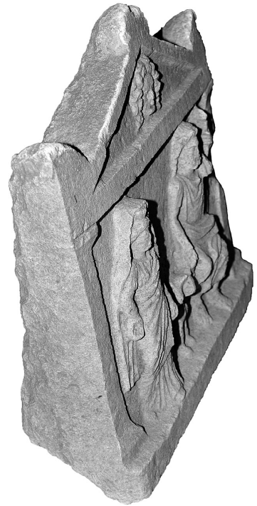
Res. 3 Stelin yandan ve üstten görünümü