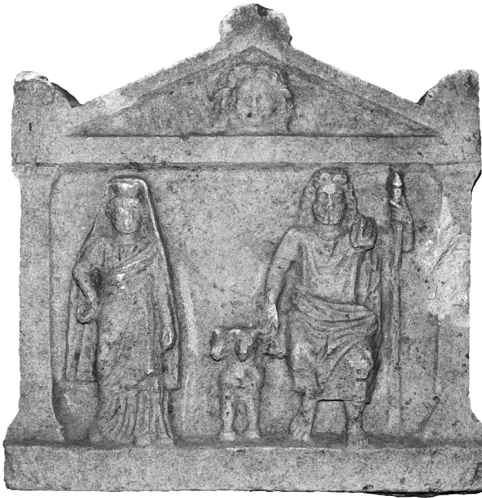
Res. 2 Keçili'de bulunan adak steli cepheden