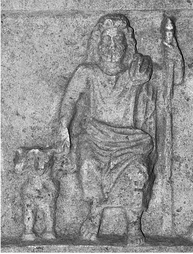
Res. 4 Plouton, yanında Kerberos'la birlikte