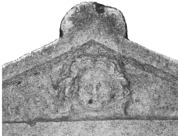
Res. 6 Alınlık ortasında işlenmiş Medusa başı