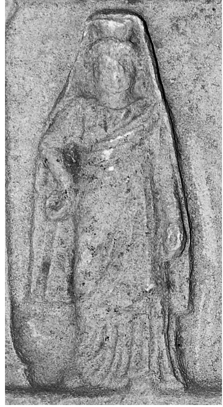
Res. 5 Kore, başında polos-kalathosuyla