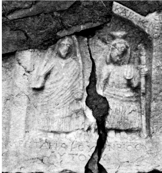
Res. 8 Keçili'de evin duvar örgüsü içinde kullanılmış, Sarapis-İsis olarak nitelenen stel (Özsait – Labarre – Özsait 2004, 80, fig. 22)