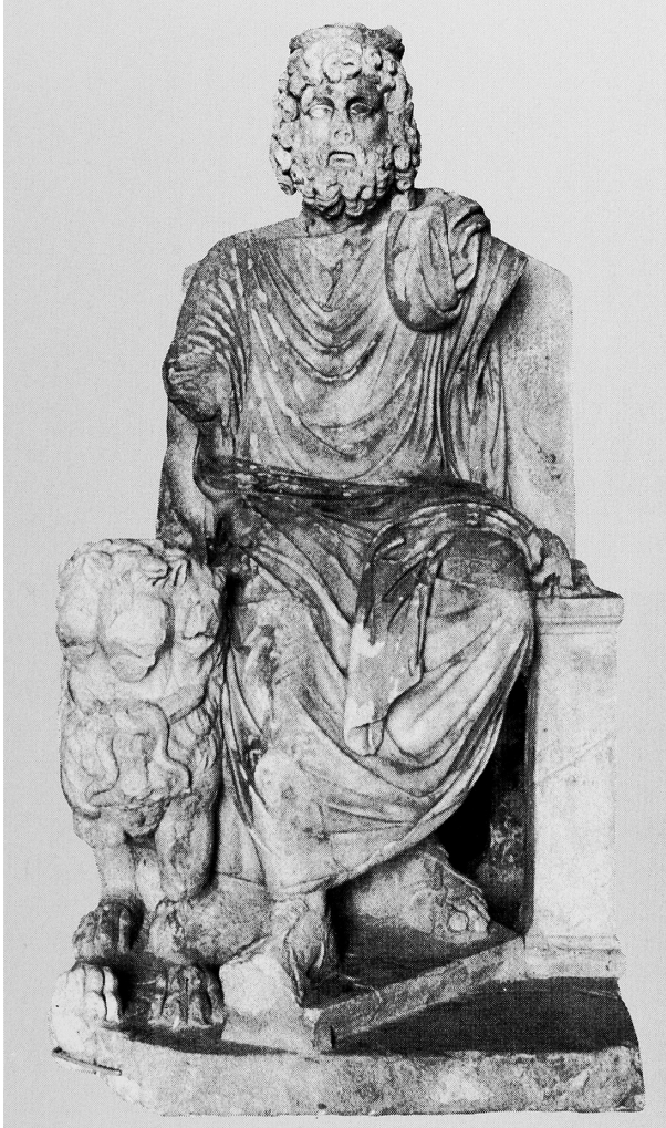
Res. 7 Hierapolis Tiyatrosunda bulunmuş Severuslar dönemine tarihlenen Hades/Plouton heykeli (Ruth 1988, Hades 8)