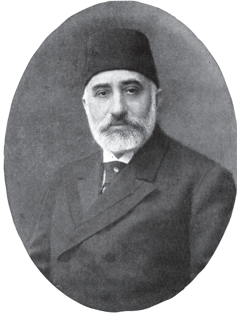
Ali Fuat Türkgeldi

Ali Fuat Türkgeldi'nin kaleme aldığı yakın Türk tarihiyle alakalı üç önemli eser ( Ricâl-i Mühimme-i Siyasiyye , Mesâil-i Mühimme-i Siyasiyye , ve Görüp İştiklerim ) aşağıda ayrıntılarının verileceği şekliyle kütüphane raflarında yerini almıştır, fakat diğerlerini bulmak mümkün değildir. Temelde Âli Türkgeldi'nin hazırladığı biyografi esas alınarak, zaman zaman da Arşiv'deki Ali Fuat Türkgeldi Evrakı içindeki belgelerle desteklenerek hazırlanan bu makaleyle bir yandan yakın tarihe ilgi duyan araştırmacıların gözden kaçırmamaları gereken ve henüz okuyucuyla buluşmayan bazı eserlere dikkat çekmek, diğer yandan da özellikle Ali Fuat Türkgeldi hakkında, örneğin bir son Osmanlı bürokratının gözünden imparatorluğun son dönemleri konulu ileri bir çalışma yapmak isteyenlere mütevazı bir katkı sağlamak hedeflenmiştir.