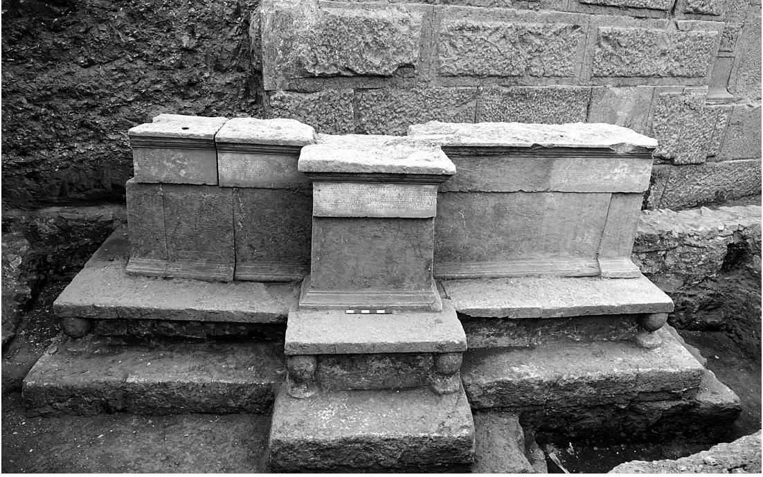
Res. 1 Bloklar toplu (önden)