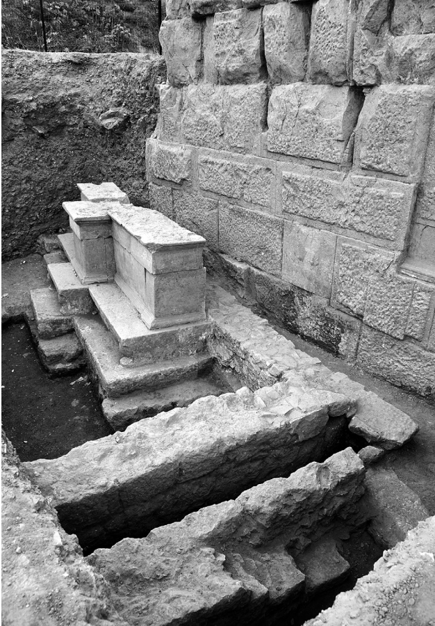
Res. 2 Bloklar toplu (yandan)