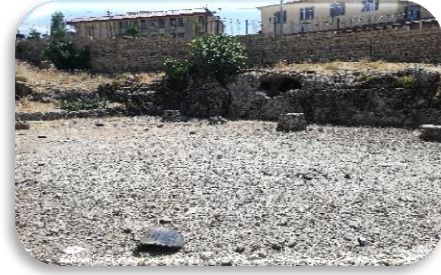
Fotoğraf 3. Amidiye'deki tarihi sit alanı. Fotoğraf 4. Amidiye'deki tarihi sit alanı (M. Emin Sular, 25/08/2019).

Süleymaniye şehrinin 70 kilometre kuzeyinde yer alan dağda oyulmuş Kızılkapan mezarlığı vardır. Alan bir salon, üç oda ve üç mezardan oluşmaktadır. Mezarın dış kısmında birkaç din adamı, bir ateş altarı ve dört kanatlı fraveher rölyefi yer alır. Rus arkeolog Diakonov Kızılkapan mezarlığının Med kralı Cyarex'e (M.Ö. 625-585) ait olduğunu iddia etmiştir. Fakat bu bilgi doğrulanmış değildir ve burasının Partlar/Aşkaniler dönemine ait olma ihtimali daha yüksektir. 66 Örneğin İran'da Ahamenişler dönemine ait Taht-ı Cemşid'de taşların üzerindeki fravher sembolü iki kanatlıdır. Fakat Kızılkapan'daki dört kanatlıdır.