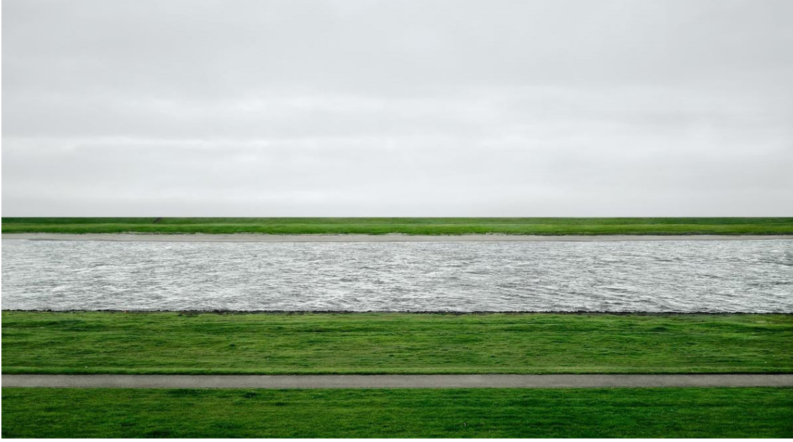
Görsel 6. Andreas Gursky, Ren Nehri II, 1999.

bireysel perspektifin sınırlarının ötesinde, insan yapımı ve doğal dünyayı yöneten tek bir insan bakış açısından görünmeyen güçlerin kapsamını haritalamanın bir yolu olarak görmektir” (2014: 81). Diğer yandan Montparnasse , şeyleşmiş bir toplum ve yaşam alanının göstergesidir.