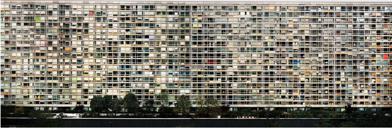
Görsel 5. Andreas Gursky, Montparnasse , 1993.

sonlarından itibaren Düsseldorf Ekolu'nün önemli temsilcilerinden birisi haline gelmiştir.