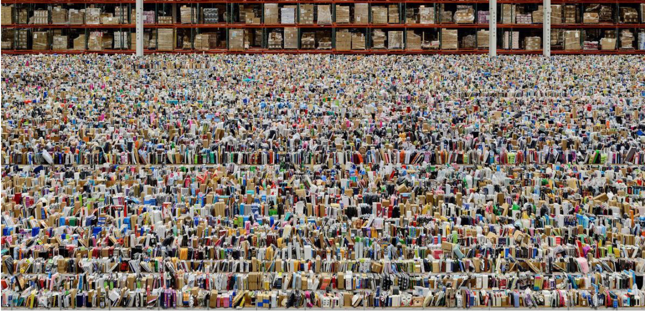
Görsel 7. Andreas Gursky, Amazon, 2016.

çalışmada abartılı sanatsal ifade biçimlerinden ve ışık oyunlarından kaçınılmıştır. Böylelikle, romantizme ilişkin duygu ve coşkunluğun önüne geçilerek deadpan estetiğin ön plana geçmesi sağlanmıştır. Tony Clancy (2017: 26), deadpan fotoğraflarda romantizmi reddedilişini şu şekilde özetler: “Bu fotoğraflar, dünyanın modern bir bakış açısıyla romantizmin reddettiğini somutlaştırıyor ve bakışlarımızı, günlük, belirsiz, görünüşte güzel olmayan ve dikkat çekici olmayan manzaralara zorlama eğilimindedir” . Diğer yandan Gursky deadpan estetikten faydalandığı bu çalışmasında uyguladığı dijital manipülasyonla, topografyayı şöyleştirmektedir.