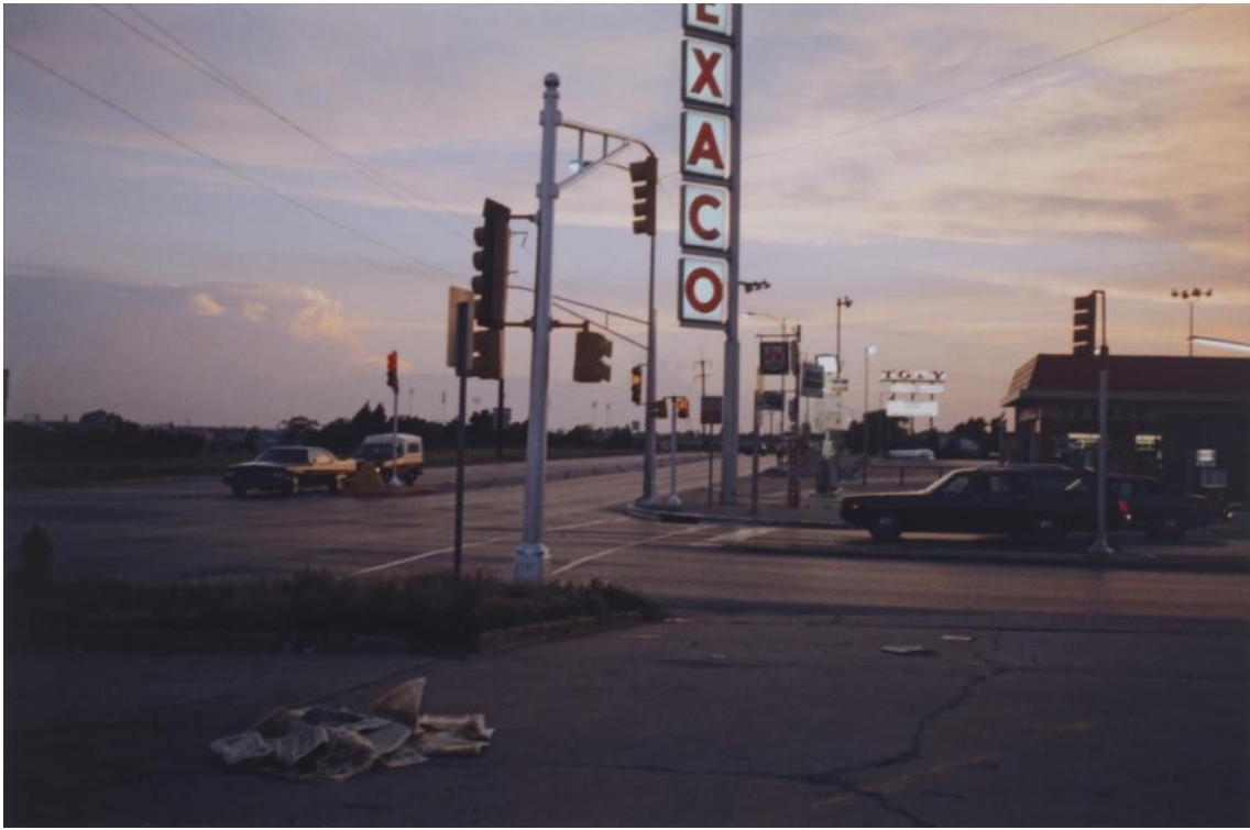
Görsel 3. Stephen Shore, Oklahoma , 1972W

sanayileşmiş alanlara, sivil mimariden kamusal alanlara değin mekâna ilişkin tüm alanları kapsayan, gerçekliği tarafsız ve sistematik belgeleme hassasiyetine sahip ve ayrıca eleştirel bir tavrı ifade etmektedir. Bu yönüyle topografya, deadpan estetikle bağdaşmakta ve ondan beslenmektedir.