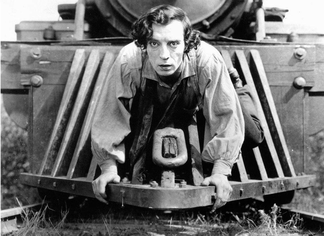
Görsel 1. Buster Keaton, General , 1926.

Deadpan , İngilizce ölü (dead) ve 1920'li yılların sonunda Amerika argosunda yüz anlamında kullanılan pan kelimelerinin bir araya gelmesinden oluşan bir terimdir. Bununla birlikte deadpan , 1933 yılında ifadesiz yüz anlamında bir isim olarak kullanılmaya başlanmıştır ("Deadpan", t.y., par. 1). Yüzün, ifade ve duygudan diğer bir deyişle insanın ruh halini belli edecek herhangi bir mimikten arınmış halidir. "Geleneksel olarak konuşmalarda, kamuya açık bilgilendirmelerde ve komedilerde kullanılan genellikle tekdüze bir konuşmada mizahın, duygu veya yüz ifadesinde değişiklik olmadan aktarıldığı retorik bir anlatım tarzı olarak kabul edilir" (Vinegar, 2009: 854). Diğer yandan bu retorik anlatım tarzını sanatsal bağlamda ilk olarak teatral alanda Buster Keaton (1895-1966) kullanmıştır.