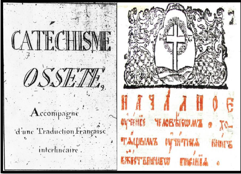
Kitapların Kapak Resimleri 18