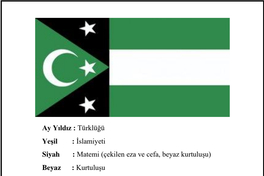
Şekil 3: Batı Trakya Bağımsız Hükümeti Bayrağı

Kaynak: (Bayar, 1997, s. 159; Bıyıklıoğlu, 1992, s.81)