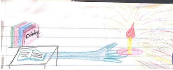
Şekil 4. Kadın öğrenci, 23. katılımcı

“Hemşirelik akademik hayat uzanan, hastaların karanlık dünyalarına ışık tutan bir meslektir.” (Şekil 4. Kadın öğrenci, 23. katılımcı)