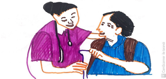
Şekil 5. Kadın öğrenci, 14. Katılımcı

“Hemşirelik benim için hayatın her alanında insanlara uzatılmış yardım eli. Hemşirelik iletişim demektir.” (Şekil 5. Kadın öğrenci, 14. Katılımcı)