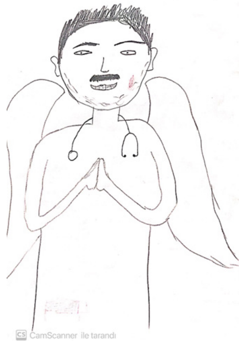
Şekil 3. Erkek öğrenci, 9. katılımcı

Öğrencilerden birkaçının ise kategorilere girmemekle birlikte hemşirelik mesleğinin çalışma şartlarının ve saatlerinin olumsuz olmasından bahsettiği görülmüştür.