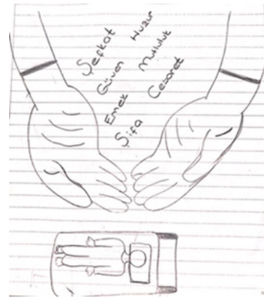
Şekil 1. Kadın öğrenci, 12. Katılımcı

“Hemşirelik; lise yıllarımdan beri hayalini kurduğum tek şeydi. İnsanlara şifa dağıtmak, merhametle bakım yapmak, bilimin ışığından ilerleyerek meleşime katkı yapmak amaçlarım arasında yer alıyor.” (Şekil 1. Kadın öğrenci, 12. katılımcı)