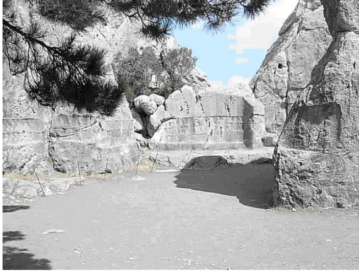
Tablo 1. Yazılıkaya A odasının genel görüntüsü