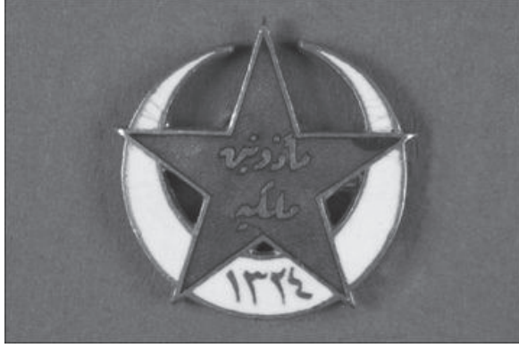
Cemiyet tarafından yaptırılan Mezunîn-i Mülkiye Rozeti

Cemiyet başkanı, engel bir durumu olmadıkça en az bir saat kalmak şartıyla haftada üç gün kulüpte bulunmak zorunda idi (Madde 10). İkinci başkan ise başkan olmadığı zamanlarda başkanlık görevini yürütecekti ve haftada en az iki defa kulüpte bulunup en az birer saat kalmakla yükümlü idi (Madde 11). Muhasebecinin görevi defterlerin ve tahsilatın düzgün ve nizamname maddelerine uygun bir şekilde tutulması ve ne kadar küçük olursa olsun her bir harcamanın belgesini isteyip saklamak idi (Madde 12); zorunlu bir durum söz konusu olmadıkça haftada en az iki saat kulüpte bulunup en az bir saat hesap işleriyle ilgilenmek zorundaydı (Madde 15). Genel katip ise mecmuanın ve yıllığın zamanında çıkarılmasına ve bu konu ile ilgili her türlü yazışmalara nezaret edecek, geçerli bir mazereti olmadıkça her seferinde bir saat kalmak üzere haftada üç gün kulübe gelecekti. (Madde 16).