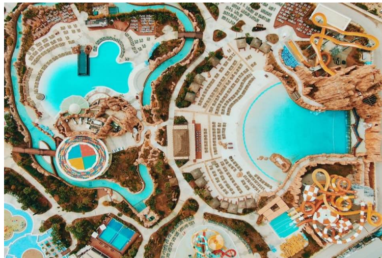
Şekil 2. The Land of Legends hava fotoğrafı

Türkiyenin çocuklara yönelik olarak tasarlanmış ilk oteli olmakla birlikte ruhu hep çocuk kalanlar için de bir eğlence merkezi olmayı hedeflemiştir. Aquapark kısmında ise tropik bitkiler kullanılarak hem mikroklimatik ortamlar oluşturulması hedeflenmiş hem de ekolojik temanın temellerini oluşturulması sağlanmıştır. Toplamda arazi büyüklüğü 620.000+ m 2 ’den oluşmaktadır. Kingdom otel kısmı 5 katta 400 den fazla odaya sahip toplam 1180 yatak kapasitelidir. Antalya şehrinin 111 metrelik yüksekliği ile en yüksek kulesi olan Legend Tower’ı da içinde barındırmaktadır. Bunun yanı sıra eğlenceli aktiviteler tasarlayarak turistlerin ilgisini canlı tutmak amacıyla Franco Dragone hayal gücü, şiir, düş gibi etkiler ile farklı temalı eğlenceler planlanmaktadır.