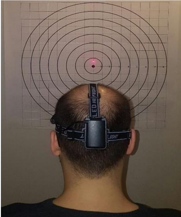
Şekil 2. Lazer imleç Yardımlı Açı Tekrarlama Testi (Lİ-YATT) uygulanması.

Elde edilen her 3 uzaklık değerinin her biri ayrı ayrı 90 cm'ye bölünerek 3 açısal değer elde edildi [Derece = \tan^{-1} (Hata Mesafesi/90 cm)]. Değerlerin ortalaması alınarak kaydedildi. Aynı işlem ekstansiyon, sağ-sol rotasyon ve sağ-sol lateral fleksiyon hareketleri için tekrarlandı.