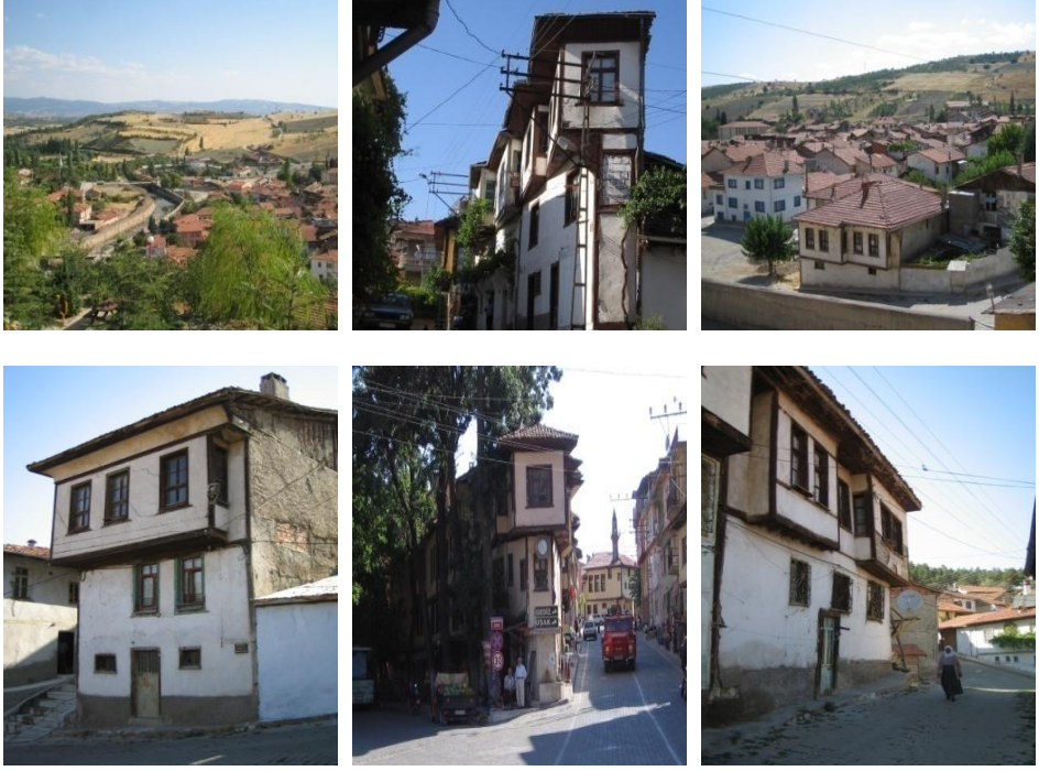
Şekil 4. Eskigediz tarihi kentsel alanı ve yapılarından görünümeler

orijinalliğinin bozulmasına sebep olmuş yapıların özgün görünümüne zarar vermiştir.