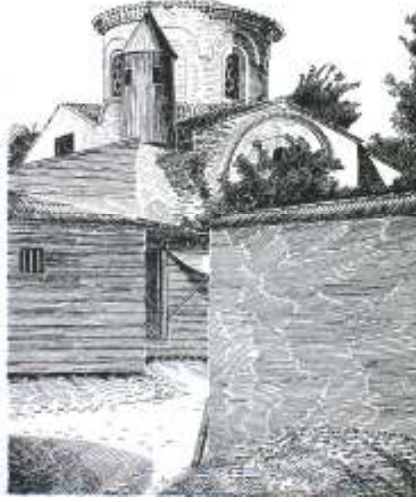
Çizim 3-Hırâmî Ahmet Paşa Mescidi Güney Cepheye Bakış (Gurlitt'ten)