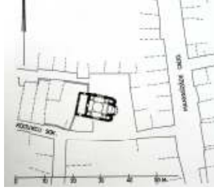
Çizim 1- Hirâmi Ahmet Paşa Mescidi Vaziyet Planı (Müller- Wiener'den)