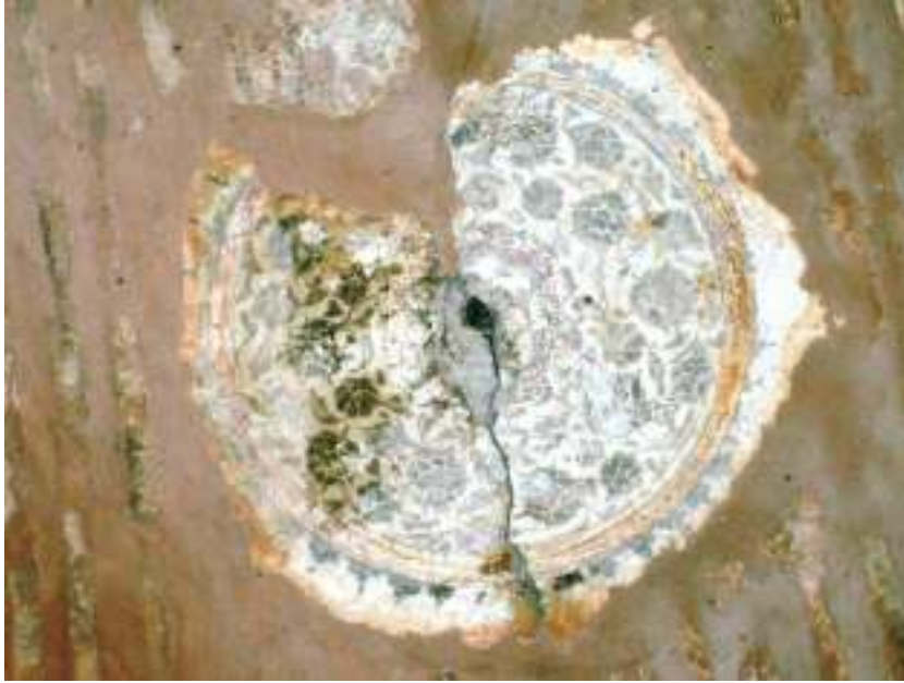
Fotoğraf 12-Hirâmi Ahmet Paşa Mescidi Pandantiflerde Osmanlı Tezyinatı