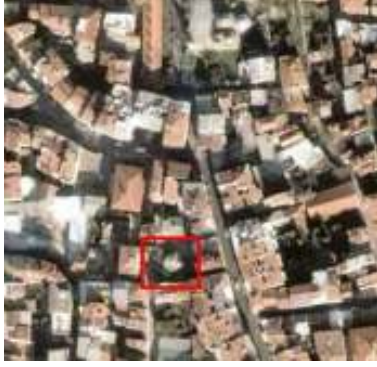
Fotoğraf 1-Hirâmi Ahmet Paşa Mescidi Uydu Fotoğrafı (Google Earth)