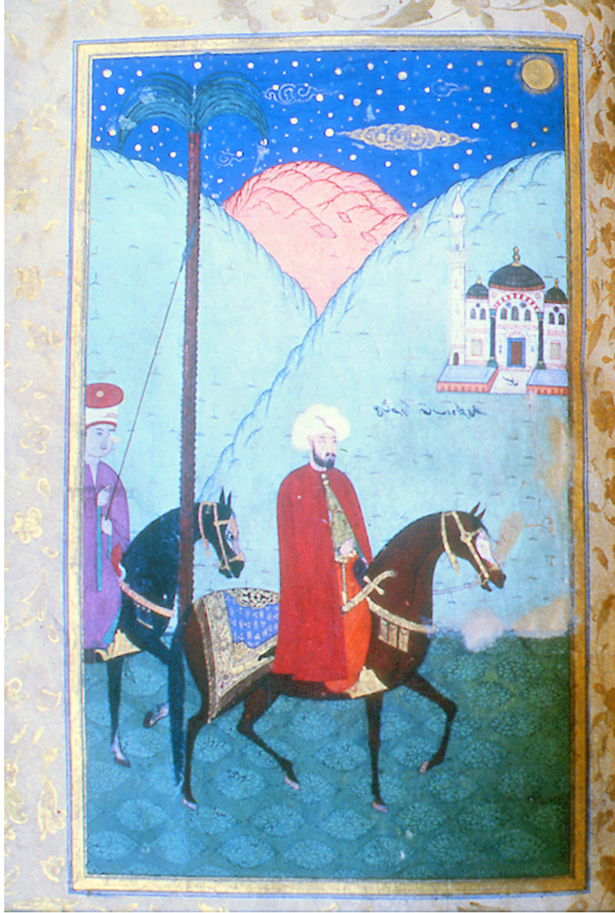
12- Malkoç Ali Paşa'nın Gece Yolculuğu