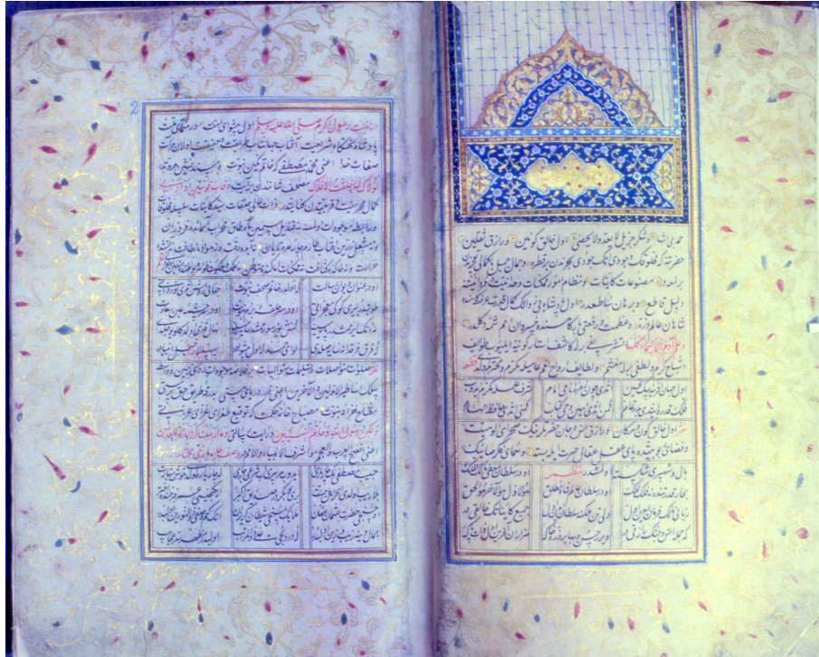
1. Yazmanın zabriye sayfası