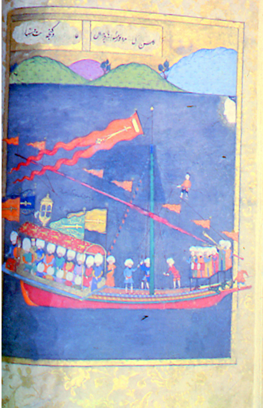
9- Malkoç Ali Paşa'nın Kadırğa İle Nebir Yolculuğu