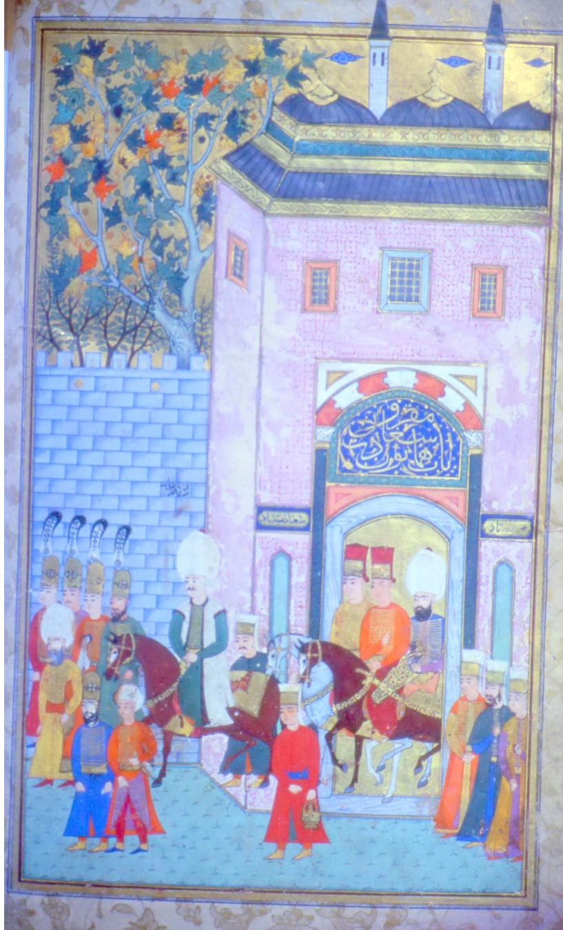
7- Malkoç Ali Paşa'nın Topkapı Sarayı'ndan Yola Çıkışı