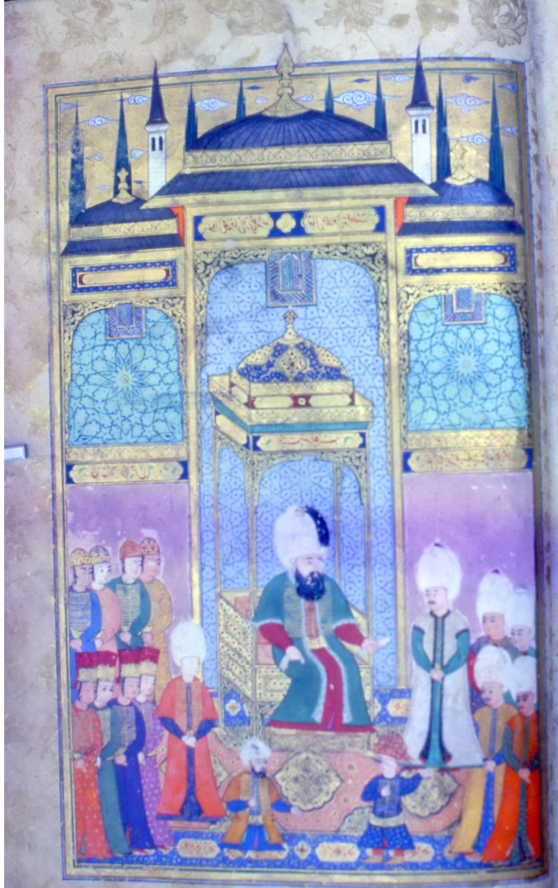
5- Malkoç Ali Paşa'nın, III. Mehmed'in Huzuruna Çıkışı