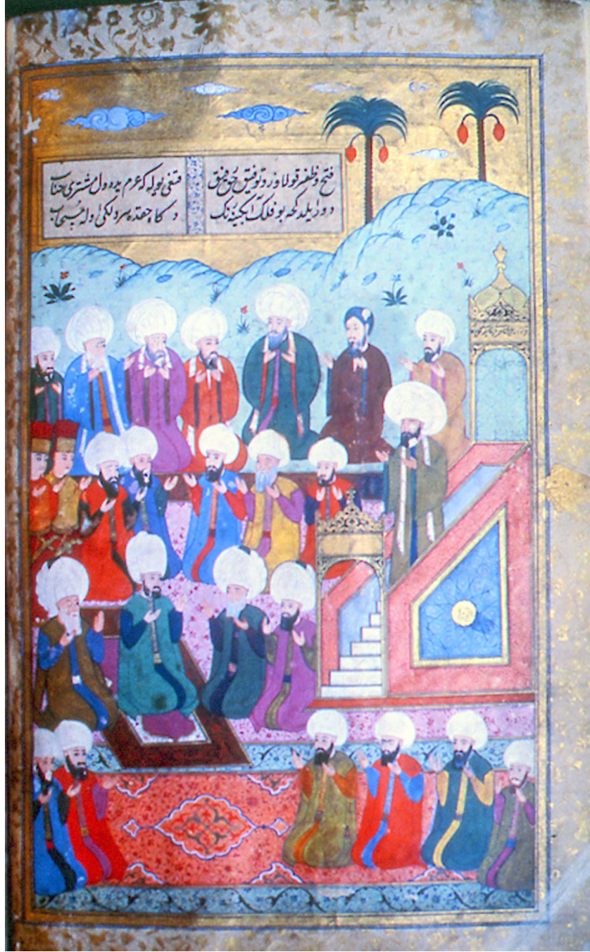
11- Malkoç Ali Paşa'nın Dua Edişi