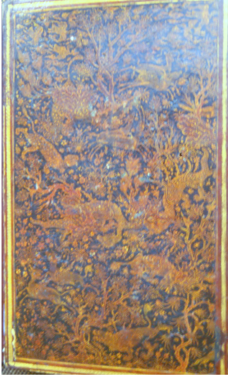
3- Yazmanın cildi