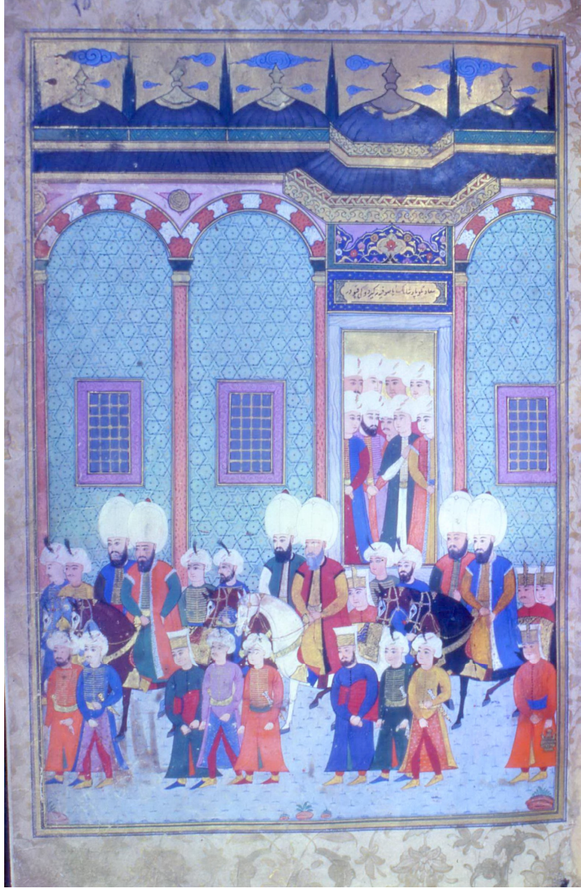
8- Malkoç Ali Paşa'nın Saray Erkânı Tarafından Uğurlanışı