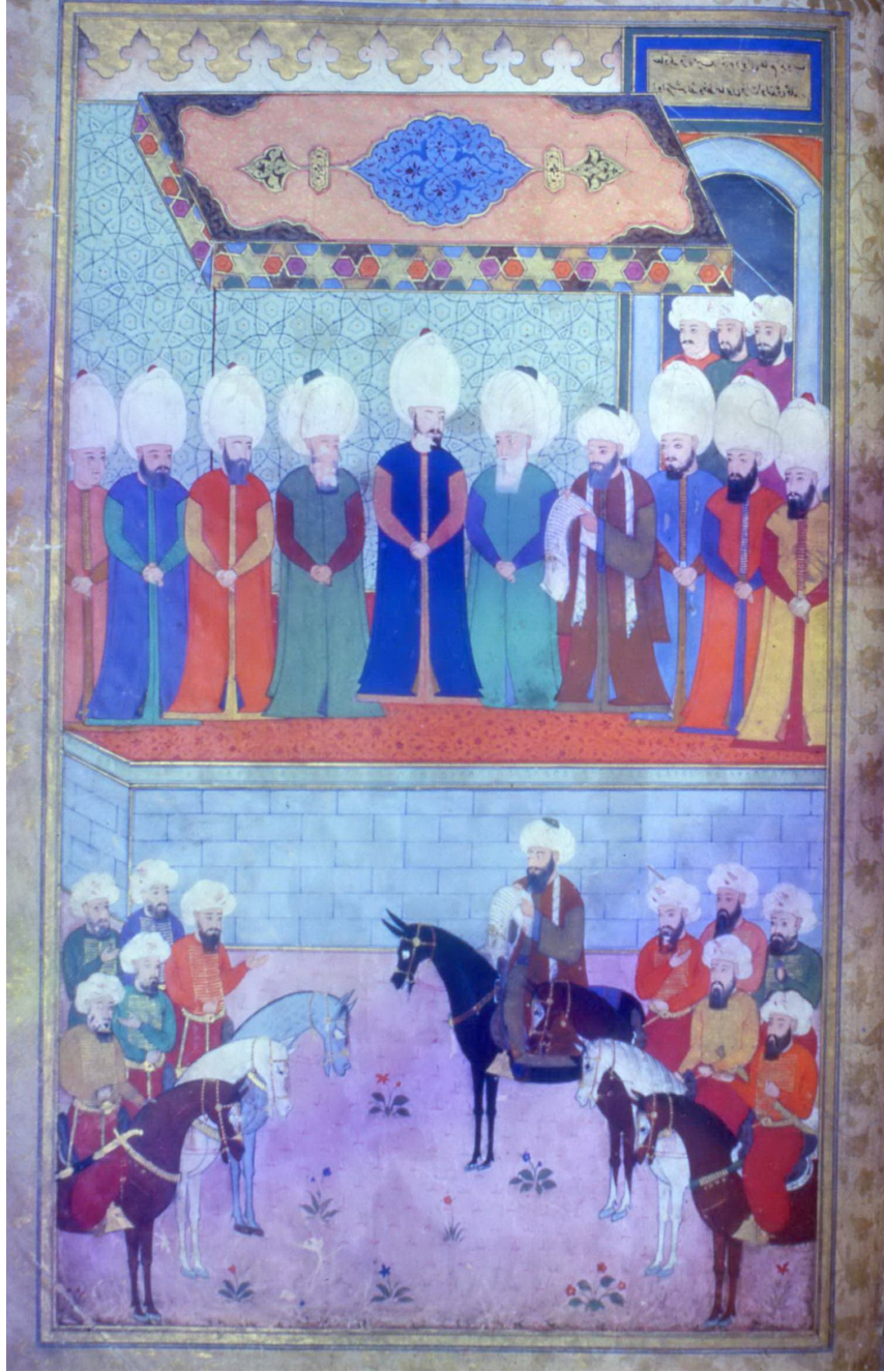
6- Kara Meydanında, Padişahın Emirleri Okuması