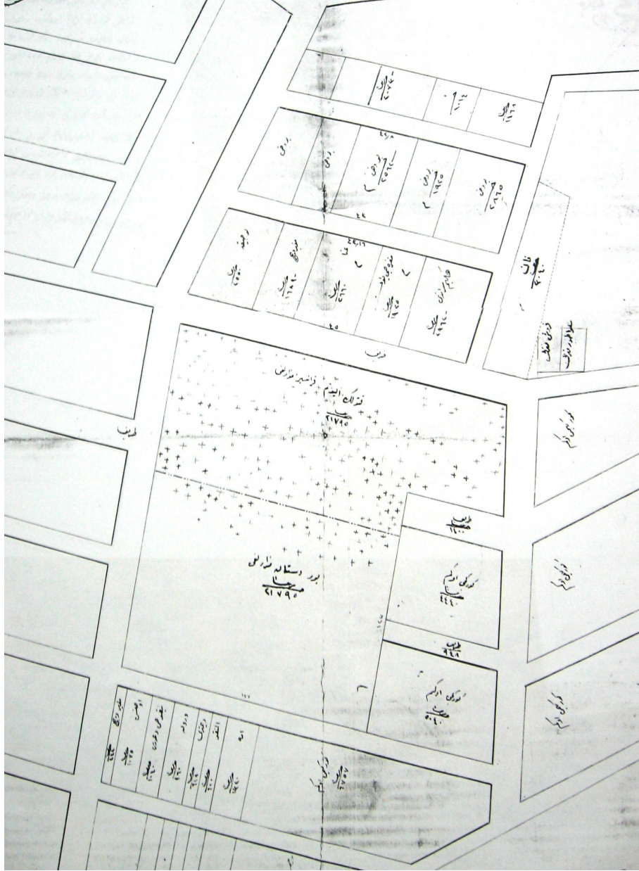
Ek 1: Trabzon'daki Protestanların Mezarlık Olarak Aldıkları Yeri Gösteren Harita

BOA, İ. HR. 141/7372 (12 Receb 1273/8 Mart 1857)